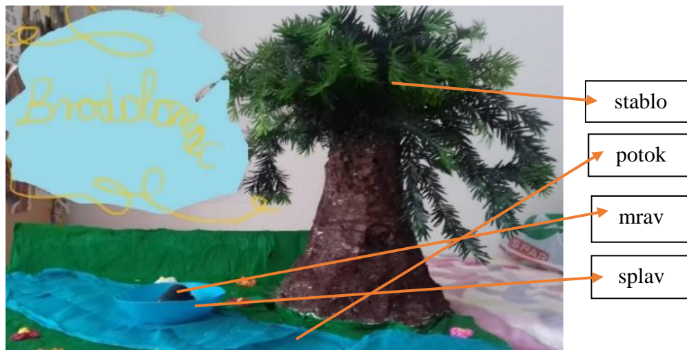
Slika br.1 Primjer metodičkoga artefakta

U odgojno-obrazovnoj praksi metodički je predložak potreban za izvođenje metodičkoga čina. U metodici hrvatskoga jezika, to je primjerice pjesma koju odgojitelj predstavlja djeci te s pomoću nje utječe na dječji razvoj (kognitivni, motorički, govorni, socioemocionalni razvoj). Za razumijevanje pojma metodičkoga čina prikazat ćemo primjer interpretacije pjesme Stanislava Feminića, Brodolomac . Poezija se interpretira u obliku igrokaza, uz pomoć izrađenoga metodičkog artefakta.