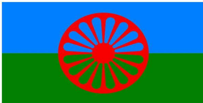
Slika 2. Prikaz romske zastave (Romska Kultura, 2013)

Romska zastava sastoji se od dvije osnovne boje, zelene i plave, a u sredini zastave nalazi se kotač. Zelena boja simbolizira slobodu kretanja i neograničeno prirodno prostranstvo dok je plava simbol nebeskog prostranstva. Kotač u sredini zastave simbolizira vječno putovanje Roma ( Bakić-Tomić i sur., 2014).