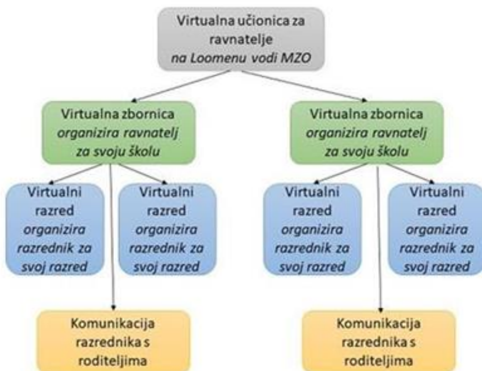
Slika 8 Prikaz strukture virtualnih učionica (Škola za život, 2020).

Sljedeća ilustracija prikazuje strukturu i način funkcioniranja virtualnih učionica, odnosno virtualnih komunikacijskih kanala i razreda: