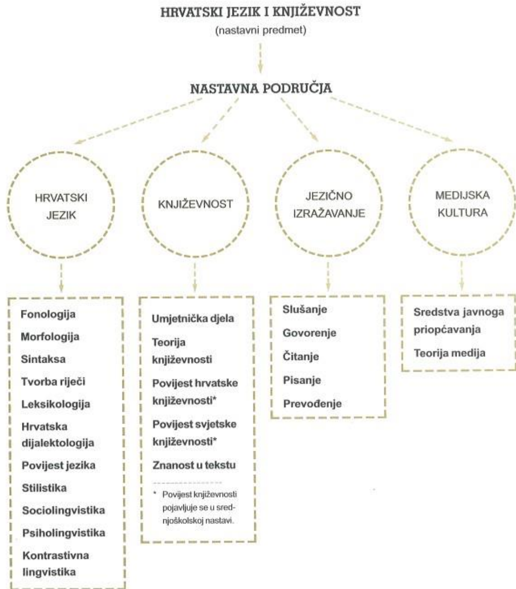
Slika 1. Struktura nastavnoga predmeta Hrvatski jezik (Rosandić, 2002, str. 19)