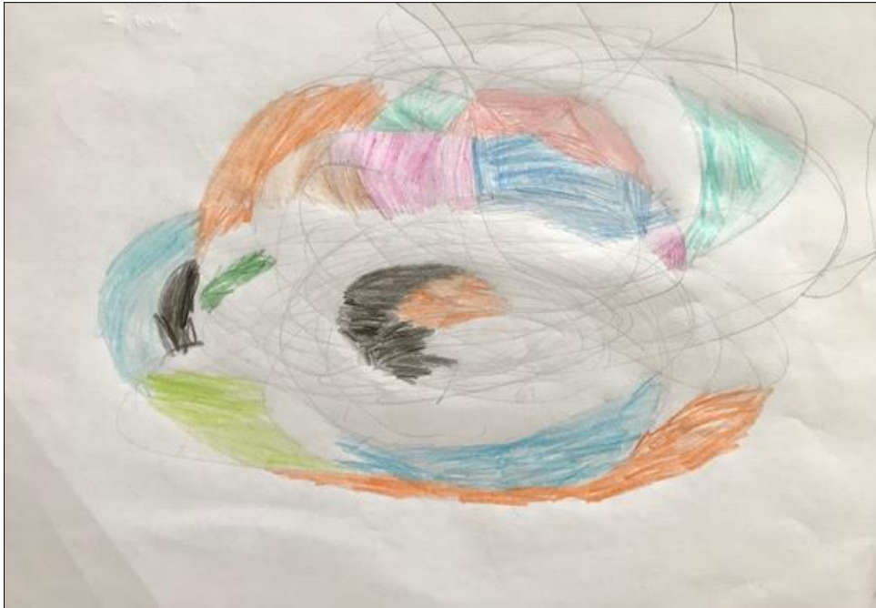
Slika 6: Jakov –fraktalni crtež

Komentari djeteta: "Tu ima sto krugova, ali su svi mali. Kao da se vrte."