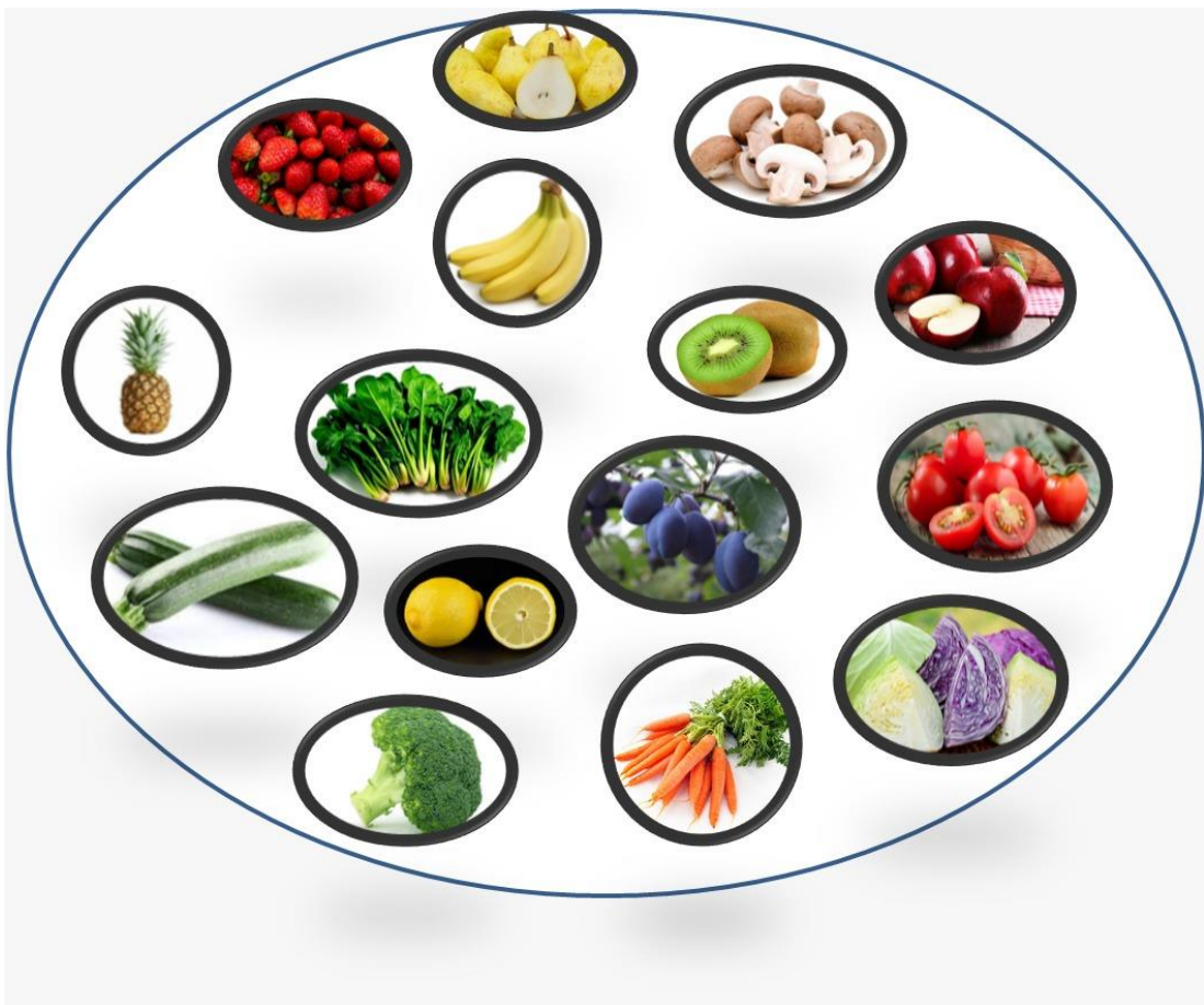
Slika 2. Zdrave namirnice

dječji rast i razvoj. Ona djeca koja prestaju jesti kada osjećaju da su siti, imaju veće šanse da jednog dana neće biti pretili. Znamo da nije lako dijete predškolske dobi maknuti od sokova i ostalih nezdravih tekućina, pa ako već dijete konzumira takve proizvode, dobro bi bilo znati koliko dnevno smije unijeti u svoj organizam, a da se pridržava nekih osnovnih nutrijenata. Dnevni unos voćnog soka u organizam trebao bi količinski obuhvatiti jednu šalicu, čaj, juha i sok od povrća jedna i pol šalice na dan, mlijeka bi trebali unijeti od dvije do tri šalice na dan isto kao i vode. Često se zapitamo je li naše dijete doista gladno ili jede zato jer se javljaju neki drugi osjećaji kao što su tuga, osjećaj usamljenosti, dosada. Ako povežemo osjećaj tuge sa glađu, ta će se veza teško prekinuti, i svaki puta kada će dijete biti tužno, ono će posezati za hranom. Djetetova tjelesna masa znatno će se povećavati, a osjećaj tuge i dalje će biti prisutan, a da se ustvari neće znati pravi razlog zbog kojeg dolazi do toga. Predškolsko dijete na dan jede tri obroka i dvije užine, pa će tako roditelj pokušati te obroke obogatiti sa što više hranjivih tvari.