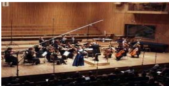
Slika 3. Dvorana Glazbene akademije Fryderyka Chopina 11