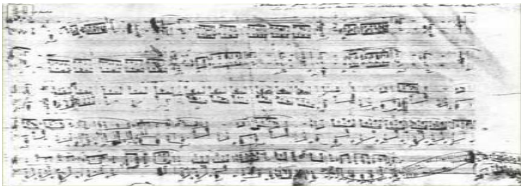
Slika 13. Izvorni rukopisni zapis- Poloneza u As- duru, op 53 26