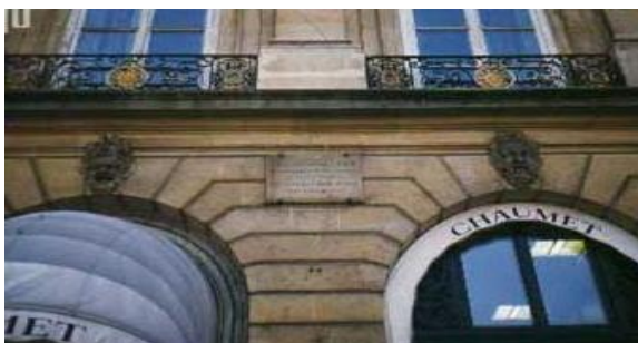
Slika 5. Mjesto gdje se nalazio Chopinov stan u Parizu 15

dopuštenje da se vrati u Varšavu. Chopin je bio moralno primoran biti u zajedništvu s prognanicima i nikada se nije prestao smatrati prijateljem emigranata, samo mu stjecaj prilika nije dao da se bori s njima. Bio je član emigrantskih društava i pomagao je prognanike izdašno. Svaki sunarodnjak koji mu se obratio bio je primljen svim srcem i ljubaznom gostoljubivošću kakvu je naučio u domu svojih roditelja. Spremnost za pomaganje zemljacima te kako se zanima za tuđe brige može se vidjeti Chopinov demokratizam koji mu često poriču. Temeljio se na razumijevanju maloga čovjeka, u iskazivanju ljubavi koju nije uskratio nikom od svojih sunarodnjaka. U kratko vrijeme se uzdignuo na čelo slavni i najslavnijih umjetnika kojih je Pariz bio pun.