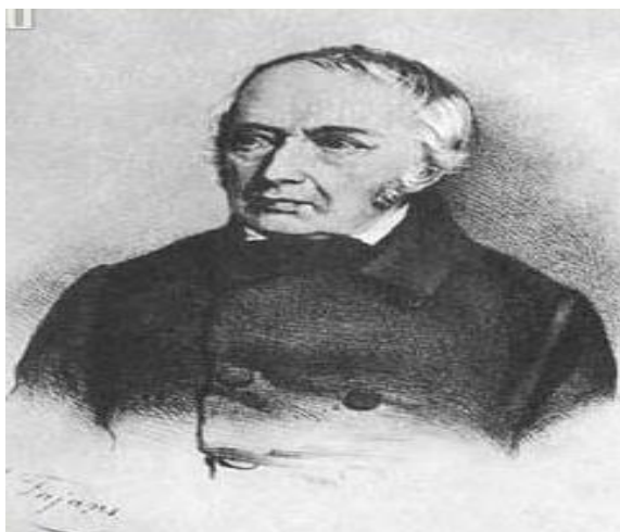
Slika 2. Józef Elsner 9

pohađao srednju školu, u kojoj je predavao njegov otac. Od 1826. počeo je studirati kompoziciju s Józefom Elsnerom, na varšavskom konzervatoriju. Józef Elsner, osim što je bio poznat kao ravnatelj tadašnjeg Varšavskog konzervatorija i kao skladatelj opera i kvarteta proslavio se na osnovu toga što je podučavao Chopina. (Iwaszkiewicz, 2010: 14, 15)