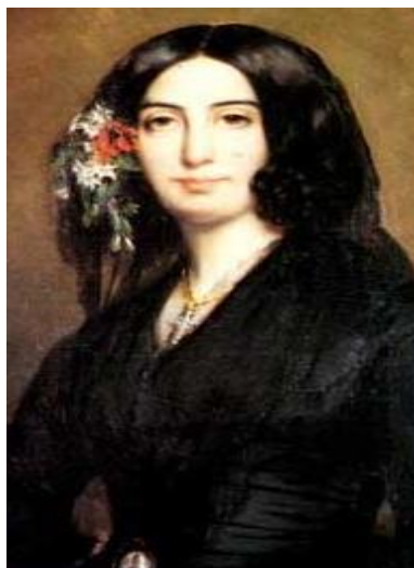
Slika 8. George Sand 20

nesnosnog, boležljivog čovjeka koji je svojim hirovima natjerao u smrt svoju prijateljicu. Bilo kako bilo do razlaza je došlo, a dvoznačna uloga George Sand i do danas ostaje nerazjašnjena. Chopin je, nakon svega, gorko osjetio taj prekid, no to nije odavao obitelji i prijateljima. Mnogo je suprotnih mišljenja izrečeno o njihovom odnosu. Neki kažu da je Chopin bio zli duh gospođe Sand, a drugi pak gospođu Sand nazivaju vampirom, no kako znamo Chopinova ljubav prema Sandovoj korisno se izrazila u njegovoj umjetnosti.