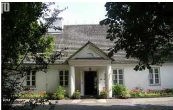
Slika 1. Rodna kuća Fryderyka Chopina, Żelazowa Wola 8