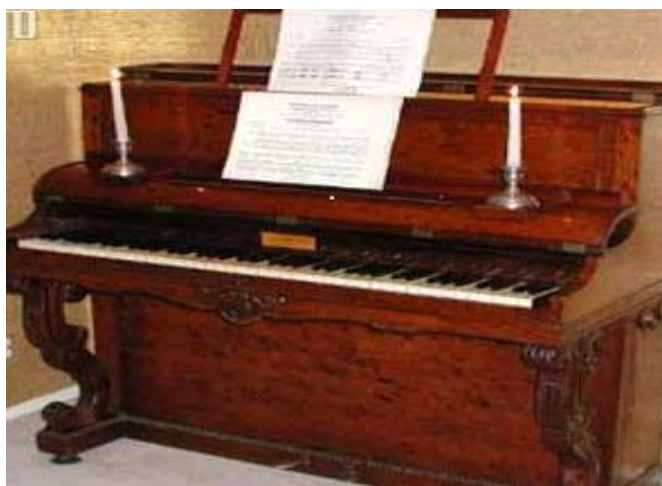
Slika 12. Chopinov pijanino proizvođača Pleyel 24

dinamike, nije tolerirao loše fraziranje te je bio nepokolebljiv u pitanjima ritma. Premda je davanje lekcija klavira bila često zanemarivana aktivnost koja je jamčila stalan prihod, ta pedagoška aktivnost nije bila ništa manje značajna te ju je Chopin shvaćao vrlo ozbiljno i predavao joj svu svoju energiju i entuzijazam. Što se tiče samog glazbala, Chopin se pridružio istraživanju poboljšanja konstrukcije koja je obuhvaćala proširivanje klavijature i povećanja filcanih čekića. Sam je koristio glasovir marke Pleyel nakon pariškog debija u Sali Pleyel te ostao u bliskoj vezi s kompanijom, izvodivši sve svoje javne koncerte u Parizu spomenutom salonu. Među nekolicinom dobrih prijatelja, najvjerniji i najpostojaniji suputnik Chopinu bio je klavir. Chopin ga je pretvorio u medij koji mu je bio potreban da neverbalno izrazi svoje patnje i razdiranja, a ishod potvrđuje da klavir ne zaostaje za orkestrom u sposobnosti buđenja fantazije, osjećaja i drame. (Zorić, 1986: 104- 106)