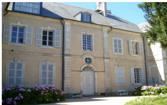
Slika 7. Kuća George Sand u Nohantu 19