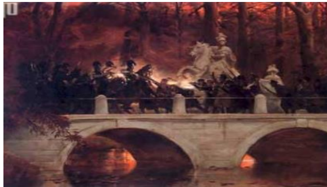
Slika 4. Sukob na mostu Lazienki u Varšavi tijekom Novembarskog ustanka, ulje na platnu- Kossak 13

potpunu lojalnost Poljske Rusiji. Godine 1831. Poljaci su izglasali detronizaciju Nikole I., predstavnika dinastije Romanov s poljskog prijestolja. Već početkom veljače 1831. godine, ruska je vojska prešla granice Poljskog Kraljevstva. Započela je borba te je krajem 1831. godine ugušen ustanak i ukinuta poljska autonomija. Nakon toga dogodilo se još par ustanaka koji su ugušeni i nakon kojih je počela još veća rusifikacija i germanizacija Poljske. Studenački ustanak bio je najveći od ustanaka prije revolucije 1848.- 1849. godine koji je potresao europski poredak. (Agičić, 2004: 11- 53)