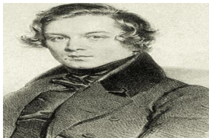
Slika 5. Chopin u mladosti 16

Chopin u to vrijeme obnavlja poznanstvo s bogatom poljskom obitelji Wodzinski. Sinovi te obitelji su neko vrijeme pohađali internat Chopinovih roditelja, a Fryderyk je poučavao glazbu njihovoj sestri, tada djevojčici, Mariji. Chopin se u Parizu brinuo za njezinog brata Antoša koji se upleo u španjolski građanski rat te slao njegova pisma obitelji i tako obnovio poznanstvo. Chopin je podlegao čarima lijepe i razborite gospođice Marije. U Ženevi joj se udvarao Slowcki kojega Chopin nije volio ni poštovao kao pjesnika. Nakon razgovora s majkom gospođice Marije, starom groficom Wodzinkom počeo se obmanjivati nadom u brak. Obećao je staroj grofici da će piti lijekove, ranije ići na počinak i nositi vunene čarape dok je ona bila