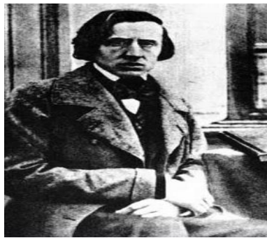
Slika 9. Fotografija Frederica Chopina iz 1848. godine 21

Requiem , Mozarta, Chopinu dragoga kompozitora. Tužnu povorku poveo je Adam Czartoryski, sijedi predstavnik Poljske i Meyerbeer, predstavnik carstva umjetnosti koja je izgubila jednog od svojih najistaknutijih sinova. Uz velike je počasti odnesen na mjesto vječnog počinka, na groblje Pere Lachasie, veliki sin domovine koja tada nije ni postojala. Njegovo je srce, potajno, sestra Ludwika prenijela u Varšavu, gdje je uzidano u jedan stup crkve sv. Križa i sakrito spomen pločom. Tek kad je ustala nezavisna Poljska, mogla se uz staru ploču: Ibi cor meum ubi patria (Tamo je moje srce, gdje je moja domovina) postaviti nova ploča s natpisom: “ Ovdje počiva srce Fryderyka Chopina “. (Iwaszkiewicz, 2010: 76, 77)