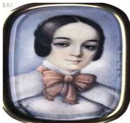
Slika 6. Marija Wodzinska 17

zabrinuta za budućnost svoje kćeri te sa strahom slušala kako Chopin kašlje i promatrala njegovo mršavo i ispijeno lice. Fryderyk i Marija bili su sretni.