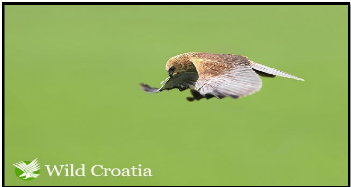
Slika 17. Eja močvarica lovi (Preuzeto iz: www.wildcroatia.net )