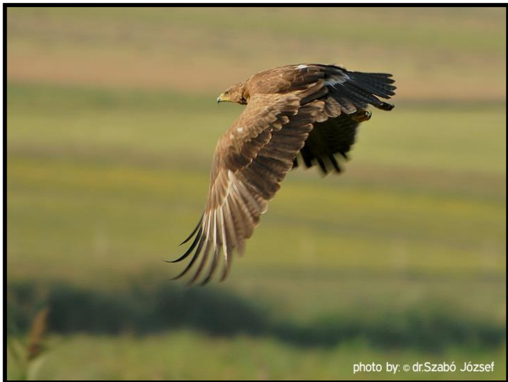
Slika 12. Orola Kliktaš u lovu