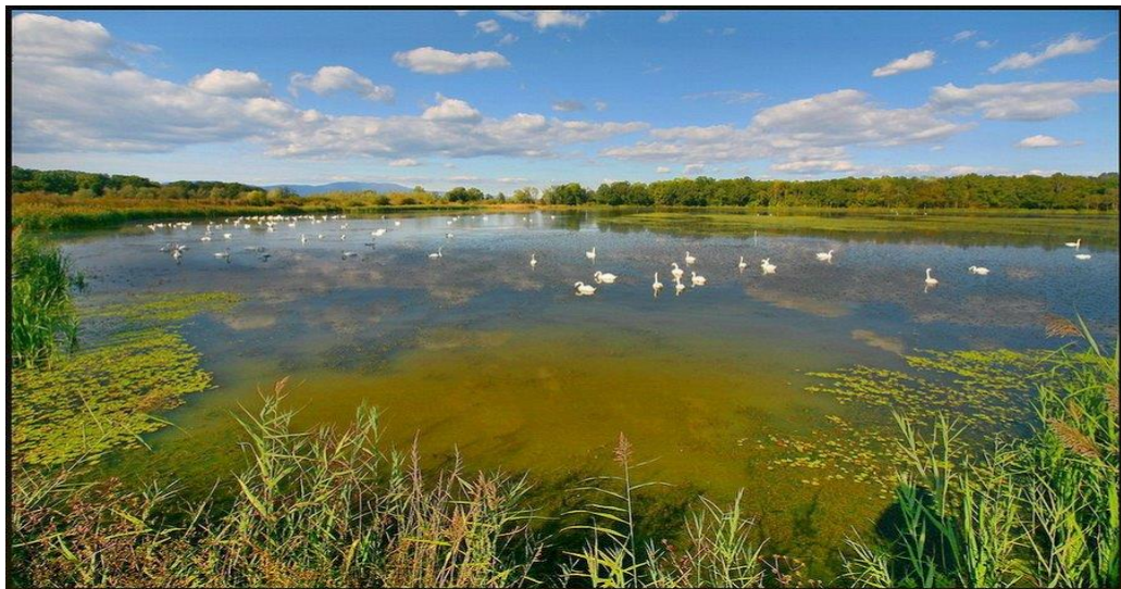
Slika 1. Ornitološki rezervat

Zavod za ornitologiju je znanstvena ustanova osnovana 1901. godine a bavi se sustavnim ekološkim, faunističkim i taksonomskim ornitološkim istraživanjima. Najveća je i najpotpunija ornitološka biblioteka u Hrvatskoj i okolici. Sadrži više od 3000 knjiga i 400 časopisa. Časopis Larus , koji izlazi jednom godišnje još od 1947. godine, objavljuje znanstvene radove, stručne članke, obavijesti i dr. Od velike je važnosti i zbirka ptičjih svlakova 1 i jaja. Zavod provodi i koordinira znanstveno prstenovanje u Hrvatskoj. Zaštita ptica, zaštita prirode općenito, znanstvena ornitološka edukacija, popularizacija ptica važne su djelatnosti koje provodi zavod. Hrvatsko ornitološko društvo utemeljeno 1993. godine, djeluje kao dobrovoljna, nezavisna, strukovna organizacija. Raznim projektima i akcijama, društvo održava i unapređuje raznolikost, rasprostranjenost i brojnost populacija ptičjih vrsta u Republici Hrvatskoj. Njihova zadaća je i unapređivanje zaštite ptica, njihovih staništa i općenito zaštite prirode. (Ornitologija hr http://www.ulika.net/1/ornitologija/ )