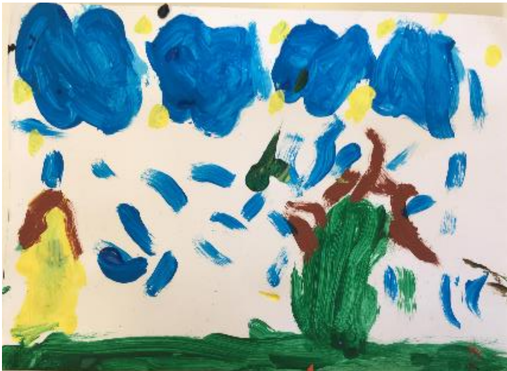
Slika 6. Viđenje grada/sela po noći („Zvezdana noć“) (Ema, 6 god., 2021.)

Umjetničko djelo “Zvezdana noć” inspiriralo je djevojčicu Emu da naslika vlastiti prikaz grada po noći. Koristila je pritom različite nijanse tempera i na svoj način prikazala mjesto koje ima posebno značenje za nju. Prikazala je nekoliko motiva i boja koji se pojavljuju u originalnom djelu, no ipak ih je prikazala na svoj osebujan način, s daškom kreativnosti i mašte, vlastitog poimanja grada.