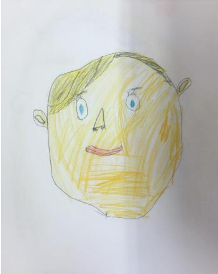
Slika 10. Učenje o sebi, osmišljavanje autoportreta/portreta (“Autoportret”) (Vanja, 6.god., 2021.)

Dječak Vanja se u svom prikazu autoportreta služio isključivo bojicama. U radu nije prisutna šablona, već je isključivo crtao sebe prema viđenju, promatranjem u ogledalo, prikazao je kako sebe doživljava, koristeći svoje umijeće. Vrlo detaljno crta pojedine djelove glave (npr. kosu crta u jednom djelu kraće, a drugi dio je prikazan duži, stavljen s prednje strane, uši imaju još dodatne linije unutar sebe, pazi se na odabir boja).