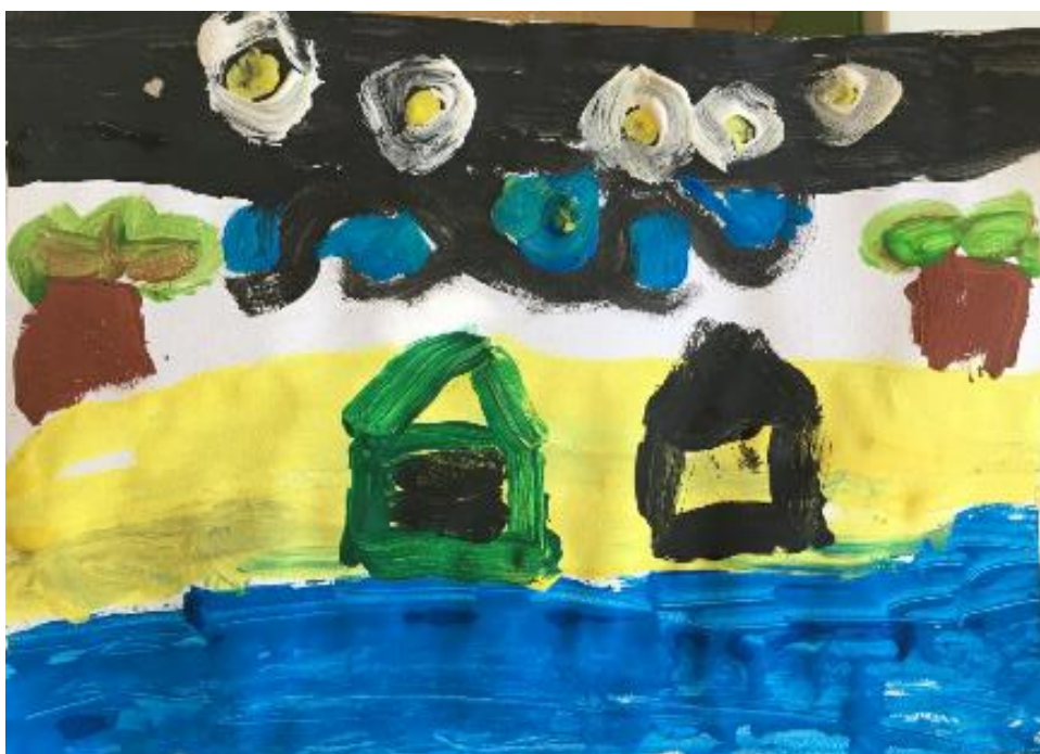
Slika 5. Viđenje grada/sela po noći („Zvezdana noć“) (Mila, 6 god., 2021.)

Sljedeća tri crteža su nastala nakon dječjeg opisivanja zamišljenih mjesta, tokom aktivnosti viđenja grada/sela po noći, inspirirani djelom “Zvezdana noć”.