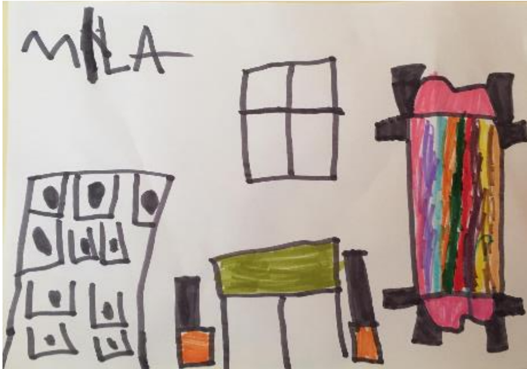
Slika 13. Prikaz vlastite sobe (“Spavaća soba u Arlesu”) (Mila, 6.god., 2021.)

Mila, šestogodišnja djevojčica, je u svojem radu prikazala dijelove svoje sobe, prema sjećanju. Prikazala je predmete u više perspektiva (npr. krevet je nacrtan okomito, s ptičje perspektive, stolci su prikazani u profilu) i boja. Krevetu je posvetila najviše pažnje (prikazala ga je većim i detaljnijim u odnosu na ostale predmete) i iskoristila više različitih boja. Za prozor možemo reći da je nacrtan po šabloni (dvije crte, okomito i vodoravno i okvir u obliku pravokutnika) dok su ostale stvari ipak osmišljene same, od oblika do odabira boja i veličina. Cijeli rad nacrtan je tehnikom flomastera.