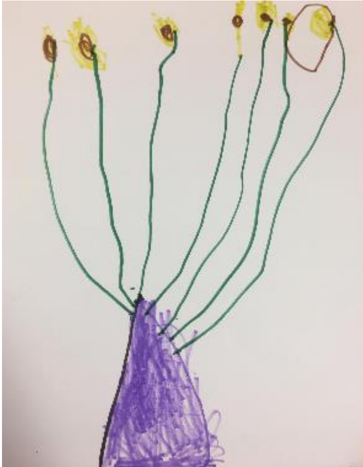
Slika 15. Izrada vlastitog suncokreta („Suncokreti“) ( Dražen, Matija, Ivan, 5 - 6.god, 2021.)

Prva grupa (koja se sastojala od šest djevojčica) je odabrala tehniku kolaža za njihov prikaz suncokreta. Djevojčice su vrlo dobro funkcionirale unutar grupe i brzo su se dogovorile oko raspodjele zadataka. Koristile su boje po uzoru na djelo “Suncokreti”, ali su na papir ipak donjele i dašak originalnosti, odabirom boja i oblika, veličina.