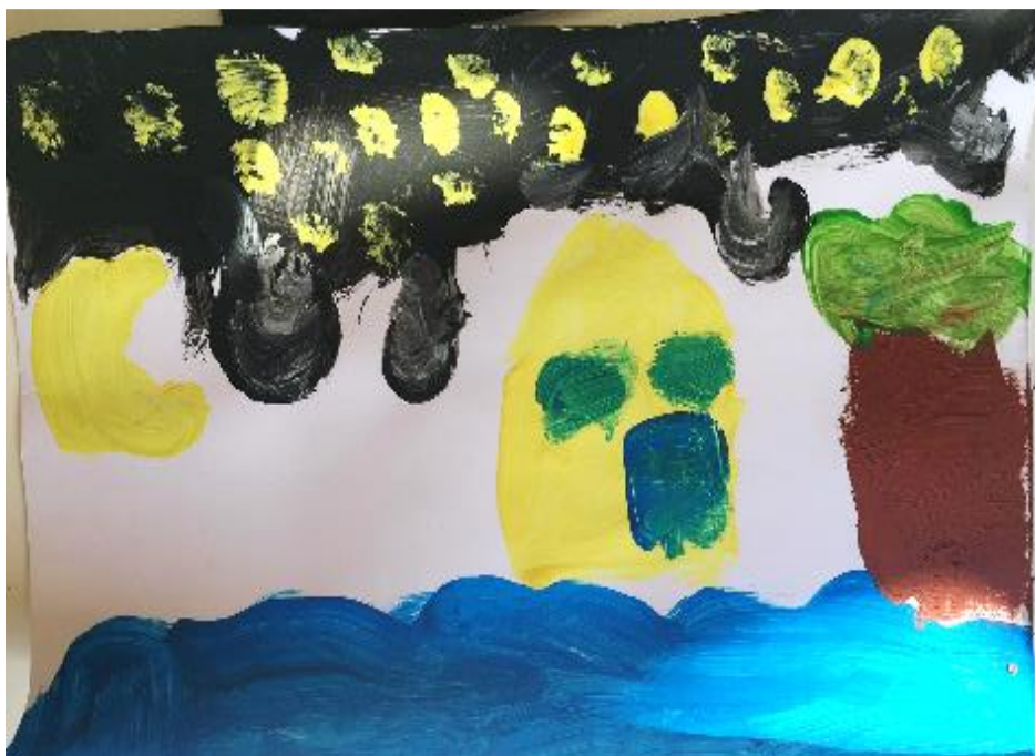
Slika 7. Viđenje grada/sela po noći ("Zvezdana noć") (Jona, 6.god., 2021.)

Šestogodišnja Jona je u svome radu prikazala vlastiti, zamišljeni grad po noći, odnosno mjesto u kojem ljetuje. Koristila je dno papira kao liniju tla i nacrtala more, a u gornjem djelu je prikazala nebo sa žutim zvijezdama u obliku mrlja, otisnutih kistom. Noć je prikazala tamnom, crnom bojom, kojem pridaje veliku važnost, dok je sam grad prikazan tek sa dva elementa. Daljnim razmatranjem umjetničkog djela autora Vincenta van Gogha, primjećuje valovite linije te ih dodaje u svoj rad.