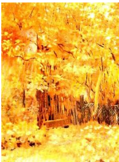
Slika 10 . Vlaho Bukovac. Jesenji pejzaž , 1883.

Nakon boravka u Dalmaciji, 1884.-1885. godine dolazi do prihvaćanja plenearizma i nagoviještanja buduće svijetle skale boja.