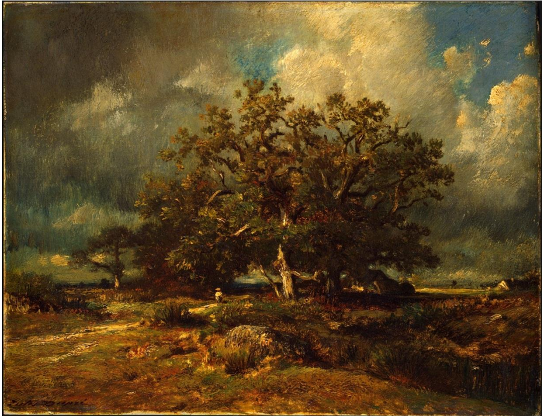
Slika 8. Jules Dupre. Stari hrast , oko 1870. Ulje na platnu. Nacionalna galerija umjetnosti, SAD.