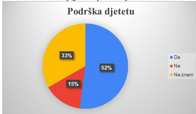
Dijagram 6: podrška djetetu

Sljedeće pitanje se također vezalo na prethodno, pružaju li odgojitelji dovoljno podrške Vašem djetetu, kako bi se lakše nosilo s bolešću? 25 roditelja (52,1%) smatra da pružaju, 7 roditelja (14,6%) smatra da ne pružaju, i 16 roditelja (33,3%) ne znaju, ne mogu procijeniti pružaju li odgojitelji dovoljno podrške djetetu. Podjela je prikazana dijagramom 6.