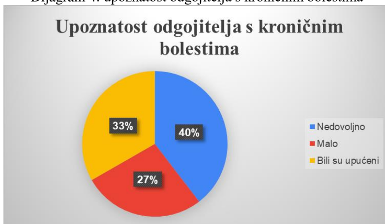
Dijagram 4: upoznatost odgojitelja s kroničnim bolestima