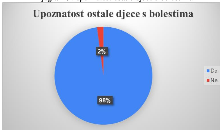
Dijagram 9: upoznatost ostale djece s bolestima

Na samom kraju postavljeno je pitanje ukoliko roditelji smatraju da bi odgojitelji trebali i ostalu djecu u skupini upoznati s bolešću, kako bi se dijete lakše nosilo s bolešću, te kako bi djeca mogla pružiti podršku. Njih 47 (97,9%) smatra da bi trebali upoznati i ostalu djecu s kroničnom bolešću kako bi i oni pružili podršku djetetu, dok samo jedan roditelj (2,1 %) smatra da ne bi trebali upoznati i ostalu djecu s bolešću s kojom se suočava dijete. Rezultat je prikazan dijagramom 9.