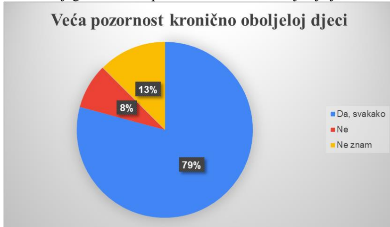
Dijagram 7: veća pozornost kronično oboljeloj djeci