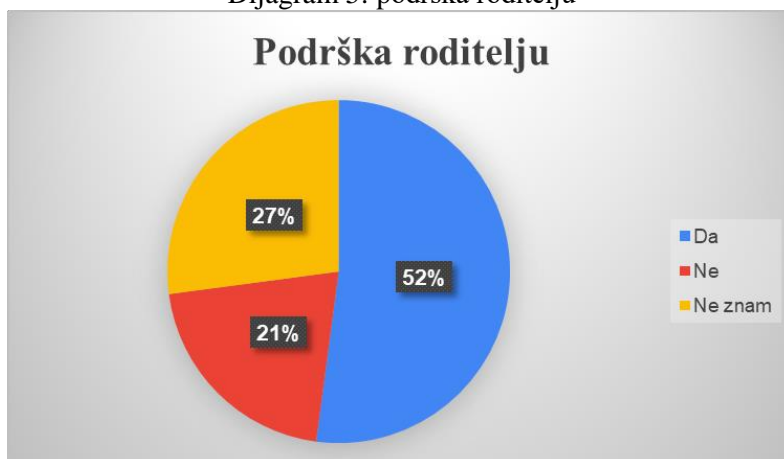
Dijagram 5: podrška roditelju

Pitanje vezano uz cilj ove ankete bilo je pružaju li odgojitelji dovoljno podrške Vama kao roditelju, kako bi se lakše nosili s bolešću? 25 roditelja (52,1%) roditelja odgovorilo je da odgojitelji pružaju podršku, njih 10 (20,8%) smatra da ne pružaju, te 13 (27,1) roditelja ne znaju, ne mogu procijeniti pružaju li odgojitelji dovoljno podrške. Podjela je prikazana dijagramom 5.