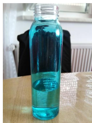
Slika 3. Voda u boci Napomena. Autorski rad