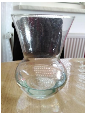
Slika 4. Voda u vazi Napomena. Autorski rad