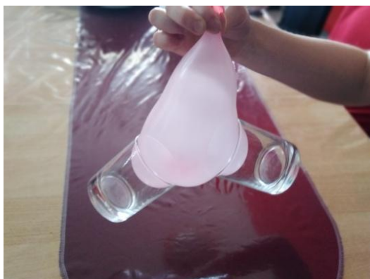
Slika 9. Podizanje balona zajedno s čašama