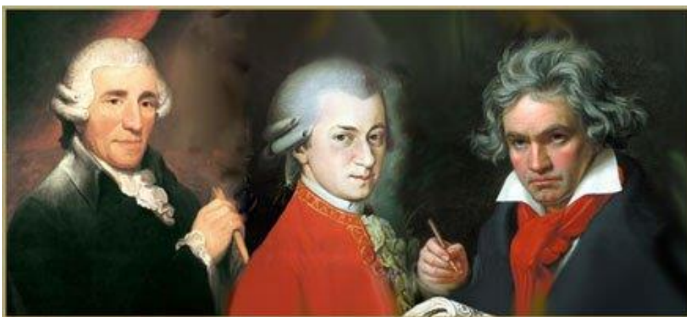
Slika 1.:Predstavници glazbenog klasicizma: Joseph Haydn, Wolfgang Amadeus Mozart i Ludwig van Beethoven 1

Jedna od najvažnijih značajki tog razdoblja je jasnoća mišljenja. Ispod reda i stabilnosti djela klasičnog razdoblja tinjao je nemir koji je doveo do Francuske revolucije na jednom kontinentu i Američke revolucije na drugom. Dok je Haydn, na početku klasičnog razdoblja, bio primjer genija koji služi plemstvu, Beethoven je, potkraj klasičnog razdoblja bio neovisan, strastveni gromovnik koji se nije pokoravao nikome.