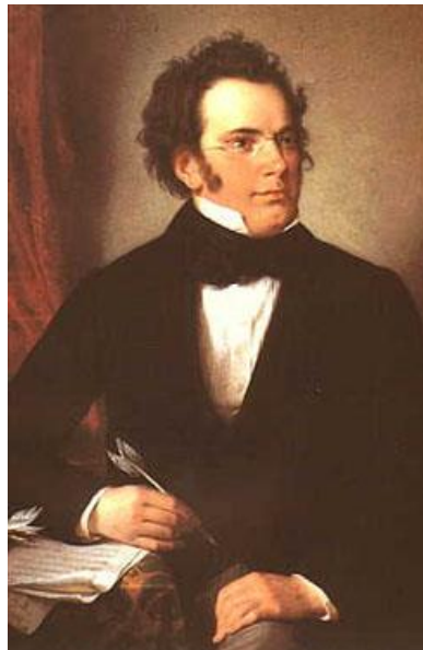
Slika 4.: Portret Franza Schuberta 4

Godine 1817. Schober je Schuberta upoznao s Johannom Michaelom Voglom, uglednim baritonom. Vogl, za kojeg je Schubert napisao brojne pjesme, postao je jedan od glavnih promicatelja Schuberta u bečkim glazbenim krugovima. Upoznao je i Josepha Hüttenbrennera koji je također imao važnu ulogu u promicanju Schubertove glazbe. Ove osobe i brojna kruga prijatelja i glazbenika, kasnije će postati zaslužni za promicanje, sakupljanje i očuvanje njegove glazbe.