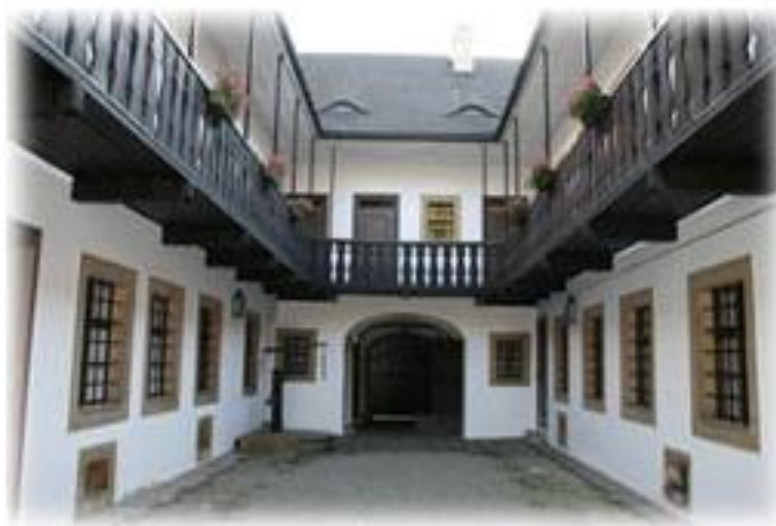
Slika 3.: Rodna kuća Franza Schuberta 3

Franz Peter Schubert rođen je u Beču 31. siječnja 1797. godine kao četvrti sin Franza Theodora Schuberta, učitelja i Elizabeth Vietz, domaćice iz Beča. Kako je odrastao u obitelji glazbeno nadarenih, u razvoju njegovog talenta pomaže otac, stariji brat Ignaz te orguljaš iz crkve „Liechtenthal“. Svoje početke velikog skladatelja bilježi već 1808. godine kada je već kao jedanaestogodišnje dijete primljen na carski dvor, odnosno u sjemenište gdje je unatoč svojoj nostalgiji za domom postizao velike rezultate.