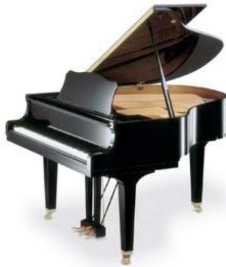
Slika 2.: Glasovir - najpopularnije glazbalo romantizma 2

simboličkim vrijednostima zauzela posebno mjesto u novoj građanskoj glazbenoj kulturi romantizma te ubrzo postala modom, osobito glazba za sve tipove sastava s glasovinom. Mnogobrojnost baroknih trionsonata ili klasicističkih simfonija zamijenila je u romantizmu brojnost komornih skladbi u opusima gotovo svih skladatelja. Proširile su se forme i sastavi: uz gudački i klavirski kvartet pisali su se i gudački kvinteti i seksteti. Komorna glazba s puhačima prerasla je iz ranijega divertimenta u razvijenu koncertantnu komornu glazbu zahvaljujući tehničkomu razvoju glazbala i njihovim novim mogućnostima. Romantizam je osobito volio šarolikost boja (posebno klarineta, fagota i roga), a skladalo se za ansamble od dua i tria preko kvarteta, kvinteta i seksteta do septeta, okteta i noneta. Glavni skladatelji komorne glazbe u prvoj polovici XIX. st. bili su: G. Onslow, L. Spohr, Schubert, F. Mendelssohn i Schumann, a u drugoj polovici Čajkovski, A. G. Rubinstein, Rimski-Korsakov, Saint-Saëns, Gounod, Brahms i R. Strauss.