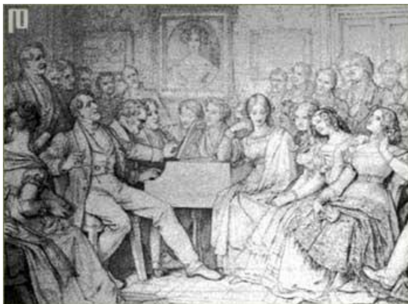
Slika 5.: Franz Schubert za klavirom tijekom jednog nastupa 7

„Godinama, dugim godinama pjevao sam svoju pjesmu. Ali kad sam želio pjevati o ljubavi pjesma se pretvorila u tugu. Kad sam želio pjevati o tuzi pjesma se pretvorila u ljubav! Bio sam podijeljen između ljubavi i tuge! Jednoga dana predamnom se pojavila božanstvena djevojka, koja je netom umrla. I oko njezinog se groba stvorio krug po kojem su kružili mladić i starac u vječnom blaženstvu. Govorili su tiho kao da se boje da će ju probuditi. Božanske misli, poput blistavih strijela neprestano su izvirale iz djevičinog groba i padale su na mladića proizvodeći tihi zvuk. Želio sam koračati krugom. Kažu da se samo čudom može doprijeti do kruga. Pognuo sam pogled prema nadgrobnom spomeniku i nastavio naprijed sporo i predano. I prije nego sam se snašao bio sam u krugu. Iz njega su izvirale najljupkije melodije. Osjetio sam kao da je cijeli cjelcati spektar vječnog blaženstva komprimiran u tom trenutku. Vidio sam i svog oca, punog ljubavi i pomirljivosti. Uzeo me u zagrljaj i zaplakao. Ali ja sam plakao još više.“ 6