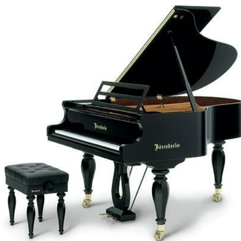
Slika 10.: Koncertni klavir model „Schubert“ 18

„Godinu 1897., 100. obljetnicu Schubertova rođenja, glazbeni svijet je obilježio festivalima i glazbenim izvedbama posvećenim njegovoj glazbi. U Beču je održano deset dana koncerata, a Car Franjo Josip I. održao je govor u kojem priznaje Schuberta kao stvaratelja umjetničke pjesme i jednog od austrijskih najdražih sinova. U Karlsruheu je održana prva produkcija njegove opere Fierrabras . Godine 1928. Schubertov tjedan održan je u Europi i SAD-u kako bi označili sto godina skladateljeve smrti. Schubertova su djela izvođena u crkvama, koncertnim dvoranama i emitirana na radio-postajama. Održano je u njegovu čast i natjecanje s glavnom nagradom od 10.000 američkih dolara pod pokroviteljstvom Columbia Phonograph Company . Pobijedio je švedski skladatelj Kurt Atterberg sa Šestom simfonijom .“ 17