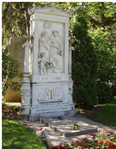
Slika 6.: Grob Franza Schuberta na bečkom groblju "Zentralfriedhof" 8

U bečkom parku „Stadtpark“, 1872. godine, podignut je memorijal Franzu Schubertu. Godine 1888. Schubertov i Beethovenov grob je premješten u središnje bečko groblje "Zentralfriedhof". Tamo se nalaze grobovi Johanna Straussa II. I Johannes Brahmsa. Groblje u Währingu pretvoreno je 1925. godine u park koji je nazvan „Schubert Park“, a bivši grob mu je označen bistom.