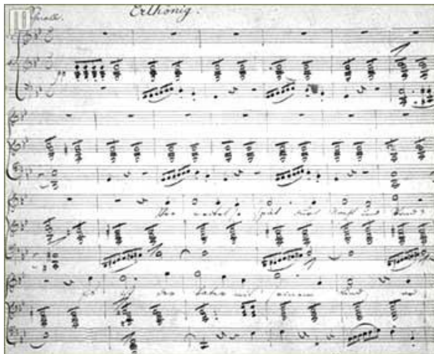
Slika 7.: Izvorni rukopis Franza Schuberta 9

Autor osam dovršenih i dvije nedovršene simfonije, šest misa i komorne glazbe, najpoznatiji je po svojim pjesmama, kojih je napisao više od šest stotina na stihove Goethea, Heinea, Shakespearea i drugih.