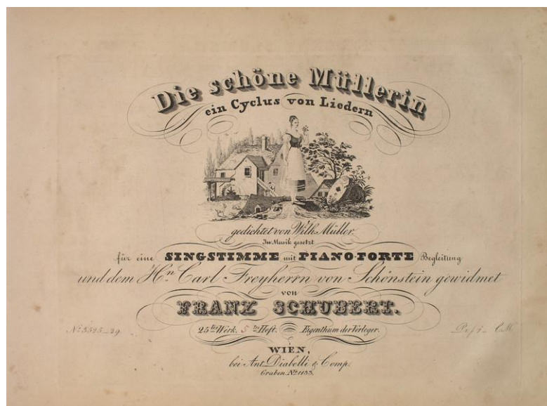
Slika 8.: Naslovna stranica ciklusa „Die schöne Müllerin“, objavljenog 1823. godine. 10

Djela iz 1819. i 1820. pokazala su značajan napredak u razvoju zrelosti i stila. Nedovršeni oratorij Lazarus započeo je u veljači; nakon čega su slijedili, usred brojnih manjih djela, 23. Psalam , Gesang der Geister , Stavak kvarteta i Wanderer fantazija . Od značaja je i uprizorenje dvije Schubertove opere 1820. godine: Die Zwillingsbrüder , 14. lipnja i Die Zauberharfe , 21. kolovoza. Njegove veće glazbene skladbe (osim njegovih misa) izvodio je samo amaterski orkestar „Gundelhof“, skupina koja je izrasla iz zabava kvarteta u njegovom domu. Počeo je zauzimati sve istaknutiji položaj obraćajući se širem krugu publike. Izdavači nisu obraćali pažnju na njega, jedino je Anton Diabelli nevoljko pristao tiskati neka od njegovih djela. Tako je tiskano prvih sedam brojeva opusa (sve pjesme), nakon čega je suradnja prestala. Situacija se poboljšala u ožujku 1821. kada je Vogl otpjevao Der Erlkönig na koncertu koji je bio izuzetno dobro primljen. Taj je mjesec Schubert skladao varijaciju valcera Antona Diabellia i bio jedan od pedeset kompozitora koji su pridonijeli dijelu Vaterländischer Künstlerverein (antologija koja sadrži 81 varijaciju za klavir na teme djela Diabellija).