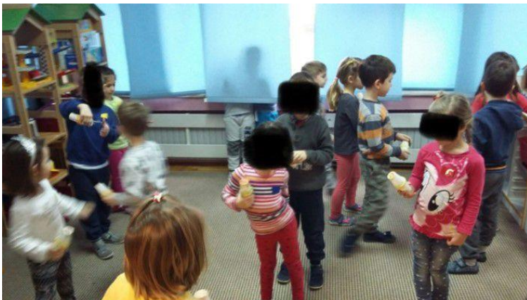
Slika 6. Dijete u ulozi dirigenta

Ulogu dirigenta prvo preuzima voditelj (odgojitelj) kako bi se sva osmišljena pravila demonstrirala. Djeca su bila podijeljena u tri skupine, ovisno o materijalu kojim su se punile zvečke, a svaka skupina je imala i svoju boju markacije na majicama što je djecu zainteresiralo i zadržalo njihovu pažnju. Nakon odgojitelja, odnosno voditelja aktivnosti, ulogu dirigenta preuzimaju djeca, jedno po jedno i tada se počinje promatrati njihovo stvaralaštvo jer stvaraju vlastite skladbe (slika 6.).