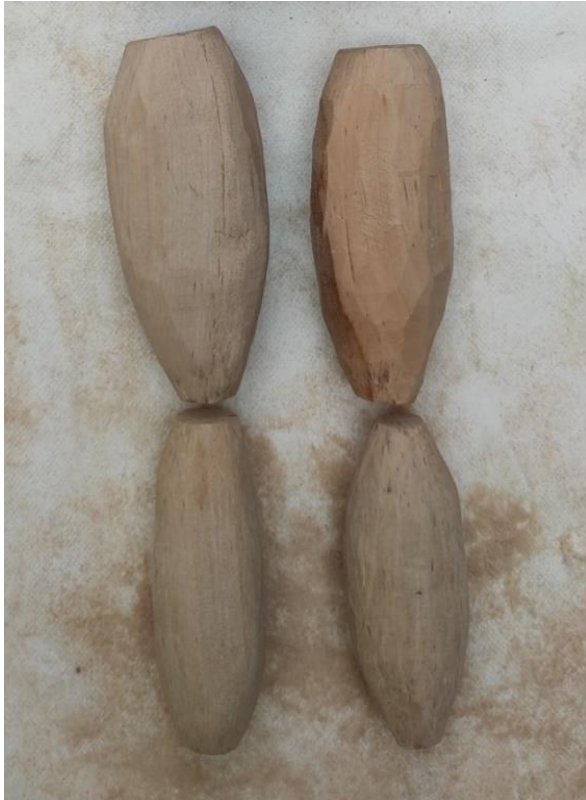
Fotografija 13.