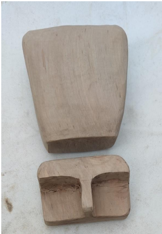
Fotografija 11.