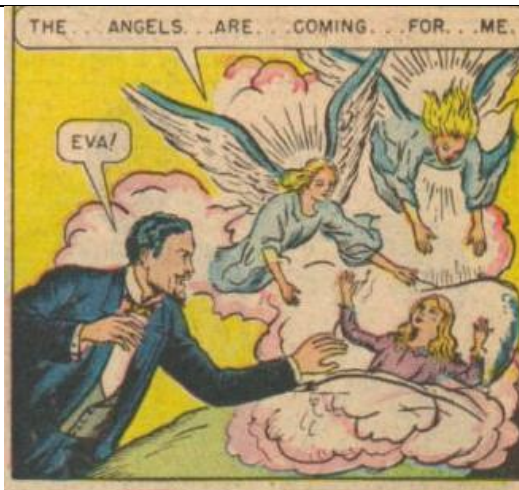
Slika 6-Evina smrt u američkom izdanju

Iako su prethodno navedene vizualne razlike očite, zanimljiva je i činjenica da se ova dva izdanja ne podudaraju s obzirom na određene prikaze radnje. Naime, u stripovima su dva ista događaja prikazana na različite načine (Slika 6 i 7).