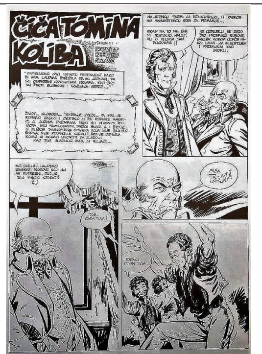
Slika 3-Stranica iz hrvatskog izdanja stripa Čiča Tomina koliba

Dodatna razlika između ova dva izdanja je sam stil, a ujedno i način prikazivanja likova. Dok su u američkom izdanju prikazi nekih likova bliži karikaturi nego li realnom izgledu jedne osobe, stil crtanja korišten u hrvatskom izdanju je iznimno realističan. Ta je razlika očita usporede li se prikazi istoga lika iz američkog i hrvatskog izdanja (Slika 5 i 6).