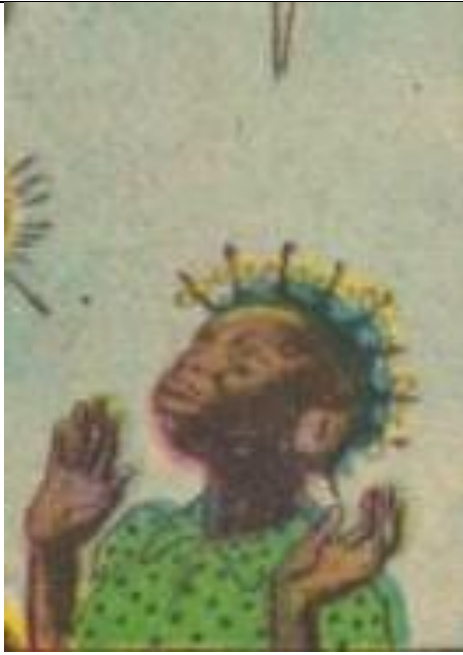
Slika 4-Topsy u američkom izdanju stripa