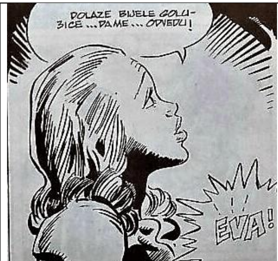
Slika 7-Evina smrt u hrvatskom izdanju

Iz prethodne je dvije slike vidljivo na koji su način sadržaji slika u hrvatskom izdanju stripa prilagođeni. Naime, dok se u američkom izdanju Evi ukazuju anđeli, u hrvatskom je izdanju prikazana samo Eva s pogledom prema gore. S obzirom da je hrvatski strip izdan u razdoblju u kojem je Hrvatska bila socijalistička Republika,