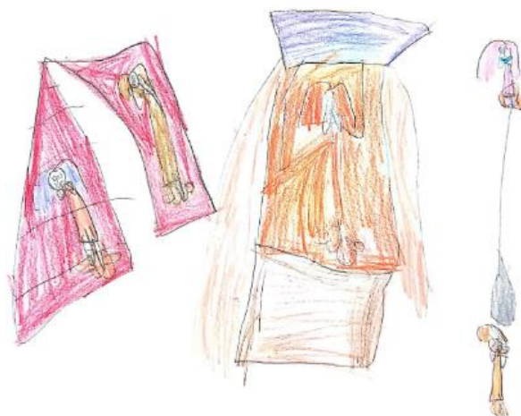
Slika 17. Dječji uradak (šest godina) - tobogan, dvorac i klackalica

Slika 17. – Djevojčica je nacrtala sebe i prijatelje kako se igraju na toboganu, dvorcu na napuhavanje i klackalici. Na ovom crtežu u prvom su planu sprave na igralištu. Nacrtano je petero djece koja se igraju na spravama. Na licima su nacrtane oči, nos i usta, no kod sitnije nacrtane djece ti detalji nisu vidljivi. Ruke izlaze iz glave te su prikazane krugovima. Pažnja je posvećena kosi koja je prikazana vrlo bujno. Crtež je napravljen drvenim bojicama. Prevladavaju crvena i ljubičasta. S obzirom na način oblikovanja, crtež pripada fazi izražavanja složenim simbolima.