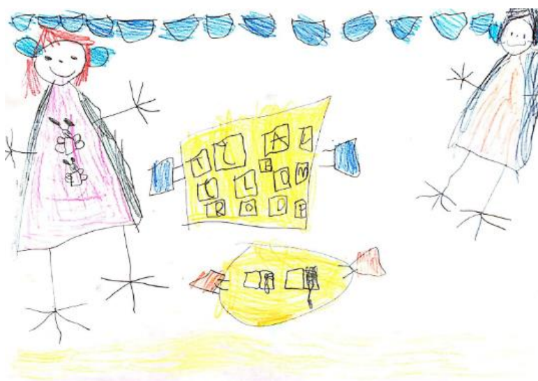
Slika 12. Dječji uradak (šest godina i šest mjeseci) - Memory sa slovima

Slika 11. – Djevojčica je nacrtala sebe i prijateljicu kako igraju Memory. Primjećuje se sličnost s još jednim crtežom iz iste odgojne skupine (slika 8). Vidljivo je kako djevojčica pridaje pažnju detaljima prilikom crtanja. Na nacrtanim likovima uočavamo oči s detaljima (zjenica, trepavice), nos, usta i uši. Prikazane su noge sa stopalima te ruke s točnim brojem prstiju. Crtež je izveden drvenim bojicama. Dijete je za prikaz odjeće koristilo mnogo boja, dok je interijer prikazan u svega dvije boje, žutoj i plavoj. Način oblikovanja sukladan je dječjoj dobi pa ovaj uradak pripada fazi intelektualnog realizma.