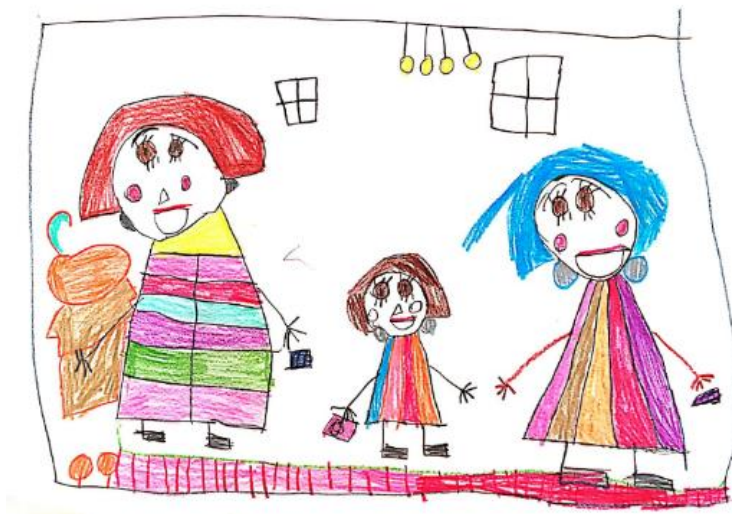
Slika 13. Dječji uradak (šest godina i šest mjeseci) - čitanje

Slika 12. – Djevojčica je nacrtala sebe i prijateljicu kako igraju Memory sa slovima. Na središnjem dijelu papira nacrtani su stolovi s igrama, a likovi djevojčica nacrtani su svaki s jedne strane. Likovi imaju oči, nos, usta i uši. Uši su posebno uočljive jer su obojane plavom bojom. Zanimljivo je kako je djevojčica nacrtala stopala. Prikazana su bosa stopala. Uočljiva je sličnost u crtanju dlanova i stopala. Crtež je nastao drvenim bojicama. Sredinom papira dominira žuta boja, a odjeća likova prikazana je u crvenkastim nijansama. Na uratku je uočljiva poliperspektiva. Likovi djevojčica nacrtani su kao da su gledani frontalno, dok su stolovi nacrtani kao da su gledani iz ptičje perspektive. Ovakav način likovnog izražavanja karakterističan je za fazu intelektualnog realizma.