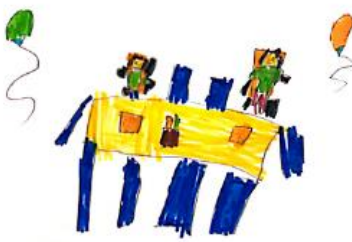
Slika 15. Dječji uradak (pet godina) - crtanje

Slika 14. – Dječak je nacrtao sebe i prijatelje u igri autićima. Nacrtao je četiri osobe, autiće i razne predmete. Vidljivo je kako su osobe nacrtani u parovima, dvije veće i dvije manje, slične osobe. Zanimljive su razlike u prikazu osoba. Kod manjih osoba ruke i noge nacrtane su iz tijela, nacrtane su im oči, nos, usta i uši. Većim likovima noge izlaze iz glave, tijelo im je nacrtano preko nogu, a ruke izlaze iz glave, nacrtane su oči, nos i usta. Oko ljudskih likova nalazi se nacrtano mnoštvo predmeta. Likovna tehnika kojom je nastao ovaj uradak drvene su bojice. Dijete je u crtanju koristilo puno različitih boja. Iako bi prema djetetovoj dobi crtež trebao pripadati fazi intelektualnog realizma, prije pripada u fazu izražavanja složenim simbolima.