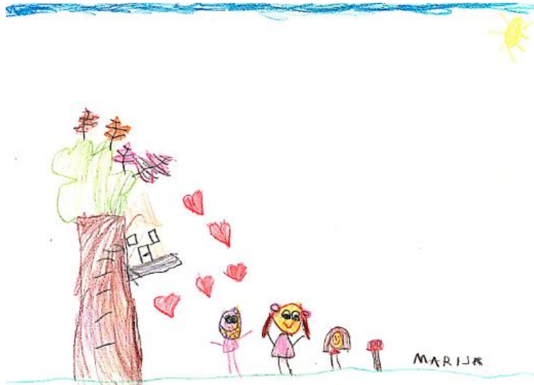
Slika 26.. Dječji uradak (šest godina) - igra u prirodi

Slika 26. – Djevojčica je nacrtala sebe i dvije prijateljice kako se igraju u prirodi. Vide se tri djevojčice, stablo s kućicom, trava, nebo i sunce. Na stablu je nacrtano šareno lišće, a oko kućice na stablu srca. Pažnja je posvećena frizurama. Na glavama, osim kose, uočavaju se oči i usta. Iz trupa izlaze ruke i noge prikazane kao crte, no na njima nema prstiju ili cipela. Tlo je prikazano zelenom linijom, a nebo plavom bojom. Crtež je napravljen drvenim bojicama. Korišteno je puno boja, no zbog puno praznog prostora na papiru boje ne dolaze toliko do izražaja. Način oblikovanja u skladu je s dobi djeteta pa crtež pripada fazi izražavanja složenim simbolima.