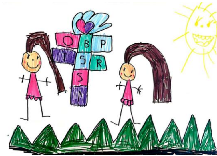
Slika 1. Dječji uradak (šest godina) - Igra školice

Tema je dječjih uradaka „Ja kada se igram s prijateljima“.