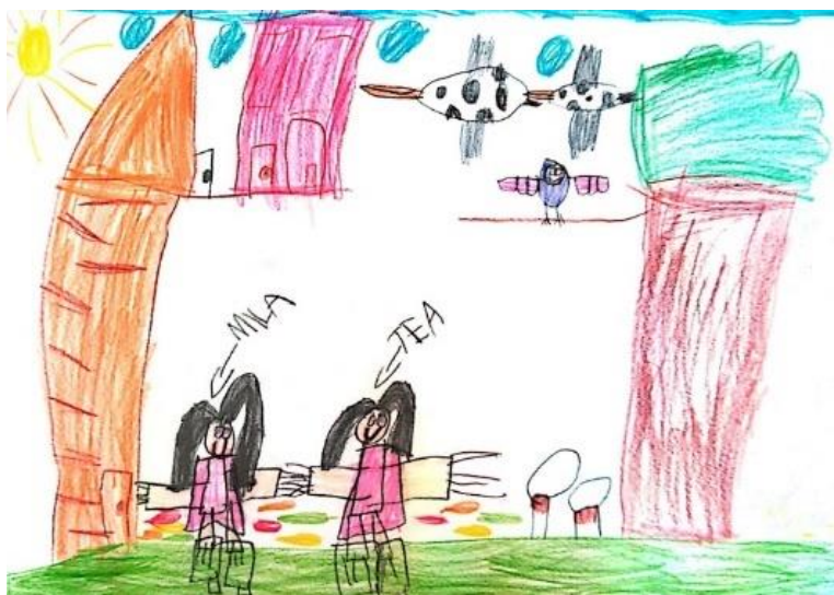
Slika 23. Dječji uradak (šest godina) - igra u prirodi

Slika 23. – Djevojčica je nacrtala sebe i prijateljicu kako se igraju u prirodi. Vidimo dvije djevojčice, ptice, stablo, kućicu, sunce, nebo i oblake te lišće i gljive na tlu. Možemo uočiti transparentnost u prikazu djevojčica. Vidimo im trup, ruke i noge, nožne prste, a preko toga su zatim nacrtane haljine i cipele. Na svakoj ruci nacrtano je pet prstiju, dok su na nogama tri prsta. Na glavi vidimo bujnu kosu, oči i usta. Djevojčice su nacrtane gotovo identično. Ovaj uradak nacrtan je drvenim bojicama. Korišteno je mnogo boja te crtež ostavlja veseo i razigran dojam. Gledanjem uratka može se dobiti dojam linearne perspektive jer su djevojčice nacrtane na travi na rubu papira, one su bliže, dok su stablo i kućica nacrtani malo iznad na gornjem rubu trave, oni su dalje. Načinu oblikovanja sukladan je dječjoj dobi te pripada fazi intelektualnog realizma.