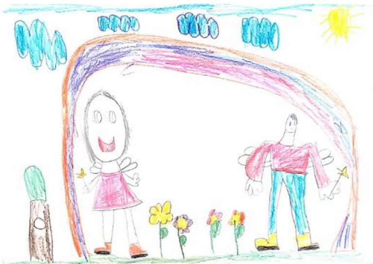
Slika 32. Dječji uradak (šest godina i četiri mjeseca) - igra vilenjaka

Slika 32. – Djevojčica je nacrtala sebe i prijatelja kako se igraju vilenjaka. Dječak i djevojčica nacrtani su ispod duge, imaju krila i čarobne štapiće. Na nogama imaju čizmice, djevojčica nosi haljinu, a dječak hlače i majicu. Izrazi lica im se razlikuju, djevojčica ima širok osmijeh, oči sa zjenicama i trepavicama, dok dječak ima blagi osmijeh, oči i obrve. Između njih je nacrtano cvijeće. Izvan duge nacrtani su oblaci, stablo, nebo i sunce. Naznačeno je tlo i nebo. Može se uočiti emotivna proporcija jer su ljudski likovi prikazani mnogo veće nego stablo. Crtež je napravljen kombinacijom olovke i drvenih bojica. Iako ima mnogo boja, prevladavaju ružičasta i ljubičasta. Način oblikovanja u skladu je s dobi djeteta te crtež pripada fazi intelektualnog realizma.