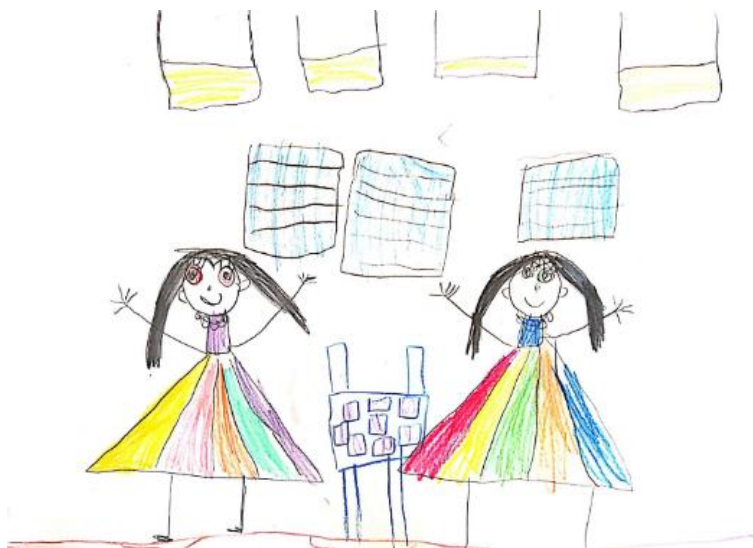
Slika 11. Dječji uradak (šest godina i dva mjeseca) - igra Memory

Slika 11. – Djevojčica je nacrtala sebe i prijateljicu kako igraju Memory. Primjećuje se sličnost s još jednim crtežom iz iste odgojne skupine (slika 8). Vidljivo je kako djevojčica pridaje pažnju detaljima prilikom crtanja. Na nacrtanim likovima uočavamo oči s detaljima (zjenica, trepavice), nos, usta i uši. Prikazane su noge sa stopalima te ruke s točnim brojem prstiju. Crtež je izveden drvenim bojicama. Dijete je za prikaz odjeće koristilo mnogo boja, dok je interijer prikazan u svega dvije boje, žutoj i plavoj. Način oblikovanja sukladan je dječjoj dobi pa ovaj uradak pripada fazi intelektualnog realizma.