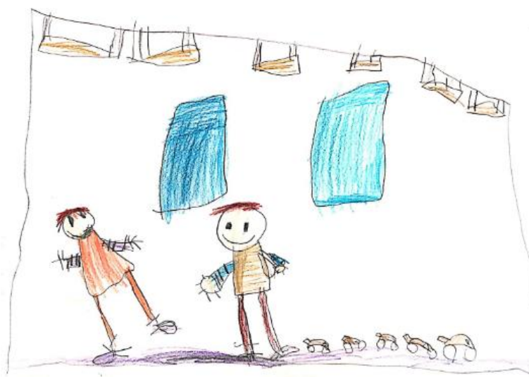
Slika 9. Dječji uradak (šest godina i jedan mjesec) - igra autićima

Slika 8. – Djevojčica je nacrtala sebe i prijateljicu u igru u stolno-manipulativnom centru. Između djevojčica nacrtano je srce. Vidljivo je da su likovima nacrtane oči i usta, rumeni obrazi, a pažnju privlače uši s velikim naušnicama. Likovima su nacrtane noge s naznačenim stopalima, a zanimljivo je kako su prsti drugačije nacrtani na svakom liku. Vidljivo je da je dijete puno pažnje posvetilo detaljima. Likovna tehnika u kojoj je rad nastao drvene su bojice. Korišteno je mnogo različitih boja, a plave boje ima najviše. Može se uočiti poliperspektiva. Likovi djevojčica prikazani su kao da su gledani frontalno, a stol kao da je gledan iz ptičje perspektive. Način oblikovanja prikladan je dobi djeteta pa ovaj crtež može biti svrstan u fazu intelektualnog realizma.