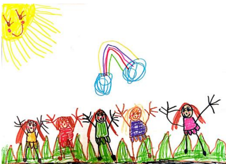
Slika 6. Dječji uradak (šest godina i dva mjeseca) - igra s prijateljima

Slika 5. – Djevojčica je nacrtala sebe i prijateljicu u igri loptom. Na crtežu vidimo jasno odijeljeno tlo, zrak i nebo. U gornjem kutu papira nacrtano je sunce. Djevojčice stoje na travi između cvijeća. Možemo uočiti kako se pravilno izmjenjuju ljubičasto i crveno cvijeće. Na sredini donjeg dijela papira nacrtana je lopta. Djevojčica je sebe i prijateljicu prikazala slično, izrazi lica nacrtani su tako da djevojčice izgledaju radosno. Na licima je nacrtano mnogo detalja. Pažnja je posvećena odjeći. Likovi su prikazani u kretanju. Vidljive su ruke na kojima nisu naznačeni prsti i noge s naznačenim stopalima. Likovna je tehnika flomaster. Crtež pripada fazi intelektualnog realizma.