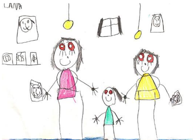
Slika 7. Dječji uradak (šest godina) - igra obitelji

Slika 6. – Djevojčica je nacrtala sebe i četiri prijatelja na livadi. Središnje mjesto na papiru zauzima duga. Duga je također nacrtana i na poleđini papira. U gornjem kutu nacrtano je sunce koje ima oči i usta. Djeca stoje u travi te imaju ruke u zraku, sretni su. Vidljivo je kako je svaka djevojčica nacrtana tako da ima različitu frizuru, dok su im izrazi lica i stil odjeće slični te se haljine razlikuju u boji. Vidljiva je određena individualnost u prikazu likova. Korištena je likovna tehnika flomaster. Korišteno je mnogo različitih boja, no na prvi pogled pažnju privlači zelena boja koje ima najviše. Na nogama su nacrtana stopala, a na rukama točan broj prstiju. Način oblikovanja sukladan je dječjoj dobi te crtež pripada ranoj fazi intelektualnog realizma.