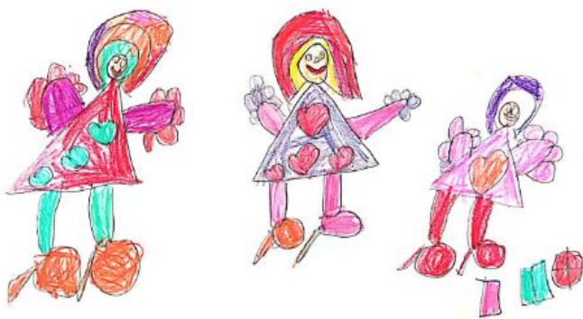
Slika 16. Dječji uradak (šest godina) - igra kockicama

Slika 15. – Djevojčica je nacrtala sebe i prijateljicu kako crtaju za stolom. Nacrtane su dvije djevojčice koje sjede za stolom te dva balona, svaki s jedne strane stola. Sve što je nacrtano nalazi se na sredini donje polovice papira. Na nacrtanim djevojčicama vidljive su oči i usta. Na stolu su nacrtana dva papira na kojima se nalaze crteži te čaša s olovkama. Na crtežu nisu uočljivi detalji na prikazima ljudskih figura koje su vrlo sitne. Naznačene su ruke, noge, tijelo i glava. Likovna tehnika koja je korištena jest flomaster. Boje koje prevladavaju na crtežu jesu plava, žuta, narančasta i zelena. Može se zamijetiti prevaljivanje oblika jer se čini kao da su neke stolice prevaljene na tlo. S obzirom na dječji način oblikovanja, crtež pripada fazi izražavanja složenim simbolima.