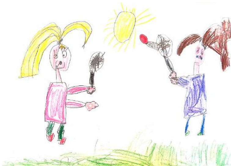
Slika 30. Dječji uradak (šest godina i dva mjeseca) - igra badmintona

Slika 29. – Djevojčica je nacrtala sebe i prijateljicu kako slažu kocke za stolom. Vidimo dvije djevojčice, stol i stolice na kojima se nalaze kockice i prozor kroz koji proviruje sunce. Prikazi djevojčica razlikuju se u boji haljine i frizuri. Izrazi lica zbog načina crtanja očiju djeluju sretno i spokojno. Na licu, osim očiju, vidimo trepavice, nos i usta. Tijelo je nacrtano u obliku trokuta. Može se uočiti kako su na svakoj ruci nacrtana po tri prsta. Ruke su prikazane tankim crtama. Crtež je nastao kombinacijom olovke i drvenih bojica. Iako na crtežu ima više boja, najuočljivije su žuta i ružičasta. Djeluje kao da je mnogo pažnje posvećeno kockicama na stolu jer su nacrtane precizno i detaljno. Prema načinu oblikovanja crtež pripada fazi izražavanja složenim simbolima