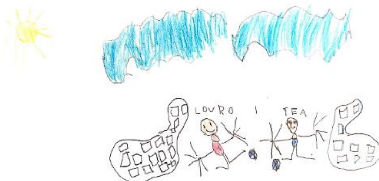
Slika 24. Dječji uradak (šest godina) - igra loptama

Slika 23. – Djevojčica je nacrtala sebe i prijateljicu kako se igraju u prirodi. Vidimo dvije djevojčice, ptice, stablo, kućicu, sunce, nebo i oblake te lišće i gljive na tlu. Možemo uočiti transparentnost u prikazu djevojčica. Vidimo im trup, ruke i noge, nožne prste, a preko toga su zatim nacrtane haljine i cipele. Na svakoj ruci nacrtano je pet prstiju, dok su na nogama tri prsta. Na glavi vidimo bujnu kosu, oči i usta. Djevojčice su nacrtane gotovo identično. Ovaj uradak nacrtan je drvenim bojicama. Korišteno je mnogo boja te crtež ostavlja veseo i razigran dojam. Gledanjem uratka može se dobiti dojam linearne perspektive jer su djevojčice nacrtane na travi na rubu papira, one su bliže, dok su stablo i kućica nacrtani malo iznad na gornjem rubu trave, oni su dalje. Načinu oblikovanja sukladan je dječjoj dobi te pripada fazi intelektualnog realizma.