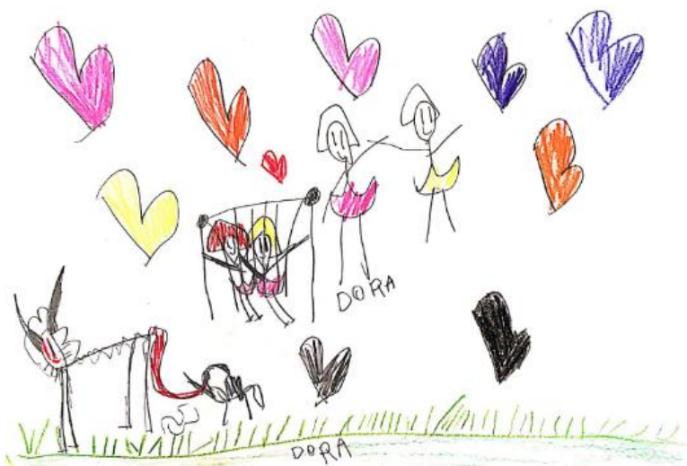
Slika 10. Dječji uradak (šest godina i osam mjeseci) - igra na igralištu

Slika 9. – Dječak je nacrtao sebe i prijatelje u igri autićima. Nacrtani predmeti nalaze se unutar okvira. Uočljiva su dva plava pravokutnika na sredini papira. Uz gornji rub papira nacrtani su stolovi. Likovi imaju nacrtane oči i usta, nasmiješeni su. I na ovom uratku može se zamijetiti kako su likovima ruke drugačije prikazane. Likovna su tehnika drvene bojice, a od boja najviše su zastupljene plava i smeđa. Na ovom uratku uočljivo je prevaljivanje oblika, ljudski likovi imaju svoje tlo, a stolovi imaju svoje tlo. Pojava prevaljivanja oblika karakteristična je za fazu intelektualnog realizma.