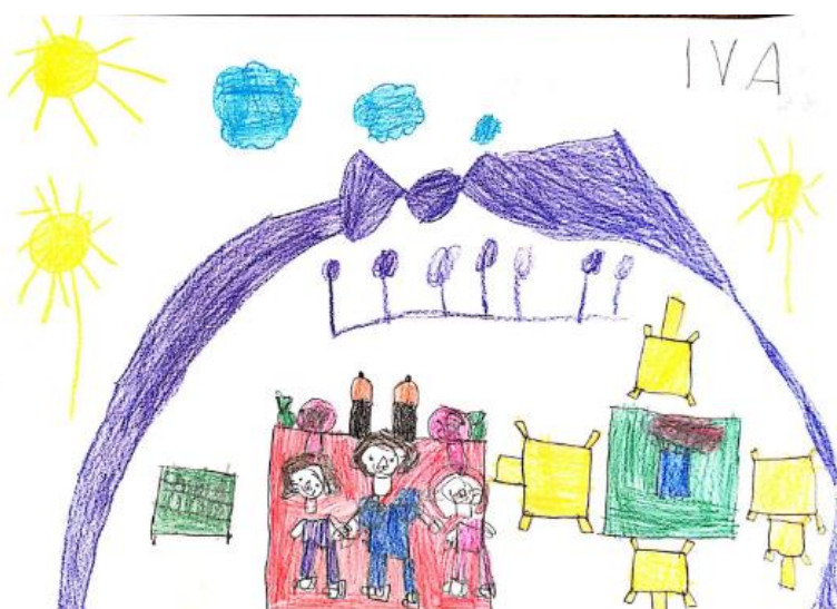
Slika 31. Dječji uradak (šest godina i jedan mjesec) - igra u vrtiću

Slika 30. – Djevojčica je nacrtala sebe i prijateljicu kako igraju badminton. Vidimo dvije djevojčice kako stoje na livadi i igraju se, svaka u ruci drži reket, a jedna reketom udara lopticu. Između njih nalazi se sunce. Ljudski likovi prikazani su s puno detalja. Vidimo trup, noge i cipele, ruke s prstima i dlanovima nacrtanim u obliku kruga s naznakama prstiju, vrat i glavu na kojoj su nacrtane oči sa zjenicama i trepavicama, nos i usta. Pažnja je poklonjena i frizurama. Jedna djevojčica prikazana je kako reket drži dvjema rukama. Prikazana je trava, dok nebo nije naznačeno. Crtež je nastao kombinacijom olovke i drvenih bojica. Način oblikovanja sukladan je dobi djeteta, a crtež pripada fazi intelektualnog realizma.