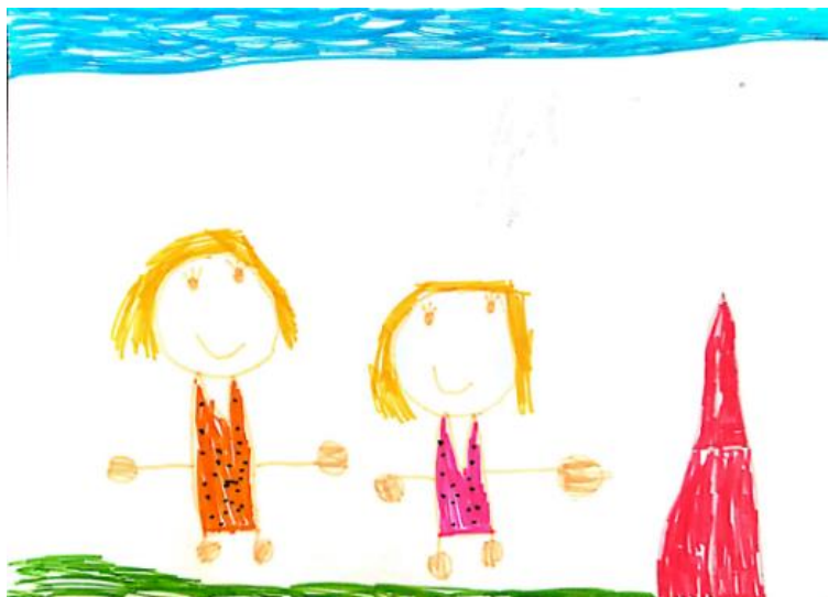
Slika 2. Dječji uradak (pet godina i sedam mjeseci) - igra vani

Slika 2. – Djevojčica je nacrtala sebe i prijateljicu kako se igraju vani. Vidimo plavo nebo i zelenu travu te crveni tobogan. I na ovom crtežu može se uočiti sličnost u prikazu djevojčica. Djevojčice imaju nacrtane oči i usta, sretne su. Likovna je tehnika kojom je nastao crtež flomaster, a boje su žarke i intenzivne. Naznačeni su tlo, zrak i nebo. Likovima su nacrtane noge i ruke, na nogama su naznačena stopala, a na rukama dlanovi bez prstiju. Način oblikovanja sukladan je dječjoj dobi pa se crtež može svrstati u fazu izražavanja složenim simbolima