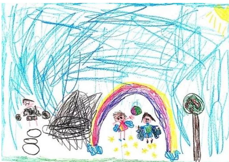
Slika 33. Dječji uradak (šest godina i pet mjeseci) - igra vani

Slika 32. – Djevojčica je nacrtala sebe i prijatelja kako se igraju vilenjaka. Dječak i djevojčica nacrtani su ispod duge, imaju krila i čarobne štapiće. Na nogama imaju čizmice, djevojčica nosi haljinu, a dječak hlače i majicu. Izrazi lica im se razlikuju, djevojčica ima širok osmijeh, oči sa zjenicama i trepavicama, dok dječak ima blagi osmijeh, oči i obrve. Između njih je nacrtano cvijeće. Izvan duge nacrtani su oblaci, stablo, nebo i sunce. Naznačeno je tlo i nebo. Može se uočiti emotivna proporcija jer su ljudski likovi prikazani mnogo veće nego stablo. Crtež je napravljen kombinacijom olovke i drvenih bojica. Iako ima mnogo boja, prevladavaju ružičasta i ljubičasta. Način oblikovanja u skladu je s dobi djeteta te crtež pripada fazi intelektualnog realizma.