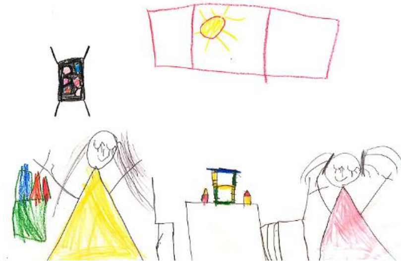
Slika 29. Dječji uradak (šest godina i četiri mjeseca) - igra kockama

Slika 29. – Djevojčica je nacrtala sebe i prijateljicu kako slažu kocke za stolom. Vidimo dvije djevojčice, stol i stolice na kojima se nalaze kockice i prozor kroz koji proviruje sunce. Prikazi djevojčica razlikuju se u boji haljine i frizuri. Izrazi lica zbog načina crtanja očiju djeluju sretno i spokojno. Na licu, osim očiju, vidimo trepavice, nos i usta. Tijelo je nacrtano u obliku trokuta. Može se uočiti kako su na svakoj ruci nacrtana po tri prsta. Ruke su prikazane tankim crtama. Crtež je nastao kombinacijom olovke i drvenih bojica. Iako na crtežu ima više boja, najuočljivije su žuta i ružičasta. Djeluje kao da je mnogo pažnje posvećeno kockicama na stolu jer su nacrtane precizno i detaljno. Prema načinu oblikovanja crtež pripada fazi izražavanja složenim simbolima