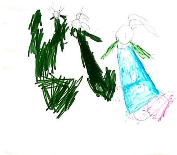
Slika 18. Dječji uradak (šest godina) - igra loptom

Slika 17. – Djevojčica je nacrtala sebe i prijatelje kako se igraju na toboganu, dvorcu na napuhavanje i klackalici. Na ovom crtežu u prvom su planu sprave na igralištu. Nacrtano je petero djece koja se igraju na spravama. Na licima su nacrtane oči, nos i usta, no kod sitnije nacrtane djece ti detalji nisu vidljivi. Ruke izlaze iz glave te su prikazane krugovima. Pažnja je posvećena kosi koja je prikazana vrlo bujno. Crtež je napravljen drvenim bojicama. Prevladavaju crvena i ljubičasta. S obzirom na način oblikovanja, crtež pripada fazi izražavanja složenim simbolima.