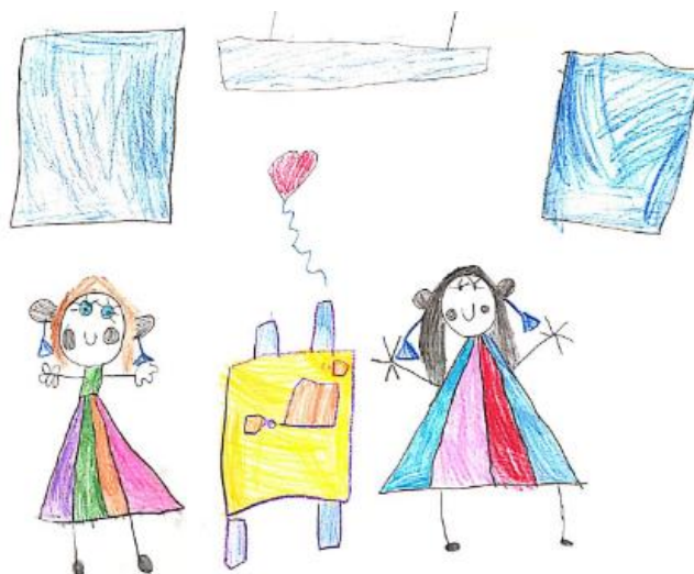
Slika 8. Dječji uradak (šest godina i pet mjeseci) - igra s prijateljicom

Slika 8. – Djevojčica je nacrtala sebe i prijateljicu u igru u stolno-manipulativnom centru. Između djevojčica nacrtano je srce. Vidljivo je da su likovima nacrtane oči i usta, rumeni obrazi, a pažnju privlače uši s velikim naušnicama. Likovima su nacrtane noge s naznačenim stopalima, a zanimljivo je kako su prsti drugačije nacrtani na svakom liku. Vidljivo je da je dijete puno pažnje posvetilo detaljima. Likovna tehnika u kojoj je rad nastao drvene su bojice. Korišteno je mnogo različitih boja, a plave boje ima najviše. Može se uočiti poliperspektiva. Likovi djevojčica prikazani su kao da su gledani frontalno, a stol kao da je gledan iz ptičje perspektive. Način oblikovanja prikladan je dobi djeteta pa ovaj crtež može biti svrstan u fazu intelektualnog realizma.