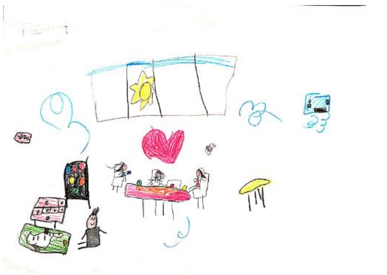
Slika 28. Dječji uradak (šest godina i tri mjeseca) - igra u vrtiću

Slika 27. – Djevojčica je nacrtala sebe i prijateljicu u prirodi. Na crtežu se može uočiti puno detalja, dvije djevojčice, stabla s kojih pada šareno lišće, pticu na grani i ptice koje lete, sunce, oblake i nebo. Vidljivo je kako je odjeća nacrtana transparentno, kroz haljine se vidi trup. Iz trupa izlaze ruke s pet prstiju i noge, prikazani su tankim crtama. Na glavi je nacrtana kosa i oči, nos te usta. Likovna tehnika kojom je napravljen crtež drvene su bojice. Zanimljivo je kako su ljudski likovi prikazani u samo jednoj boji, to jest monokromatski. Jedna je djevojčica zelena, a druga ružičasta. Nacrtani su šareni listovi koji padaju s drveća. Nema naznačenog tla, no prikazano je nebo plave boje. Način oblikovanja u skladu je s dobi djeteta i crtež pripada fazi izražavanja složenim simbolima.