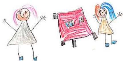
Slika 19. Dječji uradak (pet godina) - igra čavličima

Slika 18 – Dječak je nacrtao sebe i prijatelje kako se igraju loptom. Nacrtana su tri dječaka. Prvo što se uočava na crtežu jesu potezi flomasterom i olovkom koji djeluju nemirno i naglo. Na nekim mjestima boja je probila papir što svjedoči snažnom pritisku i povlačenju flomastera po istom mjestu. Na glavi je nacrtana dugačka kosa, usta i nos te oči. Na dvama likovima uočljive su ruke i noge sa stopalima, dok na krajnjem lijevom liku ti dijelovi tijela nisu jasno vidljivi. Na rukama nisu naznačeni prsti, a ruke djeluju kao da izlaze iz glave. Na crtežu prevladava zelena boja. Dječji način oblikovanja nije sukladan dječjoj dobi te bi crtež prema nekim karakteristikama mogao pripadati u početnu fazu izražavanja složenim simbolima.