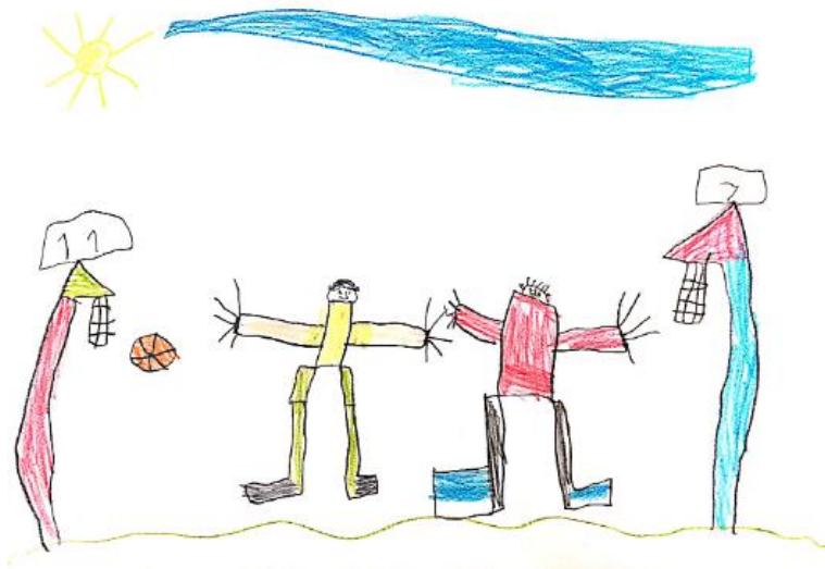
Slika 20. Dječji uradak (šest godina) - igra košarke

Slika 20. – Dječak je nacrtao sebe i prijatelja kako igraju košarku. Vidimo nacrtana dva dječaka, dva koša za košarku, košarkašku loptu, sunce te tlo i nebo. Možemo zamijetiti kako je dječak prilikom crtanja ljudskih likova posvetio pažnju detaljima pa tako vidimo nacrtane obrve, oči, nos, usta, uši i kosu. Na svakoj ruci nacrtano je pet prstiju. Nacrtane su noge sa stopalima. Likovna tehnika kojom je crtež nastao drvene su bojice. U crtanju je korišteno puno boja. Uočljiva je individualnost u stvaranju crteža te posvećivanje pažnje detaljima. Zanimljivi su košarkaški koševi koji imaju ekrane s rezultatima, a i košarkaška je lopta prikazana vrlo precizno. Ovaj je uradak po načinu oblikovanja sukladan dječjoj dobi te crtež pripada fazi intelektualnog realizma.