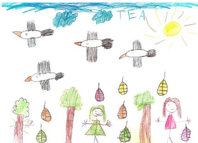
Slika 27. Dječji uradak (šest godina) - igra u prirodi

Slika 26. – Djevojčica je nacrtala sebe i dvije prijateljice kako se igraju u prirodi. Vide se tri djevojčice, stablo s kućicom, trava, nebo i sunce. Na stablu je nacrtano šareno lišće, a oko kućice na stablu srca. Pažnja je posvećena frizurama. Na glavama, osim kose, uočavaju se oči i usta. Iz trupa izlaze ruke i noge prikazane kao crte, no na njima nema prstiju ili cipela. Tlo je prikazano zelenom linijom, a nebo plavom bojom. Crtež je napravljen drvenim bojicama. Korišteno je puno boja, no zbog puno praznog prostora na papiru boje ne dolaze toliko do izražaja. Način oblikovanja u skladu je s dobi djeteta pa crtež pripada fazi izražavanja složenim simbolima.