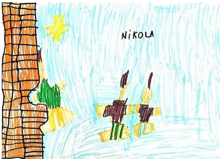
Slika 4. Dječji uradak (pet godina i osam mjeseci) - igra nogometa

Slika 3. – Djevojčica je nacrtala sebe i prijateljicu u igri na igralištu, stoje na travi, a pokraj njih su nacrtani predmeti s igrališta. U gornjem kutu papira nacrtano je sunce koje ima oči, nos i usta. Također, možemo uočiti da su i predmetima s igrališta nacrtane oči i usta, kao i srcu koje se nalazi između djevojčica. I ovdje možemo uočiti sličnost u prikazu djevojčica. Na sredini papira istaknuto je ime. Naznačeno je tlo. Dijete koristi mnogo boja. Na licu je nacrtano mnogo detalja, nacrtane su noge sa stopalima i ruke bez naznačenih prstiju. Korištena likovna tehnika jest flomaster. Način djetetova oblikovanja odgovara dobi te crtež pripada fazi izražavanja složenim simbolima.