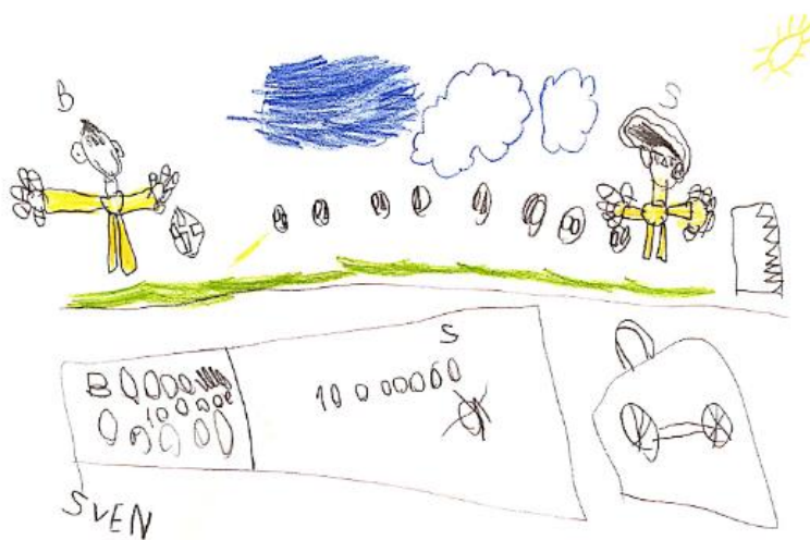
Slika 22. Dječji uradak (šest godina) - igra nogometa

Slika 21. – Dječak je nacrtao sebe i prijatelja kako igraju nogomet. Vidimo nacrtana dva dječaka, dva nogometna gola, loptu i travnjak. Primjećujemo kako su nacrtani svi dijelovi tijela, noge i ruke, trup, vrat i glava. Na glavi su nacrtane oči i usta, jedan dječak ima nacrtane oči sa zjenicama, dok drugi ima nacrtane obrve, trepavice i oči bez zjenice. Možemo primijetiti kako broj prstiju na ruci varira između pet i šest prstiju. Dijete još ne pridaje pažnju točnom broju prstiju na rukama. Crtež je nastao kombinacijom olovke i drvene bojice. Od boja na crtežu uočavamo samo zelenu. Ovaj uradak pripada fazi izražavanja složenim simbolima.