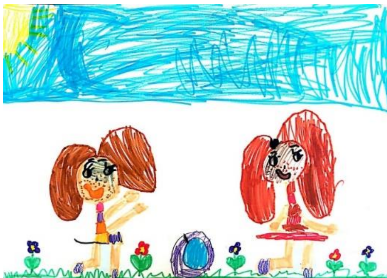
Slika 5. Dječji uradak (šest godina i četiri mjeseca) - igra loptom

Slika 5. – Djevojčica je nacrtala sebe i prijateljicu u igri loptom. Na crtežu vidimo jasno odijeljeno tlo, zrak i nebo. U gornjem kutu papira nacrtano je sunce. Djevojčice stoje na travi između cvijeća. Možemo uočiti kako se pravilno izmjenjuju ljubičasto i crveno cvijeće. Na sredini donjeg dijela papira nacrtana je lopta. Djevojčica je sebe i prijateljicu prikazala slično, izrazi lica nacrtani su tako da djevojčice izgledaju radosno. Na licima je nacrtano mnogo detalja. Pažnja je posvećena odjeći. Likovi su prikazani u kretanju. Vidljive su ruke na kojima nisu naznačeni prsti i noge s naznačenim stopalima. Likovna je tehnika flomaster. Crtež pripada fazi intelektualnog realizma.