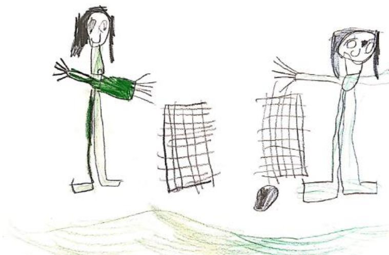
Slika 21. Dječji uradak (šest godina) - igra nogometa

Slika 20. – Dječak je nacrtao sebe i prijatelja kako igraju košarku. Vidimo nacrtana dva dječaka, dva koša za košarku, košarkašku loptu, sunce te tlo i nebo. Možemo zamijetiti kako je dječak prilikom crtanja ljudskih likova posvetio pažnju detaljima pa tako vidimo nacrtane obrve, oči, nos, usta, uši i kosu. Na svakoj ruci nacrtano je pet prstiju. Nacrtane su noge sa stopalima. Likovna tehnika kojom je crtež nastao drvene su bojice. U crtanju je korišteno puno boja. Uočljiva je individualnost u stvaranju crteža te posvećivanje pažnje detaljima. Zanimljivi su košarkaški koševi koji imaju ekrane s rezultatima, a i košarkaška je lopta prikazana vrlo precizno. Ovaj je uradak po načinu oblikovanja sukladan dječjoj dobi te crtež pripada fazi intelektualnog realizma.