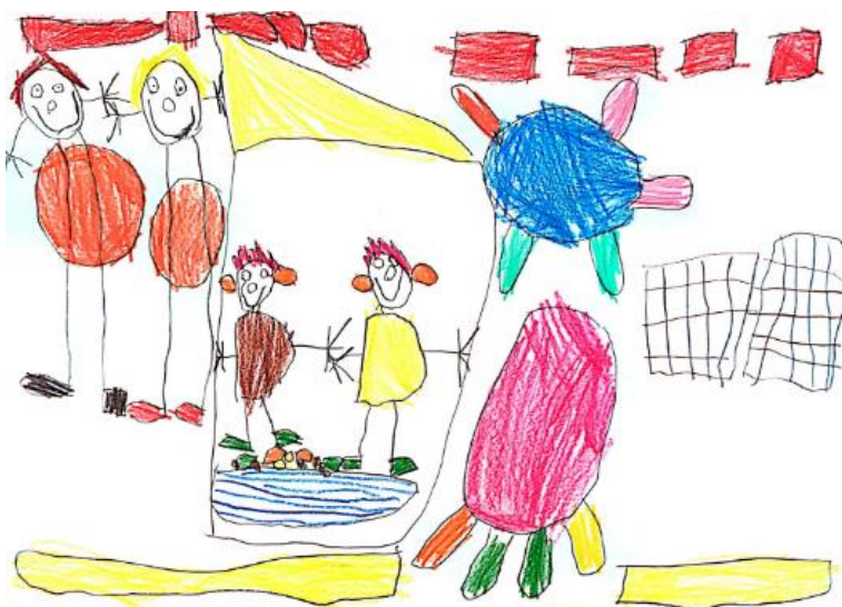
Slika 14. Dječji uradak (šest godina i pet mjeseci) - igra autićima

Slika 14. – Dječak je nacrtao sebe i prijatelje u igri autićima. Nacrtao je četiri osobe, autiće i razne predmete. Vidljivo je kako su osobe nacrtani u parovima, dvije veće i dvije manje, slične osobe. Zanimljive su razlike u prikazu osoba. Kod manjih osoba ruke i noge nacrtane su iz tijela, nacrtane su im oči, nos, usta i uši. Većim likovima noge izlaze iz glave, tijelo im je nacrtano preko nogu, a ruke izlaze iz glave, nacrtane su oči, nos i usta. Oko ljudskih likova nalazi se nacrtano mnoštvo predmeta. Likovna tehnika kojom je nastao ovaj uradak drvene su bojice. Dijete je u crtanju koristilo puno različitih boja. Iako bi prema djetetovoj dobi crtež trebao pripadati fazi intelektualnog realizma, prije pripada u fazu izražavanja složenim simbolima.