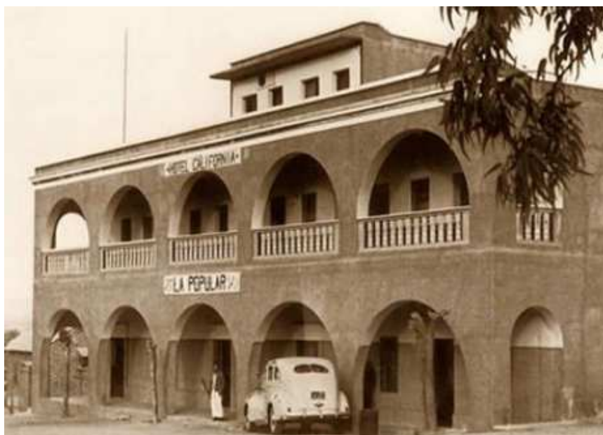
Slika 2 Pansion u kojem se odvija radnja romana Otac Goriot

Balzac je poznat po razini detalja koja ulazi i njegovo djelo. Svoju književnu karijeru započeo je pisanjem libreta za Le Corsaire , komičnu operu nadahnutu knjigom Corsair lorda Byrona. Balzac međutim, nikad nije završio projekt jer nije mogao naći skladatelja koji bi napisao pjesmu za to. Jedno od njegovih najpoznatijih djela je realističan društveni roman Otac Goriot . Roman se smatra i njegovim najčitanim romanom koji je napisan 1834. godine kada je Balzac imao 35 godina. U romanu radi se o suvremenom društvu, a započinje opisom pansiona Vauquer u kojem se nalaze gotovo svi likovi (slika u nastavku).