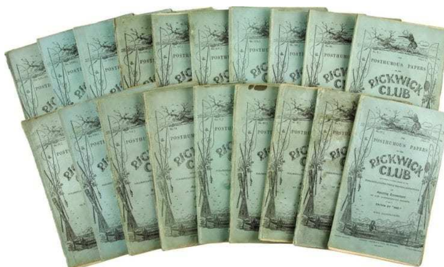
Slika 4 Pickwick Papers

prikazao živote radnika radničke klase, stvarajući likove koje bi nova publika srednje klase u usponu mogla povezati. Realistični viktorijanski roman usredotočio se na likove i teme poput siromaštva i socijalne mobilnosti koja se pružala novoj srednjoj klasi i rastuća srednja klasa željno su konzumirali ove romane. Jedan od najpoznatijih realističkih pisaca, Charles Dickens, svoju je pozornost usmjerio više prema teorijama otkrivenja nego prema reprezentacijskim. Na temu kako se stvarnost shvaća kao ono što je nečijim čulima odmah dostupno, Dickens je dodatno istaknuo važnost pamćenja koje je opisao kao neku vrstu vizije ili načina gledanja na svijet. Štoviše, u svom romanu u stilu pripovijedanja Velika očekivanja , memorija je ključni pojam u priči, jer Pip pamti sve događaje iz sjećanja. Neki se čitatelji žale na činjenicu da roman ne nudi ničiju perspektivu osim Pip-ove, ali vrlo je vjerojatno da je Dickens to odlučio namjenski. Teorije sjećanja i otkrivenja smatrao je vrlo važnim za realističku literaturu, a pripovijedanje bi se moglo opisati kao vrsta "pisanog sjećanja". 23