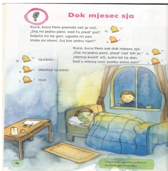
Slika 4. Dok mjesec sja