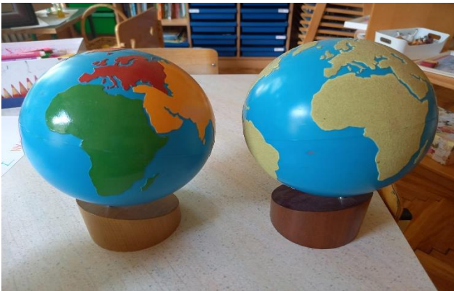
Slika 11 Globus mora i kontinenata u boji (lijevo) Globus mora i kopna hrapavi (desno) (fotografirano u „DV Sopot“)

Maria Montessori je osmislila poseban materijal za kozmički odgoj djece koji su kasnije nadogradili Montessori pedagozi. Taj poseban didaktički materijal uključuje globuse na kojima su zemlje i oceani ispupčeni i mogu se opipati. Znanje iz područja geologije se usvaja putem specijalnog pribora za geologiju. Tako strukturirani materijali omogućuju djeci zorno učenje u kojem istražuju i otkrivaju svijet i svemir (Seitz i Hallwachs, 1996).