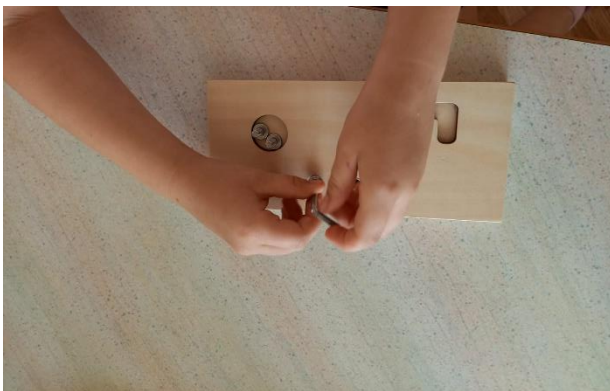
Slika 3 Odvrtnje i zavrtanje vijka (fotografirano u „DV Sopot“)

Pribor koji se koristi u vježbama za praktični život mora biti prilagođen uzrastu djece, npr. u radu će se koristiti maleni predmeti poput male metle, malog čajnika/zdjele/kante i slično. Tu spadaju i posebni okviri koji se koriste za vezanje vezica i vrpce, prišivanje dugmadi, spajanje kukica, lijepljenje čička, rad s iglama i kopčama. Vježbe za praktični život uključuju tri područja: i) brigu za samog sebe (pranje zubi i ruku, obuvanje, oblačenje i skidanje, čišćenje cipela itd.); ii) brigu za okolinu (pranje rublja i suđa, metenje prostorije, brisanje prašine, čišćenje, pranje prozora, briga za biljke i životinje, rad u vrtu itd.); iii) vježbe vezane sa životom u zajednici (pozdravljanje, postavljanje stola, ulijevanje pića, odvrtnje i zavrtanje vijka i sl.) (Seitz i Hallwachs, 1996).