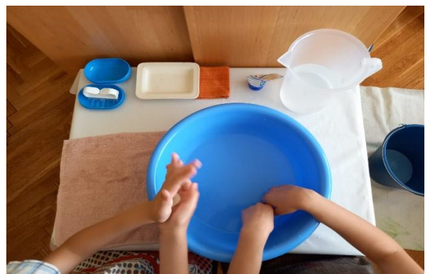
Slika 4 Pranje ruku (fotografirano u „DV Sopot“)