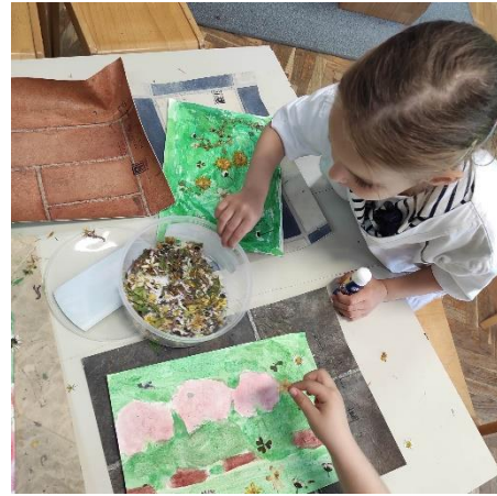
Slika 26. Inspiracija Klimtovim pejzažima