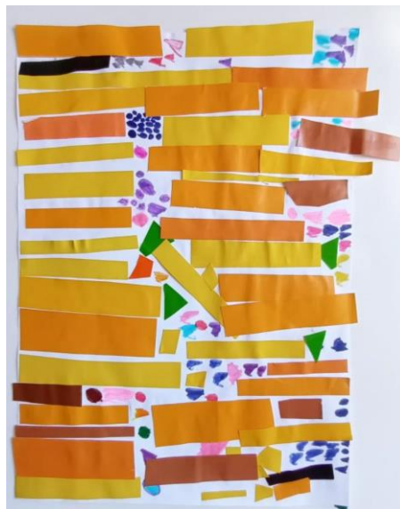
Slika 17. Djevojčica (5)