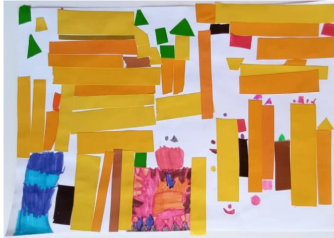
Slika 18. Djevojčica (5)