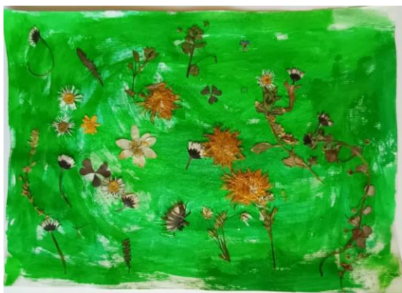
Slika 23. Djevojčica (5,5)