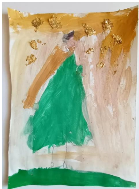
Slika 4. Djevojčica (4,5)