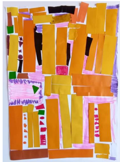
Slika 15. Djevojčica (5)