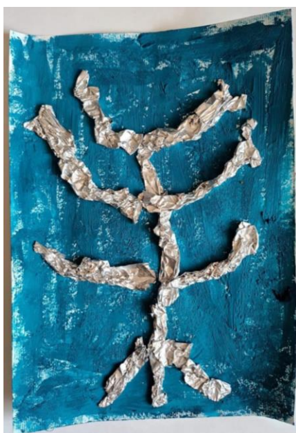
Slika 11. Dječak (5)