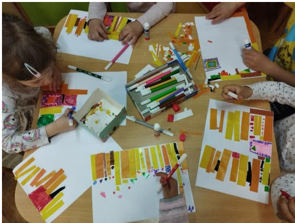
Slika 27. Inspiracija Stocletovim frizom