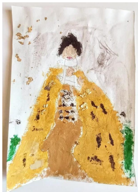
Slika 6. Djevojčica (5,5)