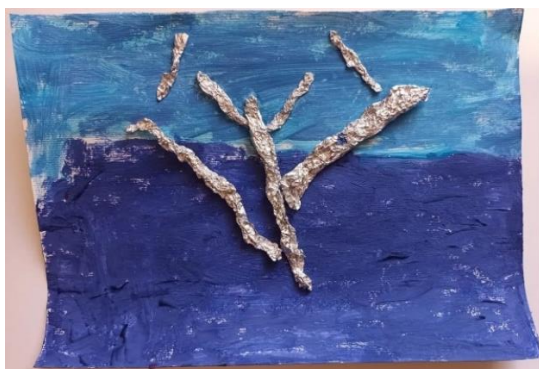
Slika 9. Dječak (4)

Dječji radovi inspirirani djelom Drvo života Gustava Klimta: