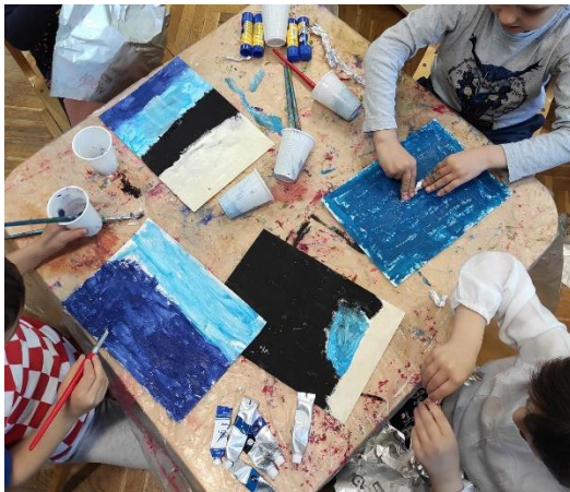
Slika 25. Inspiracija „Drvom Života“