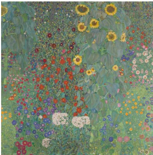
Slika 19. Seoski vrt sa suncokretima, Gustav Klimt

Zadnju likovnu aktivnost provela sam s manjom skupinom djece koristeći kao poticaj Klimtove pejzaže. Kao izvor motiva pripremila sam im reprodukcije slika Seoski vrt sa suncokretima i Seoski vrt (Cvjetnjak), a za likovnu tehniku koju smo koristili predvidjela sam kombinaciju akvarela, uporabom vodenih boja, te kolaža, lijepljenjem suhog, sprešanog cvijeća. Postavila sam prikaze Klimtovih slika na djeci vidljivo mjesto i pokrenula razgovor u kako bih djecu motivirala za aktivno sudjelovanje.