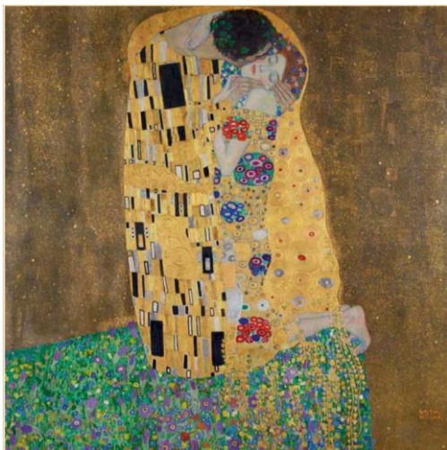
Slika 1. Poljubac, Gustav Klimt

Prvu likovnu aktivnost inspiriranu „zlatnim razdobljem“ Gustava Klimta provela sam s djecom koristeći kombiniranu tehniku tempere i lijepljenja komadića zlatne folije. Postavljam reprodukcije slika Poljubac i Portret Adele Bloch-Bauer pred djecom postavljajući ih na vidljivo mjesto i postavljam pitanja vezana za njih.