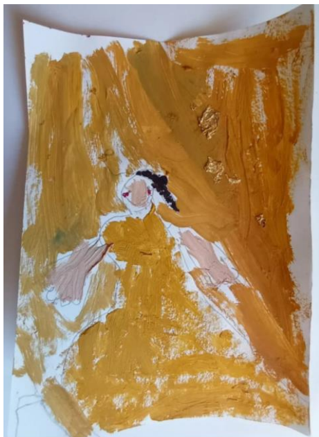
Slika 3. Dječak (4,5)

Dječji radovi inspirirani djelima Gustava Klimta Poljubac i Portret Adele Bloch-Bauer :