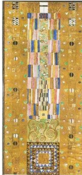
Slika 13. Stocletov friz, Gustav Klimt

i postavila ju na mjesto vidljivo svoj djeci uključenoj u proces, te potaknula razgovor i razmišljanje o djelu pitanjima.