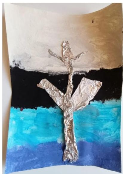
Slika 10. Djevojčica (5)