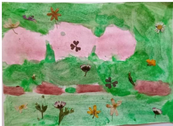
Slika 24. Djevojčica (5)