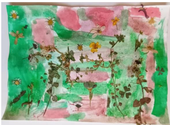
Slika 21. Djevojčica (5,5)

Dječji radovi inspirirani slikama Seoski vrt sa suncokretima i Seoski vrt (Cvjetnjak) Gustava Klimta: