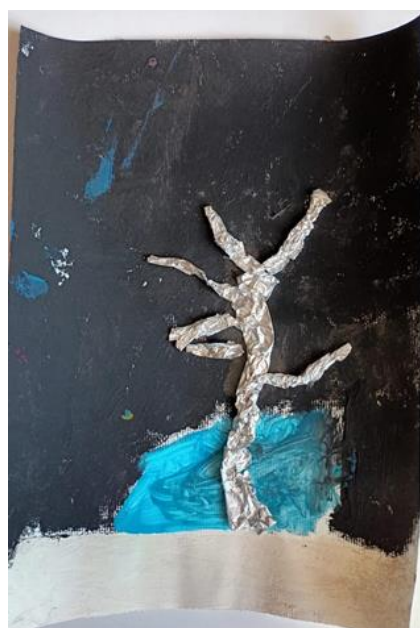
Slika 12. Djevojčica (4,5)