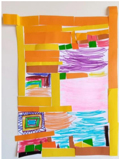
Slika 14. Dječak (4,5)

Dječji radovi inspirirani djelom Stocletov friz Gustava Klimta: