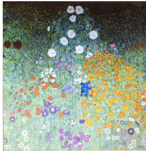
Slika 20. Seoski vrt (cvjetnjak), Gustav Klimt