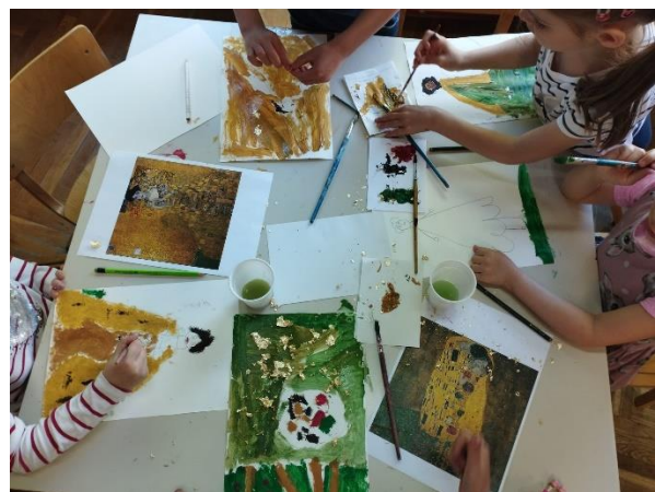
Slika 28. Inspiracija Klimtovim "zlatnim razdobljem"