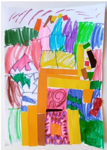
Slika 16. Djevojčica (5,5)