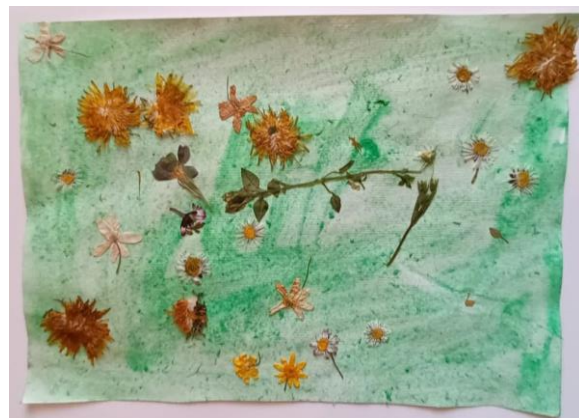
Slika 22. Dječak (4,5)