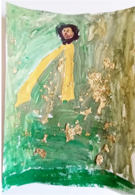
Slika 7. Djevojčica (4)