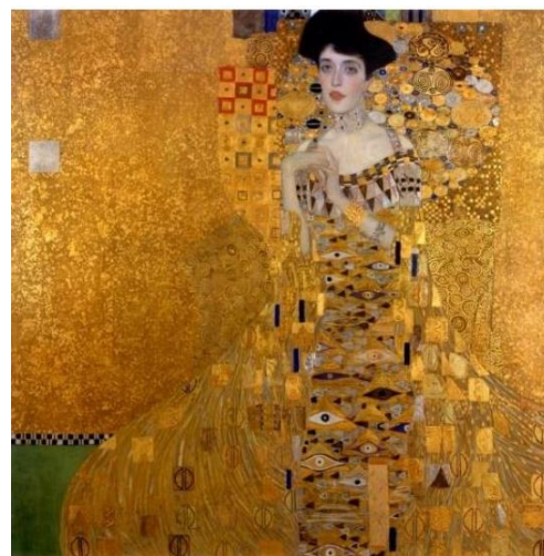
Slika 2. Portret Adele Bloch-Bauer, Gustav Klimt