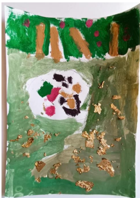
Slika 5. Djevojčica (4)