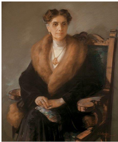
Slika 1 1 . Portret Ivane Brlić-Mažuranić

Ivana Brlić-Mažuranić hrvatska je književnica rođena 1874. godine u Ogulinu, kao unuka bana Ivana Mažuranića, a 64 godine kasnije umire u Zagrebu. U Zagrebu je živjela do svoje 4. godine, a nakon udaje za Vatroslava Brlića, tadašnjeg političara, seli se u Slavonski Brod u dobi od 18 godina. S obzirom da je bila ugledna spisateljica, čak su je četiri puta predlagali za Nobelovu nagradu za književnost, a proglašena je i hrvatskim Andersenom (prema Hrvatska enciklopedija, 2022b; Zalar, 2022).