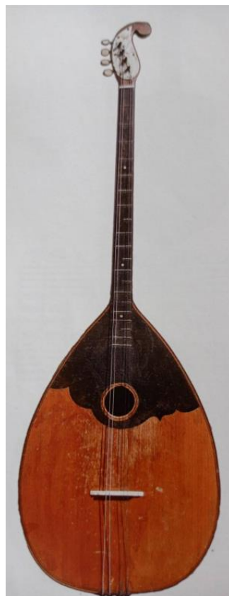
Slika 5. Čelović i bisernica III. (Ferić, 2011, str. 50)