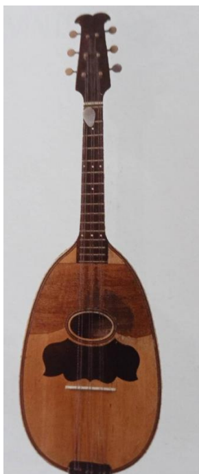
Slika 9. Bisernica III. in F (Ferić, 2011, str. 68)