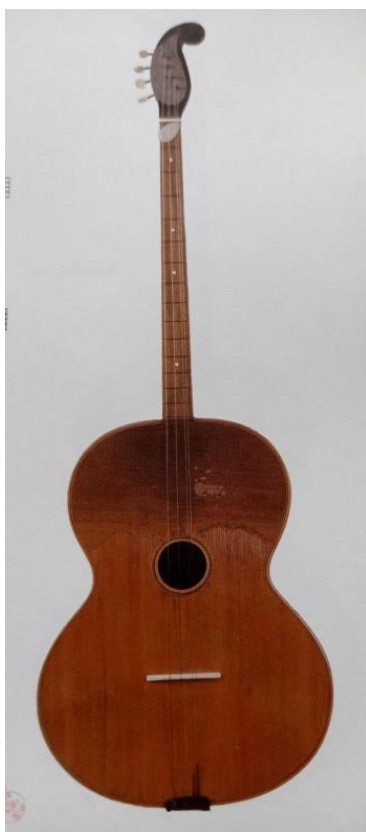
Slika 4. Bugarija II. (Ferić, 2011, str. 55)