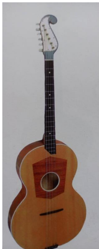
Slika 15. D-brač (Ferić, 2011, str. 83)