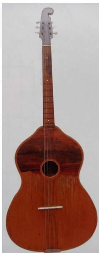
Slika 17. G-bugarija (Ferić, 2011, str. 87)