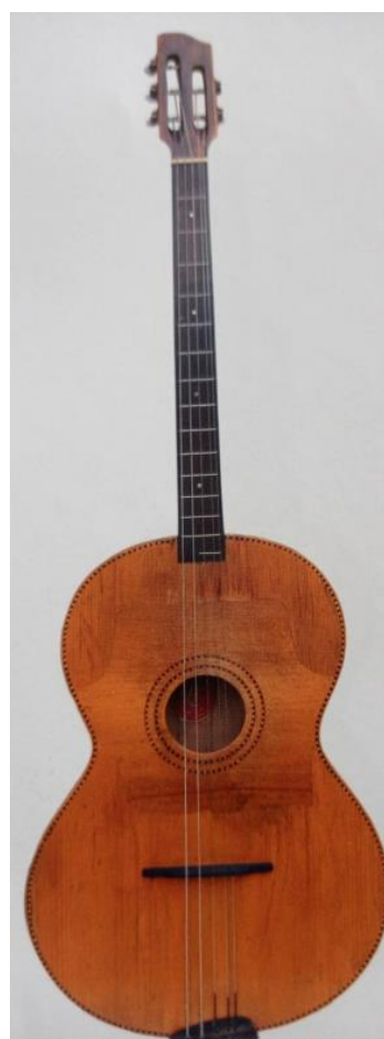
Slika 21. E-brač (Ferić, 2011, str. 108)