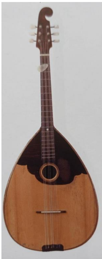
Slika 11. Brač I.,II. i III. (Ferić, 2011, str. 69)