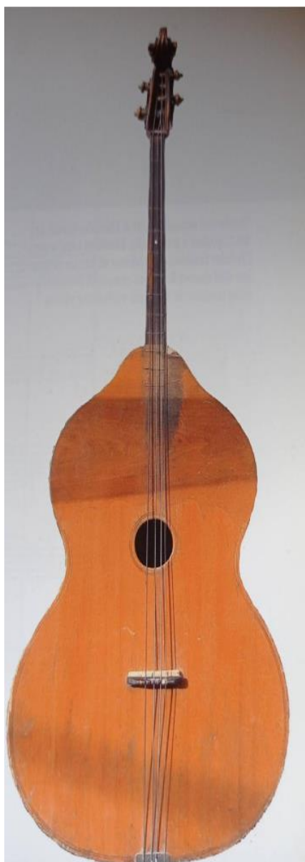
Slika 12. Berde (Ferić, 2011, str. 73)