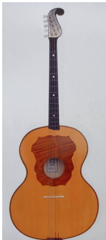
Slika 23. E-bugarija (Ferić, 2011, str. 110)