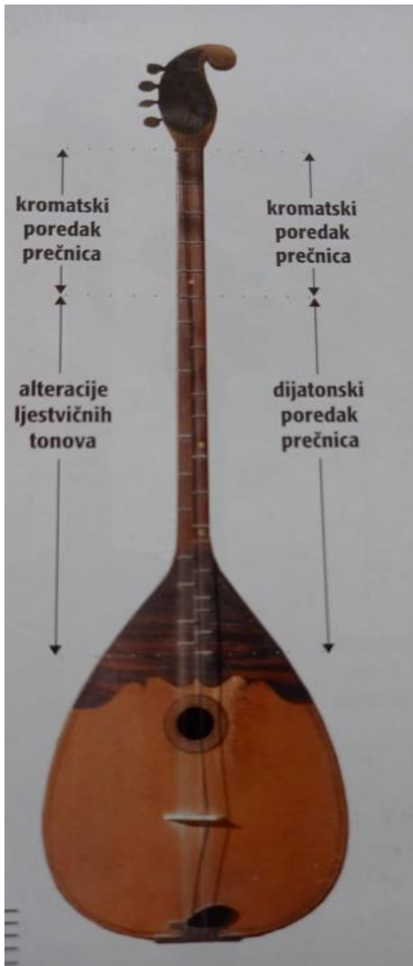
Slika 1. Brač I. (Ferić, 2011, str. 47)