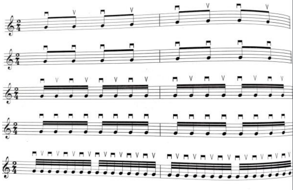
Primjer vježbanja tehnike trzanja, Ferić, 1996

Kada se usvoji tehnika, uče se note. Pjesme se također uče određenim redom, tako da učenici obuhvate note koje su do nekog razdoblja usvojili. Tehničke vježbe koje Leopold (1995) predlaže tijekom cijelog procesa, a koje utječu na kvalitetu sviranja su: