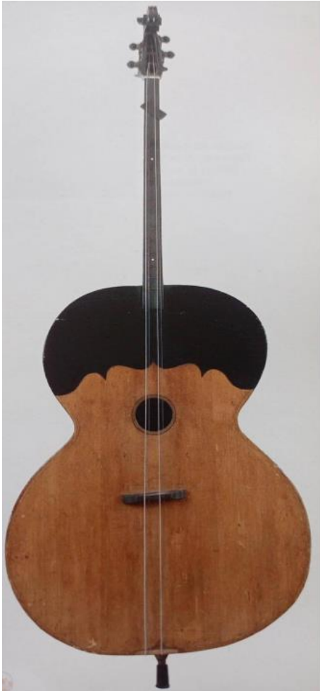
Slika 6. Berde (Ferić, 2011, str. 61)