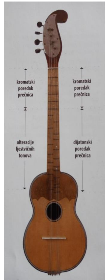
Slika 3. Bisernica I. i II. (Ferić, 2011, str. 49)