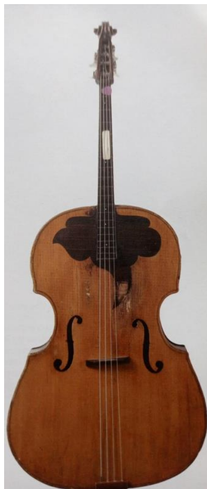
Slika 18. Berde (Ferić, 2011, str. 93)