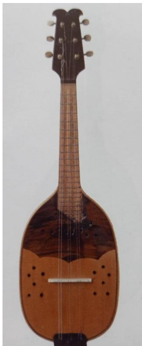
Slika 8. Troglasna bisernica I. i II. (Ferić, 2011, str. 67)