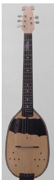
Slika 19. E-bisernica (Ferić, 2011, str. 106)