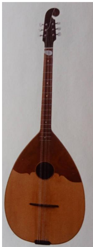
Slika 10. Troglasni čelović in F (Ferić, 2011, str. 70)