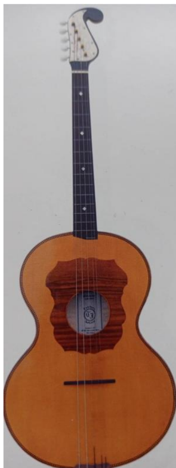
Slika 20. A-brač (Ferić, 2011, str. 107)