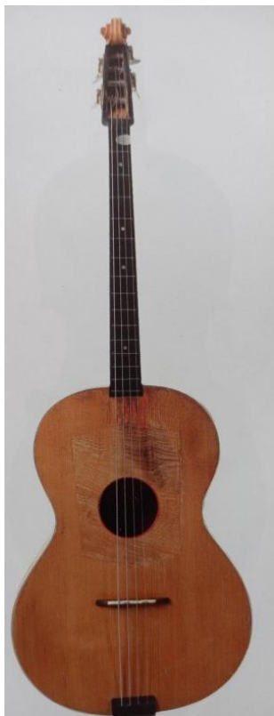
Slika 16. Tamburaško čelo (Ferić, 2011, str. 85)