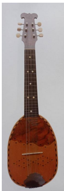
Slika 13. G-bisernica (Ferić, 2011, str. 79)