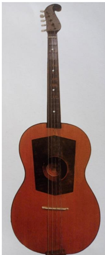
Slika 14. G-brač (Ferić, 2011, str. 82)