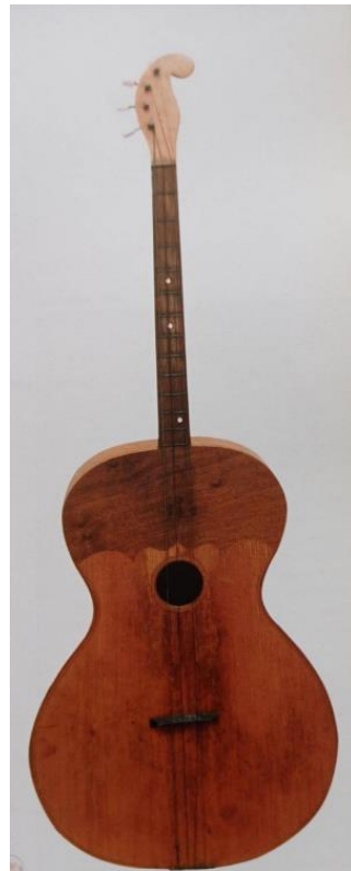
Slika 7. Bugarija I. zvana farkaševska (Ferić, 2011, str. 52)