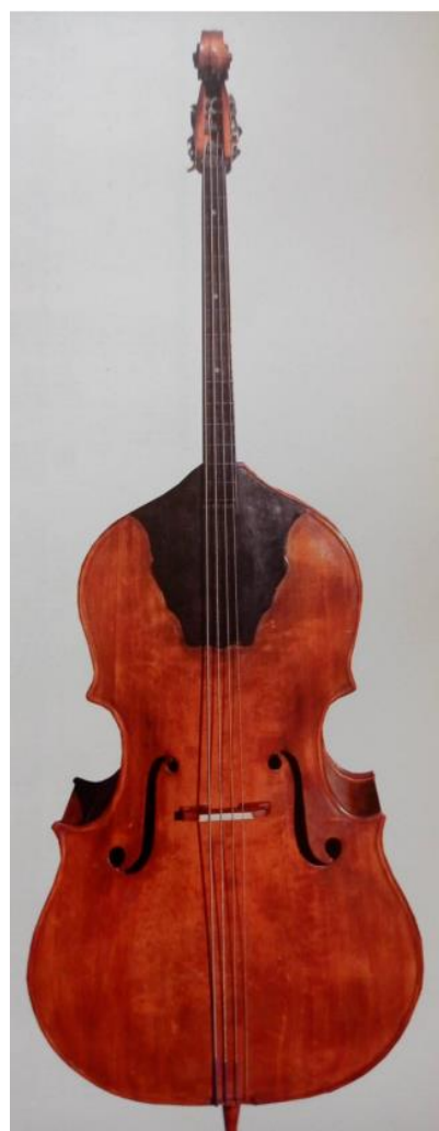
Slika 24. Berde (Ferić, 2011, str. 113)