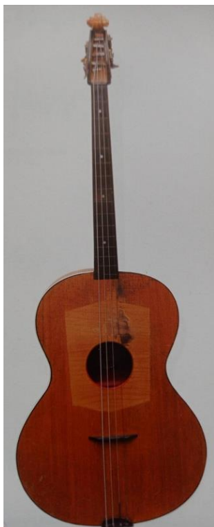
Slika 22. Čelo (Ferić, 2011, str. 109)