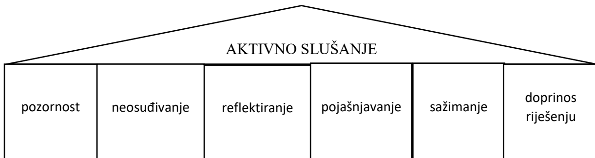
Slika 7. Vještine aktivnog slušanja