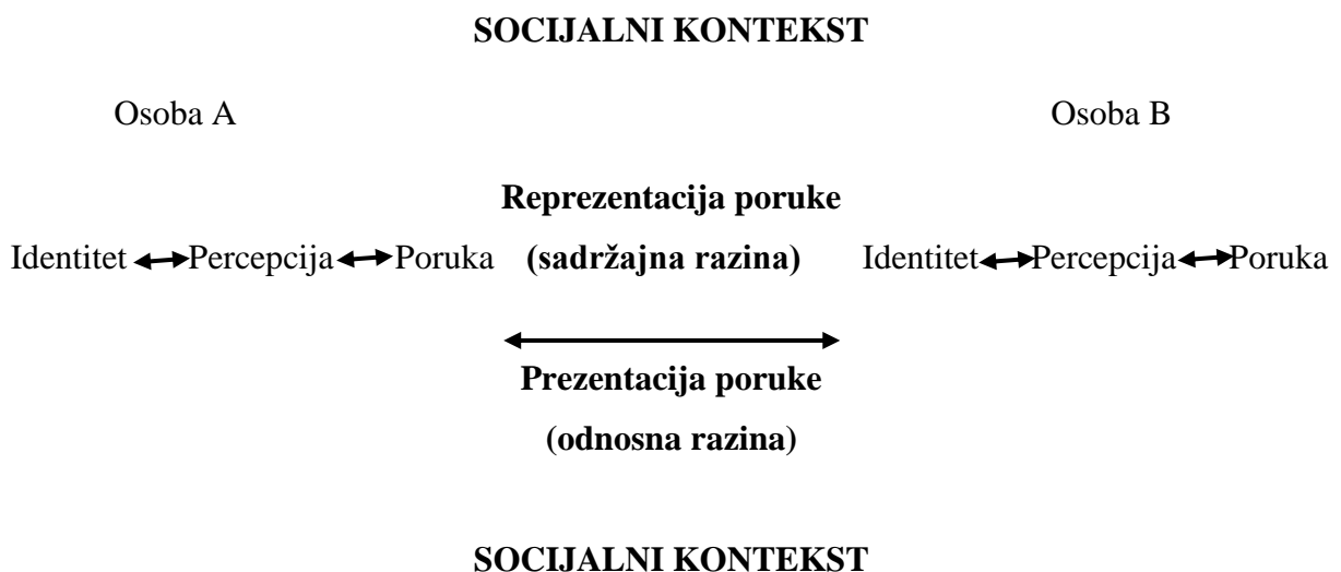
Slika 5: Hartley-ev model interpersonalne komunikacije