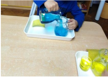
Slika 12. Preljevanje vode iz vrča u vrč