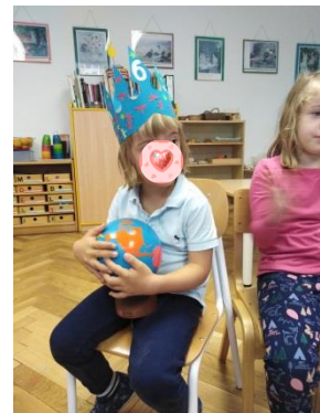
Slika 18. Proslava rođendana na Montessori način