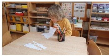
Slika 11. Rezanje škalicama po ravnoj liniji