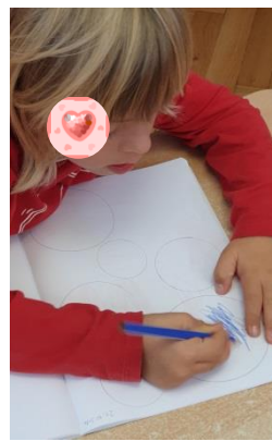
Slika 15. Metalni umetci