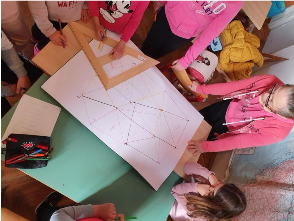
Slika 2. Učenici igraju igru koju je osmislila učiteljica kombiniranog razrednog odjela