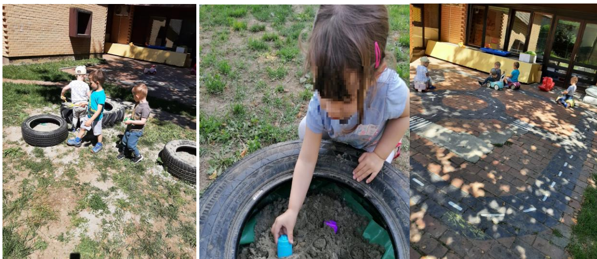
Slika 20. Prostor za igru pijeskom i vožnju

Također sugeriraju i prostor s malim vrtom u kojem će djeca saditi i promatrati rast biljaka tijekom dužeg perioda. U skupini Cipelići djeca sade biljke koje su smještene na pokretnom stalku kako bi se cjelokupan prostor mogao reorganizirati prema potrebama i