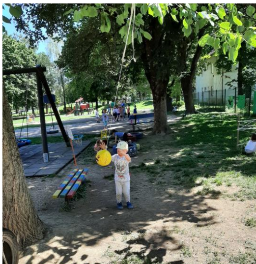
Slika 19. Igra fiksiranom loptom

Neki od poželjnih centara, koje navode Hansen i suradnici (2001), svakako je prostor za igru pijeskom kojeg su odgojitelji osmislili u suradnji s roditeljima koji su doprinijeli nabavom gume i pijeska te prostor za vožnju (Slika 20).