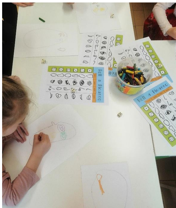
Slika 3. Izražavanje pastelama

Kiparska tehnika oblikovanja glinamola jako je dobro prihvaćana u skupini. Djeca su oblikovala navedeni materijal u obliku tanjurića, a zatim su na njima iscrtali lica uz pomoć čačkalica (Slika 4). Djeca su nastojala pažljivo oblikovati glinamol (uleknuti reljef) stvarajući odgovarajući volumen i dizajn predmeta koji kasnije mogu upotrebljavati na različite načine.