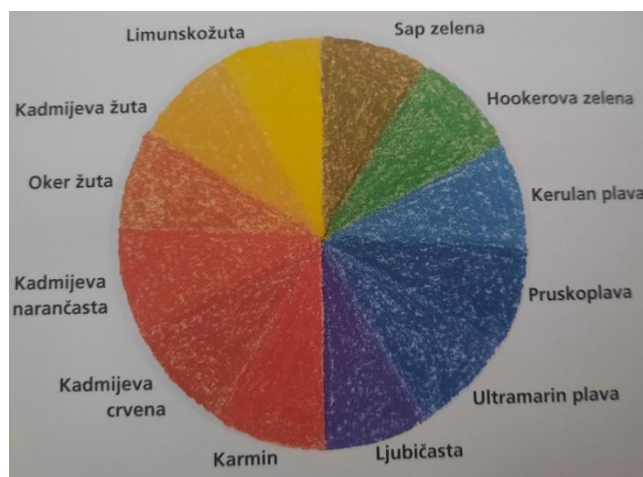
Slika 7. Pigmenti boja, Newton, 2013.