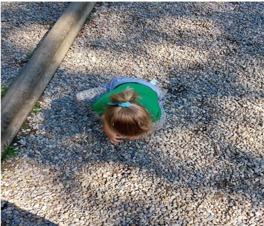
Slika 11: Biranje kamenja za haljinu

Čim smo izašli van djevojčice su krenule u potragu za materijalima iz prirode kako bi izradile šumsku vilu. Koristile su kamenčiće za haljinu, grančice za rubove tijela, lišće za kosu i detalje lica i češere za cipele.