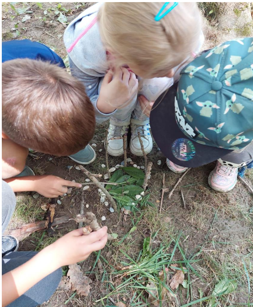
Slika 9: stavljanje gliste u njezinu kuću