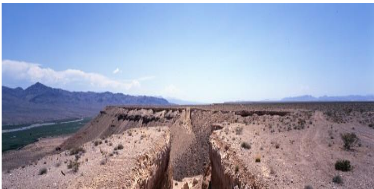
Slika 1: Djelo Double Negative umjetnika Michaela Heizera ( Double Negative • MOCA )