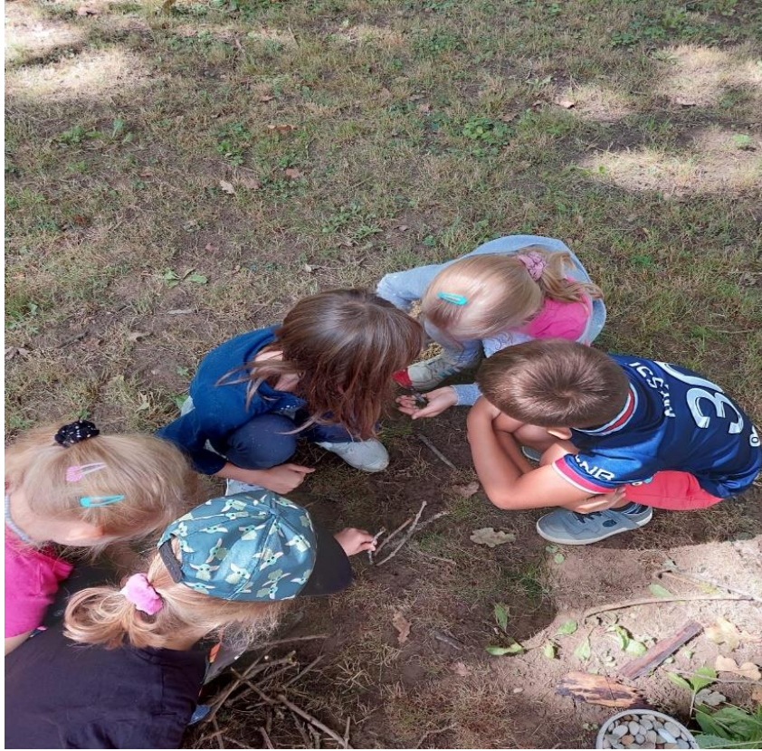
Slika 6: Početak izgradnje kuće za gliste