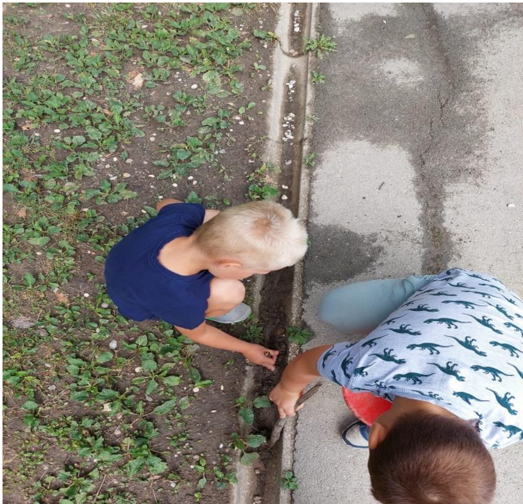
Slika 4: Potraga za glistama

U nastavku su fotografije cijelog procesa dječjeg likovnog stvaralaštva u prirodi.