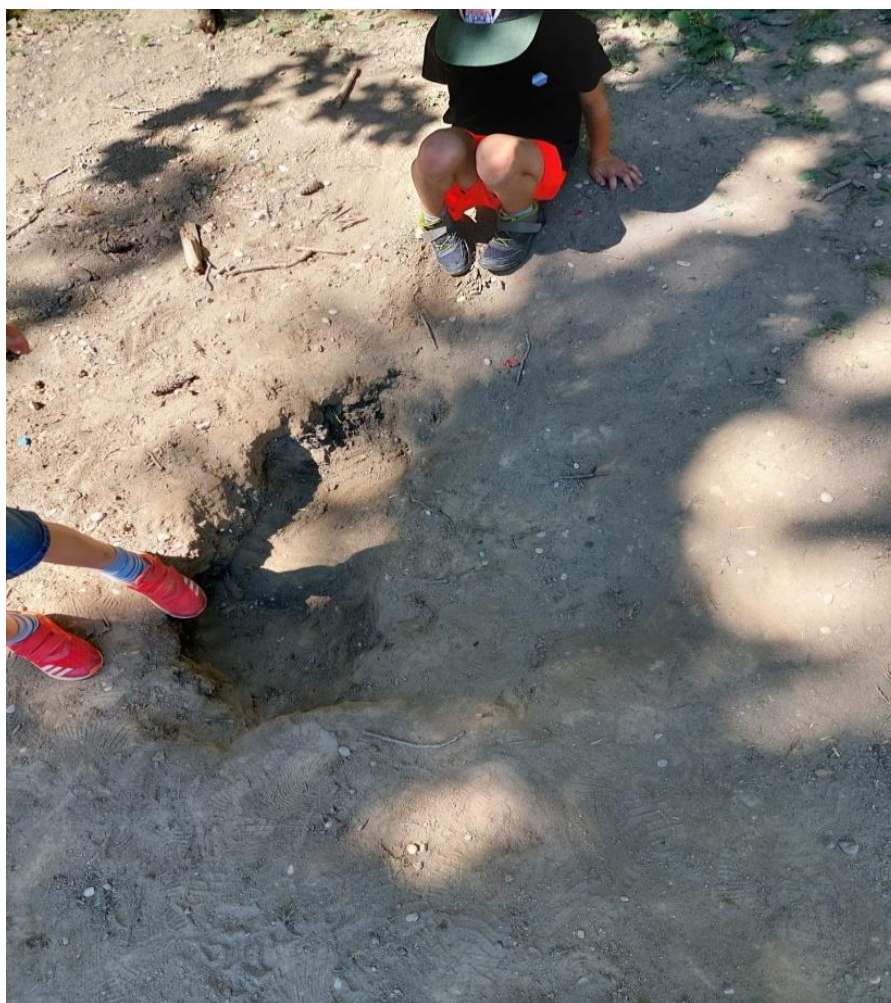
Slika 20: Zemljano čudovište

Za vrijeme izrade zemljanog čudovišta djeca su usputno pričala o svojim strahovima, najčešće su to bila čudovišta, mrak i nepoznati ljudi. Pričali smo o tome kako se suprotstaviti tome strahu. Djeca su pokazivala empatiju za tuđe strahove i pokušali su ih umiriti lijepim riječima. Nakon tri dana izrade svog čudovišta, smislili smo slatku i smiješnu priču o velikom čudovištu koje voli djecu.