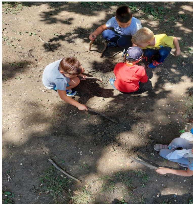
Slika 17: Potražnja za debelim granama za lakše kopanje