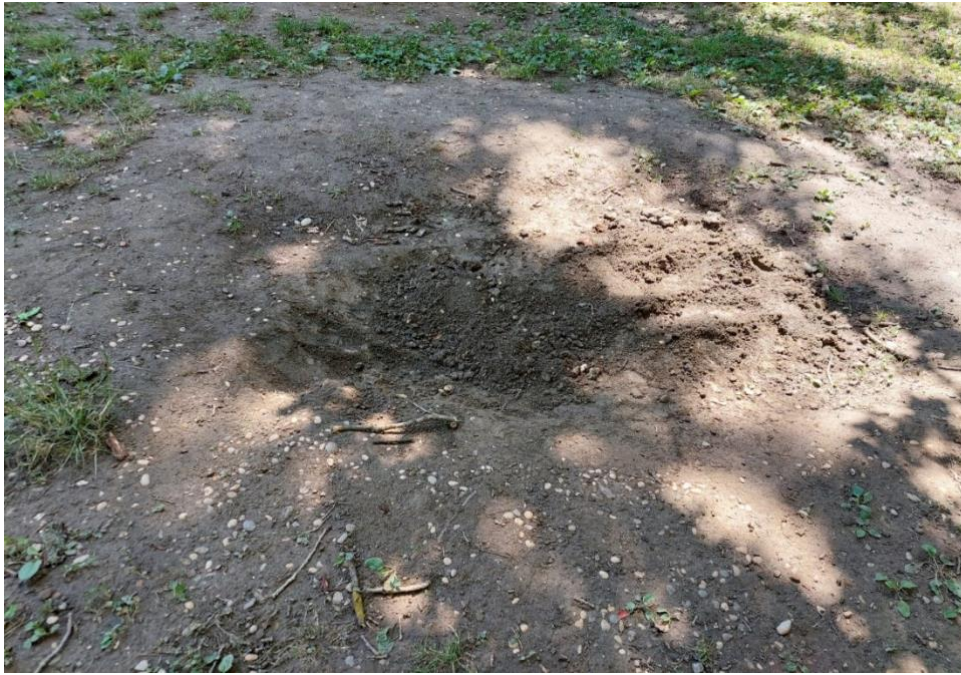
Slika 16: Velika mračna glava čudovišta