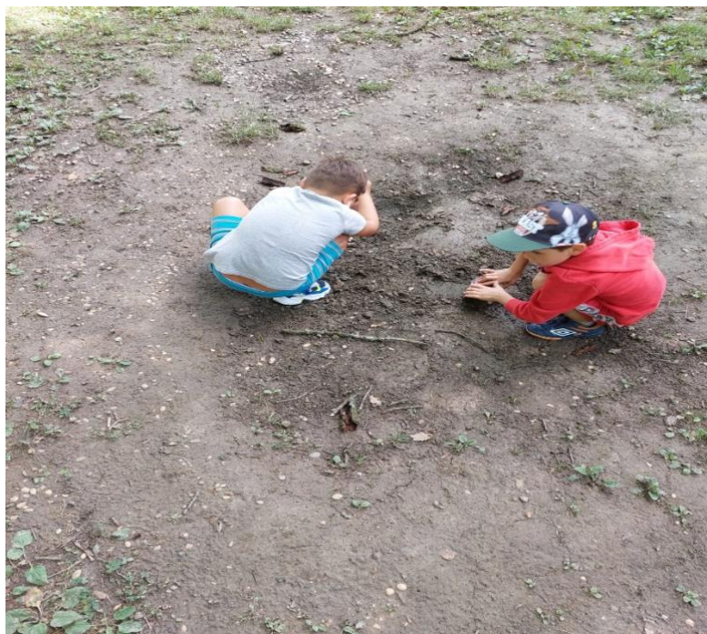
Slika 15: Izrada čudovišta kopanjem rukama

Nakon razgovora krenula je izrada. Neki su kopali lopaticama i grabilicama, a drugi su se pak poslužili grančicama i rukama. Većinom su u aktivnosti sudjelovali dječaci. Aktivnost je trajala par dana i sami su primijetili kako se oblik rupe promijenio zbog vjetra i kiše.