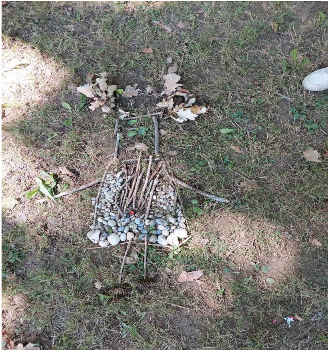
Slika 14: Šumska vila

Kroz izradu šumske vile do izražaja je došla dječja mašta ali i njihovo zapažanje i uspoređivanje sa stvarnim svijetom. Prirodnim materijalima koje su prikupili su izradili šumsku vilu, koju su kasnije i crtali i izmišljali priče o njoj. Na početku su sudjelovale samo djevojčice, ali se razbila stigma da tako nešto nije za dječake, jer kada su vidjeli kako djevojčice s užitkom skupljaju materijale, prišli su i pomogli s ostvarenjem šumske vile, dodavanjem pijeska na „ruke“ („vilinskog praha“) kako bi čarolija bila potpuna. Prije odlaska na spavanje tražili su priču o njihovoj šumskoj vili, u kojoj su i sami dodavali svoje rečenice.