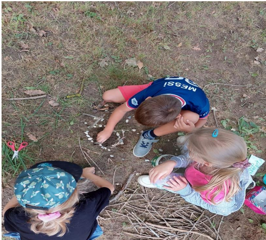
Slika 7: Izrada ograde od kamenja oko glistine kuće