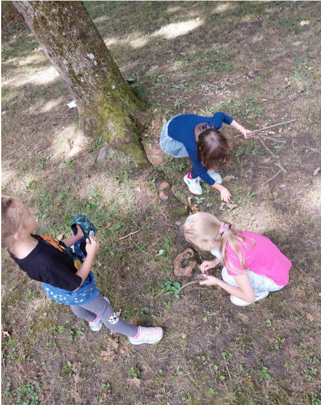
Slika 5: Potraga za grančicama i lišćem