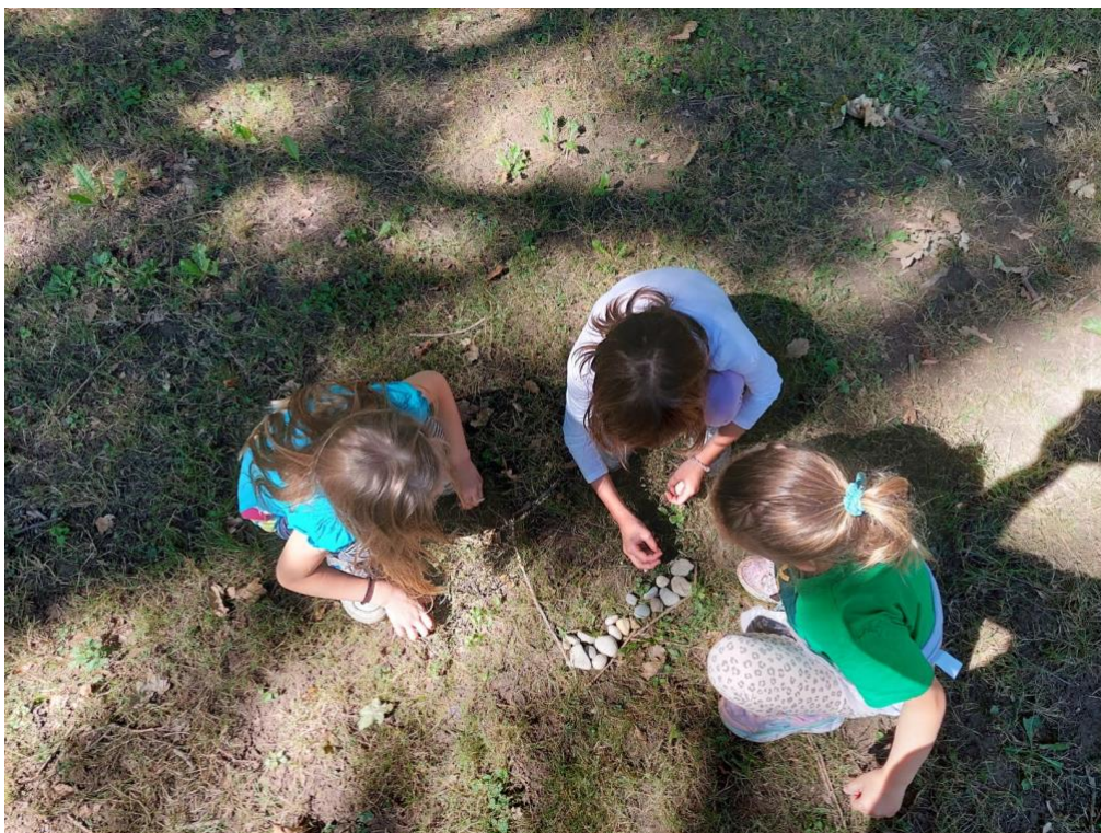
Slika 12: Početni oblik haljine