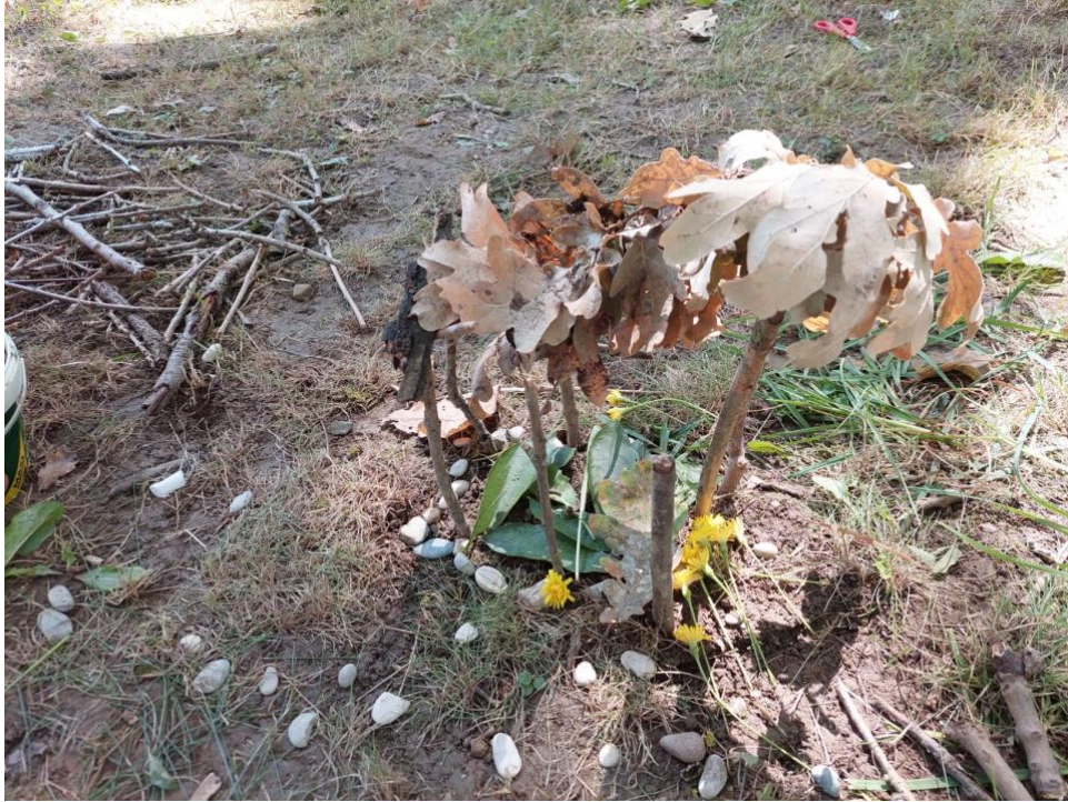
Slika 10: Gotova glistina kuća

Kroz provođenje aktivnosti izrađivanja kućice za gliste, primijetila sam zajedništvo među djecom. Pomaganje u rješavanju problema između djece je bilo često, naprimjer kada je dječak prišao i pomogao djevojčici slomiti grančicu kako bi je mogla zabiti u zemlju ili kada je djevojčici bilo teško nositi lišće jer joj je ispadalo iz ruke, druga djevojčica je odmah priskočila u pomoć. Ideje su smišljali zajednički i kroz proces stvaranja su nove ideje dolazile. Zanimljivo je bilo gledati kako jedna aktivnost može zaokupiti dječju pažnju i interes kroz tri sata boravka na otvorenom bez uplitanja odgajatelja ili druge odrasle osobe. Svu problematiku, padanje „krova“, hrane za gliste i ostalo, su s lakoćom zajedno riješili.