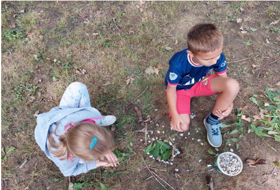
Slika 8: Stavljanje lišća u glistinu kuću da jede