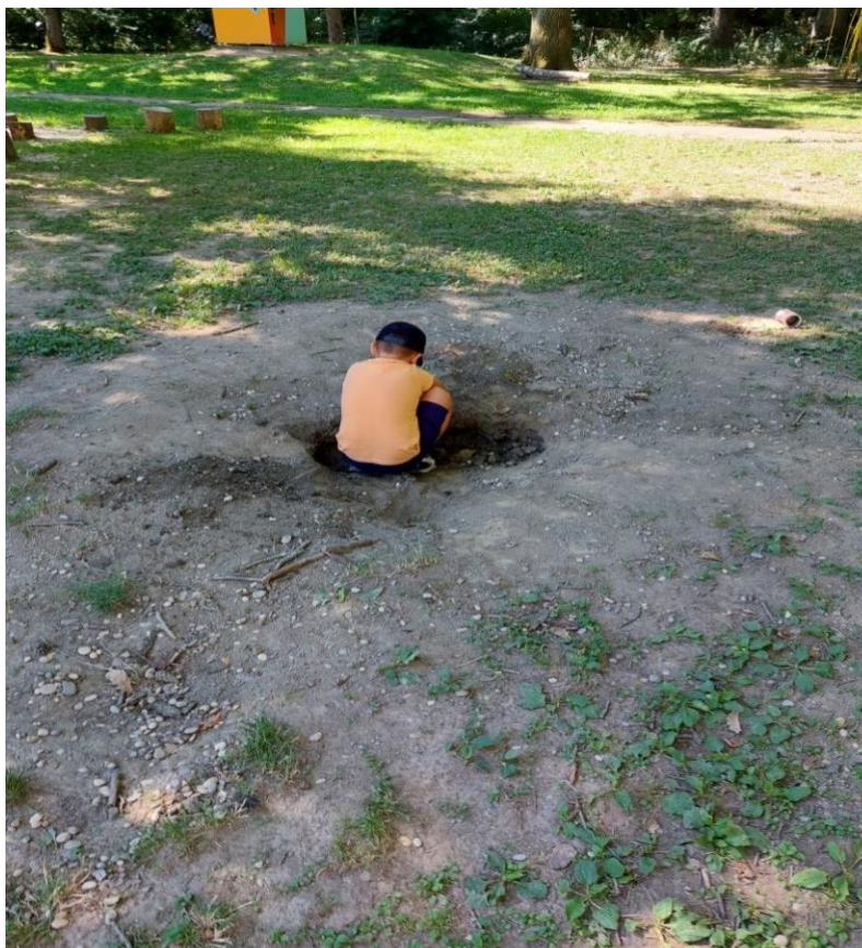
Slika 19: Dječak trećeg dana primjećuje da je rupa dublja zbog kiše, te nastavlja s kopanjem