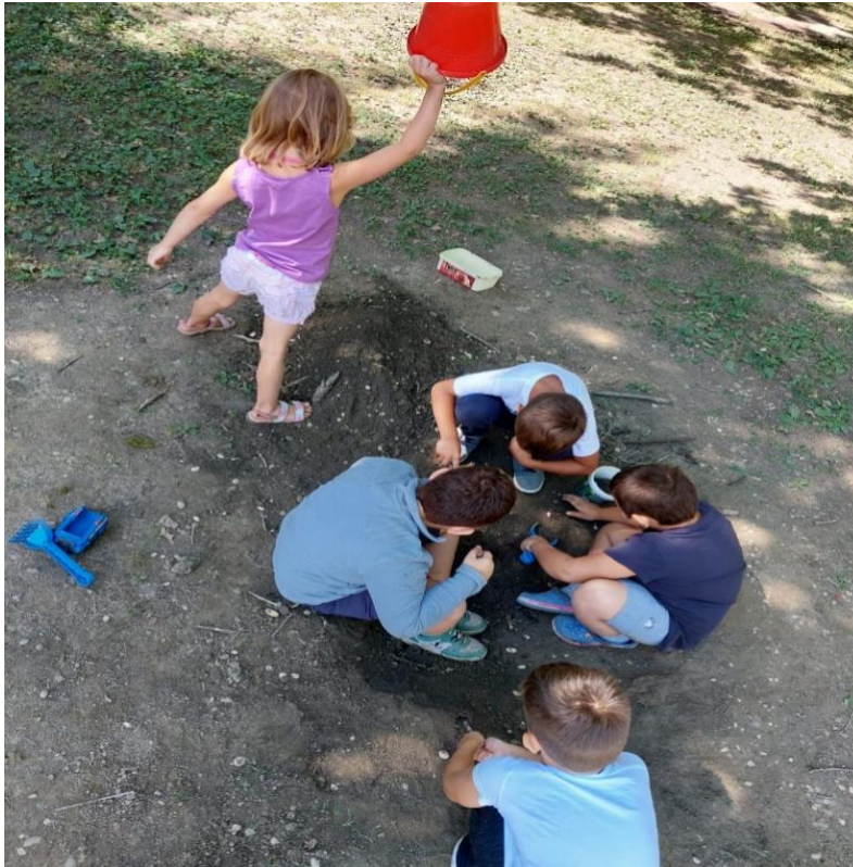
Slika 18: Pridružuje se djevojčica s kanticom koja od viška zemlje izrađuje „kosu“ čudovištu