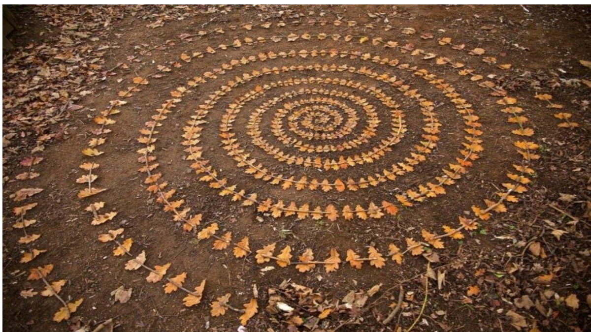
Slika 3: Djelo Mandala od lišća umjetnika Jamesa Brunta ( Artist uses materials found in nature to create elaborate cairns and mandalas (inhabitat.com) )