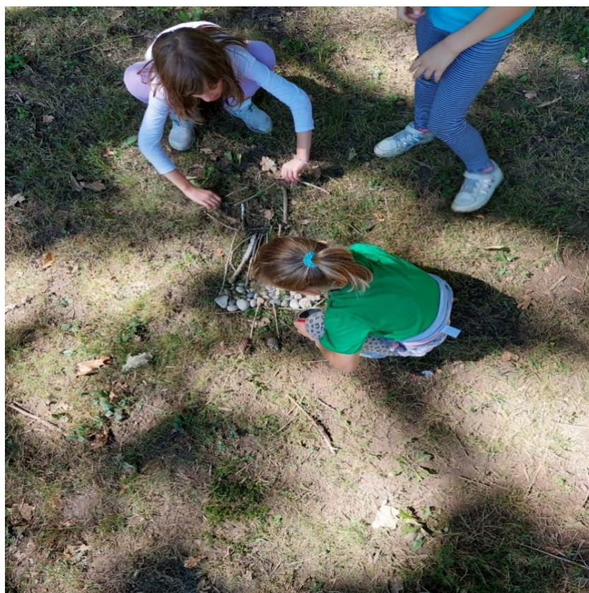
Slika 13: Dodavanje detalja (cipele, oči, kosa)