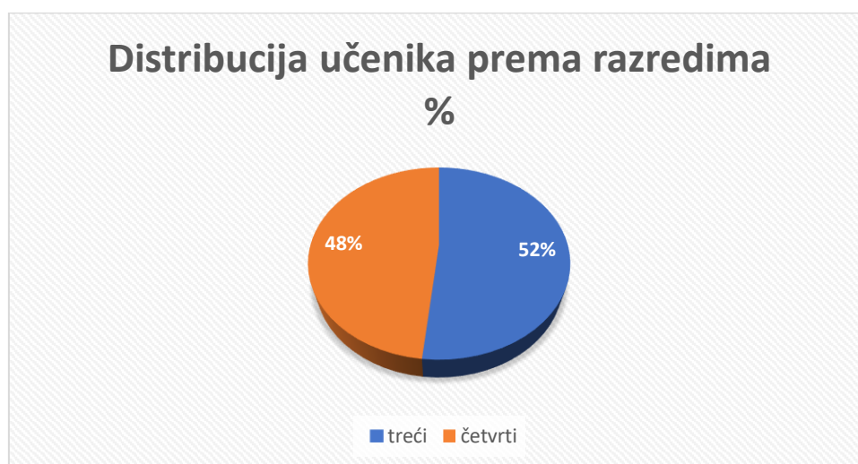
Grafikon 1. Omjer učenika s obzirom na razred koji pohađaju

Iz tablice 2. i grafikona 1. vidljivo je da je u istraživanju sudjelovalo više učenika trećih razreda čak njih 105 (52%), dok je učenika četvrtih razreda ukupno sudjelovalo 98 (48%).