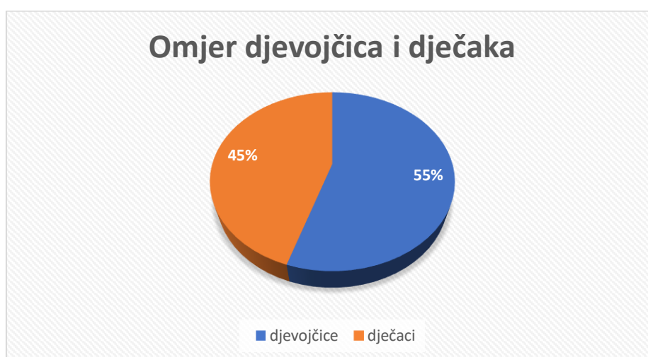
Grafikon 2. Distribucija učenika s obzirom na spol

Iz tablice 3. i grafikona 2. vidi se da je u istraživanju sudjelovalo više djevojčica (55%), nego dječaka (45%).