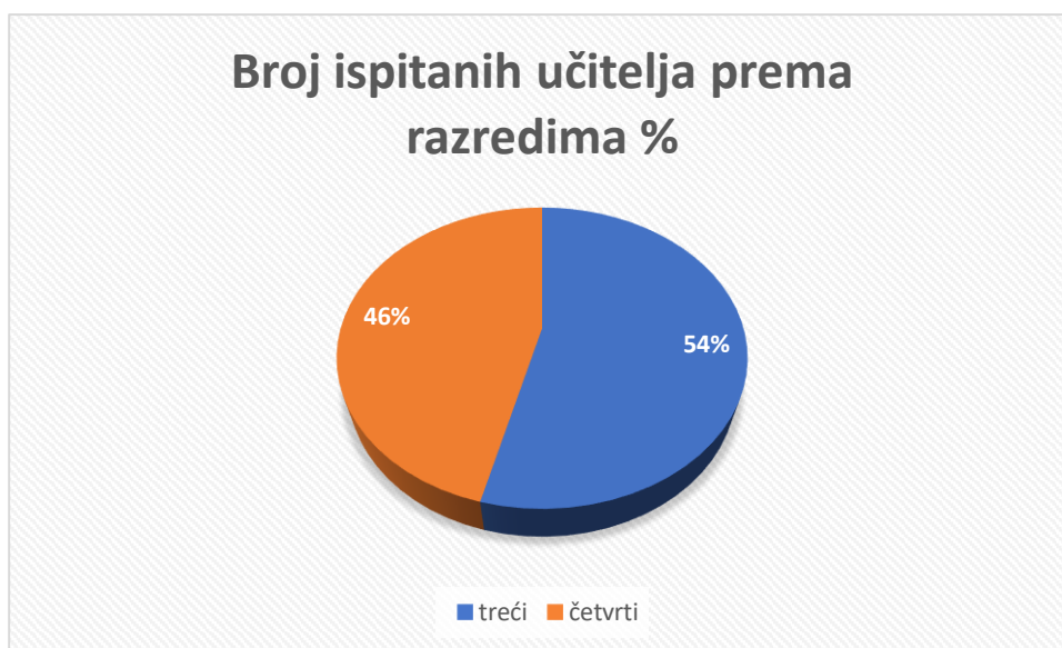
Grafikon 4. Omjer učiteljica/učitelja prema razredima

Iz tablice 5. i grafikona 4. vidljivo je da je u istraživanju sudjelovalo ukupno 7 učiteljica/učitelja (54%) trećih razreda i 6 učiteljica/učitelja (46%) četvrtih razreda osnovne škole.