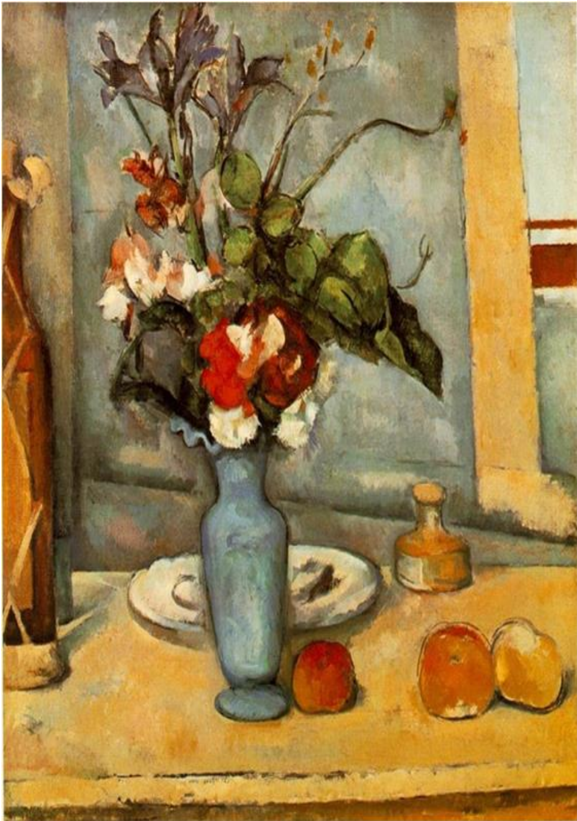
Paul Cézanne, Plava vaza, 1885-1887., Louvre, Pariz