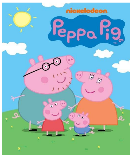
Slika 6. „Peppa pig“

Prva prezentacija „Peppa Pig“ animiranog filma nije prošla najbolje i nitko od ljudi na televiziji nije cijenio šarm male pričljive svinje. Kako su Astley, Baker i Davis uložili sve što su imali u razvoj crtanog filma i zadužili se, bili su spremni odustati od projekta. Međutim, britanski kanali Channel 5, a odmah za njim i Nickelodeon, pokazali su veliki interes za ovaj crtani film.