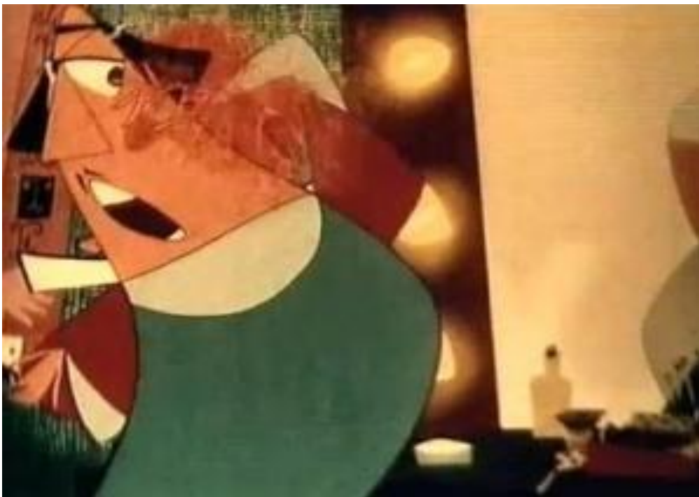
Slika 2. Prizor iz filma „Premijera“ (1957)

Nikola Kostelac 1957. godine izrađuje film „Premijera“ koji je najizrazitiji primjer koncepta zagrebačkih animatora koji odstupaju od Disneyjeva klasična stila (Škrabalo, 2008).