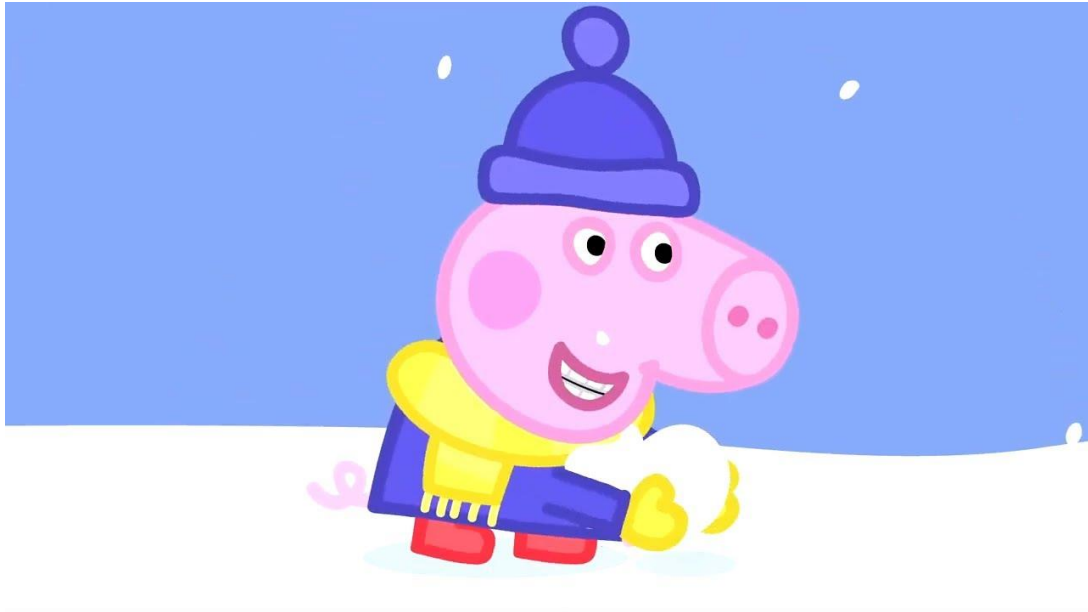
Slika 11. Prizor iz animiranog filma „Peppa Pig – Snijeg“

Nakon razgovora o zimi prikazala bih im animirani film „Snijeg“.