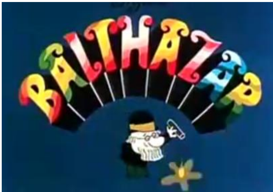
Slika 3. Uvodna animacija „Profesora Baltazara“ (1968)

vremenu, s više različitih žanrova, radio i Boris Kolar, a njegova najpoznatija djela su „Dječak i lopta“ (1960), „Neman i vi“ (1964) i „Utopia“ (1973). Treba istaknuti kako je Kolar dao veliki doprinos seriji „Inspektor Maska“, koja je objavljivana od 1962. do 1963. godine, i prvom nizu serije filmova „Profesor Baltazar“, koja je snimana od 1967. do 1978. godine u Zagreb filmu. Otac lika profesora Baltazara je Zlatko Grgić, a samu seriju čini 59 epizoda u trajanju od pet do deset minuta. Za „Profesora Baltazara“ kažu kako je i do danas ostao najuspješniji projekt Zagrebačke škole crtanog filma (Škrabalo, 2008).