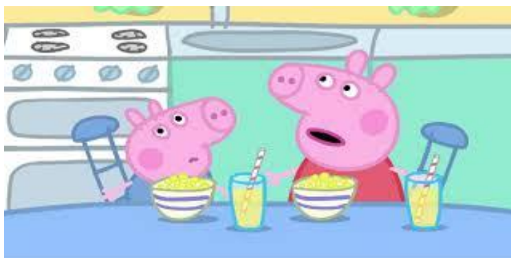
Slika 12. Prizor iz animiranog filma „Peppa Pig – Tatin rođendan“

Nakon razgovora o rođendanima prikazala bih im animirani film „Tatin rođendan“.