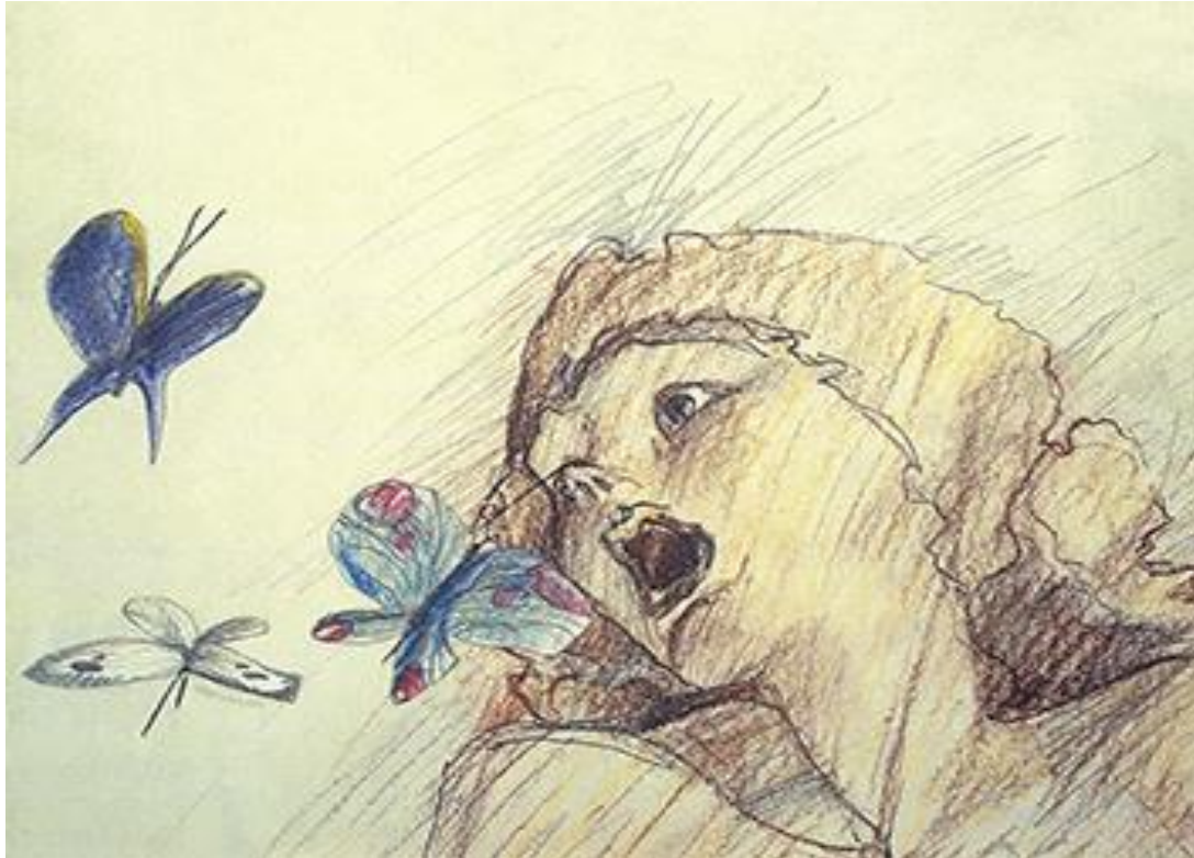
Slika 4. Prizor iz filma „Satiemania“ (1978)

Smatra se kako ta dva vrhunska filma obilježavaju početak i kraj zlatnog razdoblja Zagrebačke škole crtanog filma, a veliki animatori poput Chucka Jonesa, kao i mnogi drugi filmski povjesničari, ističu kako je Zagreb film upravo tada dosegnuo vrhunac kada je u pitanju klasična animacija (Midhat, 2004).