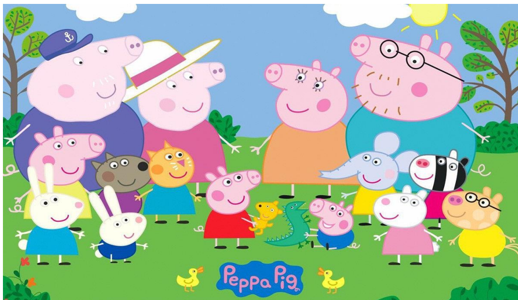
Slika 8. Likovi „Peppa Pig“ serijala

Od ostalih obiteljskih prijatelja najčešće se pojavljuju Koza Gabriella, Vučica Wendy, Gospođa Gazelle, Klokan Joey, Ovca Suzy, Zečica Rebecca, Robbie i Rosie, Gospodin Zebra, Zuzu i Zaza, Slon Emily, Slon Edmond, Mama Slon, Tata Slon, Lavić Leo i Gospodin Nosorog. 6