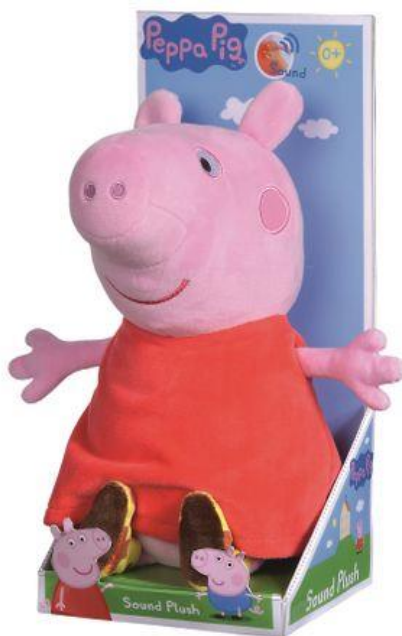
Slika 7. Plišana igračka Peppa Pig

„Peppa Pig“ danas je, nakon osamnaest godina emitiranja, jedan od najgledanijih animiranih serijala za djecu na svijetu, preveden je na čak 40 jezika, a prikazuje se u više od 180 zemalja svijeta. Ne samo da djeca obožavaju ovaj crtani film i likove u njemu nego žele i sve što ima veze s njim, stoga ne čudi kako kompanija autora „Peppa Pig“ danas ostvaruje milijarde prometa samo od profita prodaje robe na temu Peppa Pig. Danas djeca žele bojanke, igračke, igrice, plišane igračke, knjige, CD-ove s motivom Peppa Pig, a popularnost Peppa vidljiva je i na razini gradova i država diljem svijeta koji imaju tematske „Peppa Pig“ parkove.