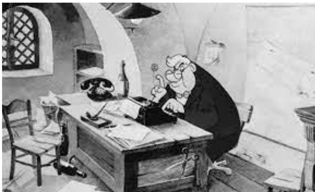
Slika 1. Prizor iz filma „Veliki miting“ (1951)

Nakon Drugog svjetskog rata osniva se Dubrava film koji je nedugo nakon osnutka preimenovan u Jadran film. S Jadran filmom surađivao je Bogoslav Petanjek koji je napravio nastavni film „Naši zubi“ i 1949. godine geg „Crnac Miško“. Walter Neugebauer napravio je prvi poslijeratni crtani film nazvan „Usmene novine“, a nedugo nakon toga i crtani film „Svi na izbore“ (Joško, 2004). Godine 1951. producira se prvi pravi, dvadesetominutni komercijalni crtani film „Veliki miting“ braće Waltera i Norberta Neugebauera. Film „Veliki miting“ prati šefa Pavela Judina koji priprema novinsku patku. Na njegovu je zidu karta svijeta na kojoj je Jugoslavija nazvana čudovišnom zemljom. Šef ubrzo završava u zatvoru gdje piše novu novinsku patku koju je toliko napuhavao da je puknula i uništila njega samoga. Zanimljiva je informacija kako su se braća prilikom izrade filma obratila Waltu Disneyju za savjet, a on ih je samo ohrabrio da nastave dalje (Marušić i sur., 2004).