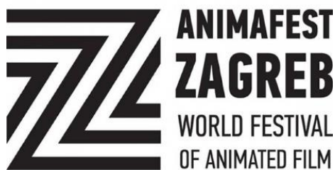
Slika 5. Logotip Animafesta

Animafest Zagreb – Svjetski festival animiranog filma osnovan je još 1972. godine te je drugi najstariji filmski festival u potpunosti posvećen animaciji i jedan od najvažnijih festivala animiranog filma na svijetu. Održava se svake godine početkom lipnja u Zagrebu.