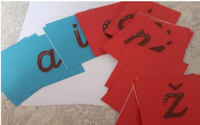
Slika 9- slova od brusnog papira