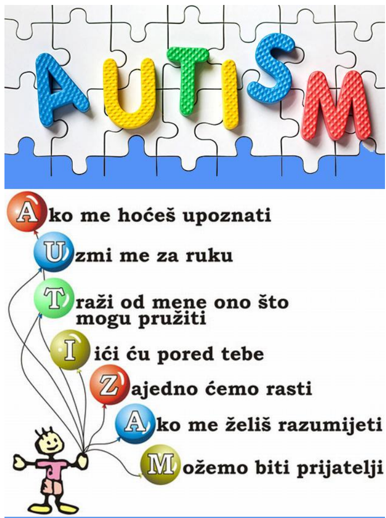
Slika 3. Plakat za svjetski dan svjesnosti o autizmu

Atipični poremećaj također pripada u poremećaje pervazivnih razvojnih poremećaja s nekim zajedničkim obilježjima autističnog poremećaja. Razlika između autističnog poremećaja i atipičnog poremećaja je ta što se atipični poremećaj javlja nakon treće godine djetetovog života i ne pojavljuje se poremećaj u sva tri područja kao kod autističnog poremećaja. (Remschmidt, 2009). Neki od simptoma koji su zajednički kod oba poremećaja su povlačenje u svoje misli i svoj svijet, neverbalan govor, pojava anksioznosti i ljutnje, izbjegavanje kontakta u oči te stereotipni pokreti. Atipični autizam može se javiti kao psihološki, biološki ili nasljedni poremećaj. (Bujas Petković i Frey Škrinjar, 2010).