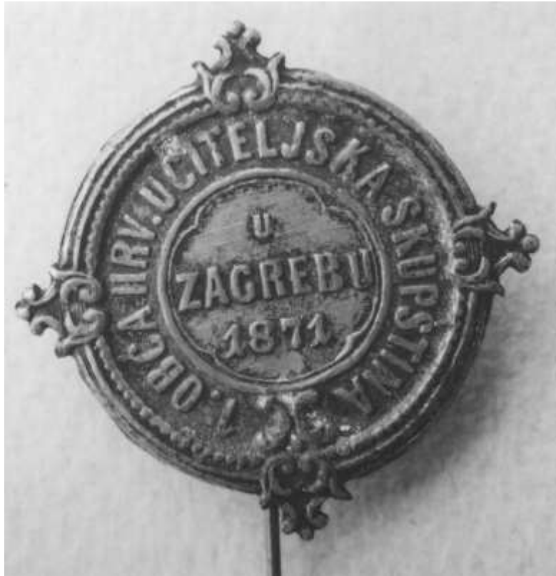
Slika 5. Značka I. opće hrvatske učiteljske skupštine (Hrvatski školski muzej, Zbirka školske opreme i predmeta, HŠM Mp2484)

Druga opća učiteljska skupština održana je 1874. godine u Petrinji, tada važnom društveno-kulturnom gradu na području Vojne krajine. Teme o kojima se raspravljalo na ovoj skupštini mogle su se nadovezati na teme Prve opće učiteljske skupštine, a obuhvaćale su unapređivanje rada učiteljskih škola, zadaće i ulogu građanskih škola u naobrazbi stanovništva, školski red i disciplinu i mnoge druge. (Šetić, 2012) Međutim, većih rasprava o obrazovanju žena nije bilo.