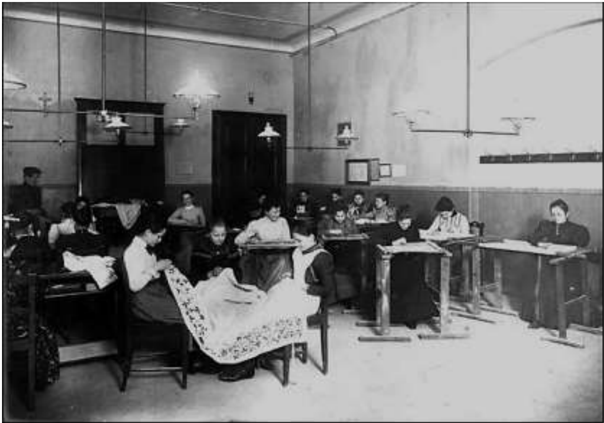
Slika 2. Učenice ženske stručne škole u Zagrebu za vrijeme tečaja vezenja oko 1900. kat. br.