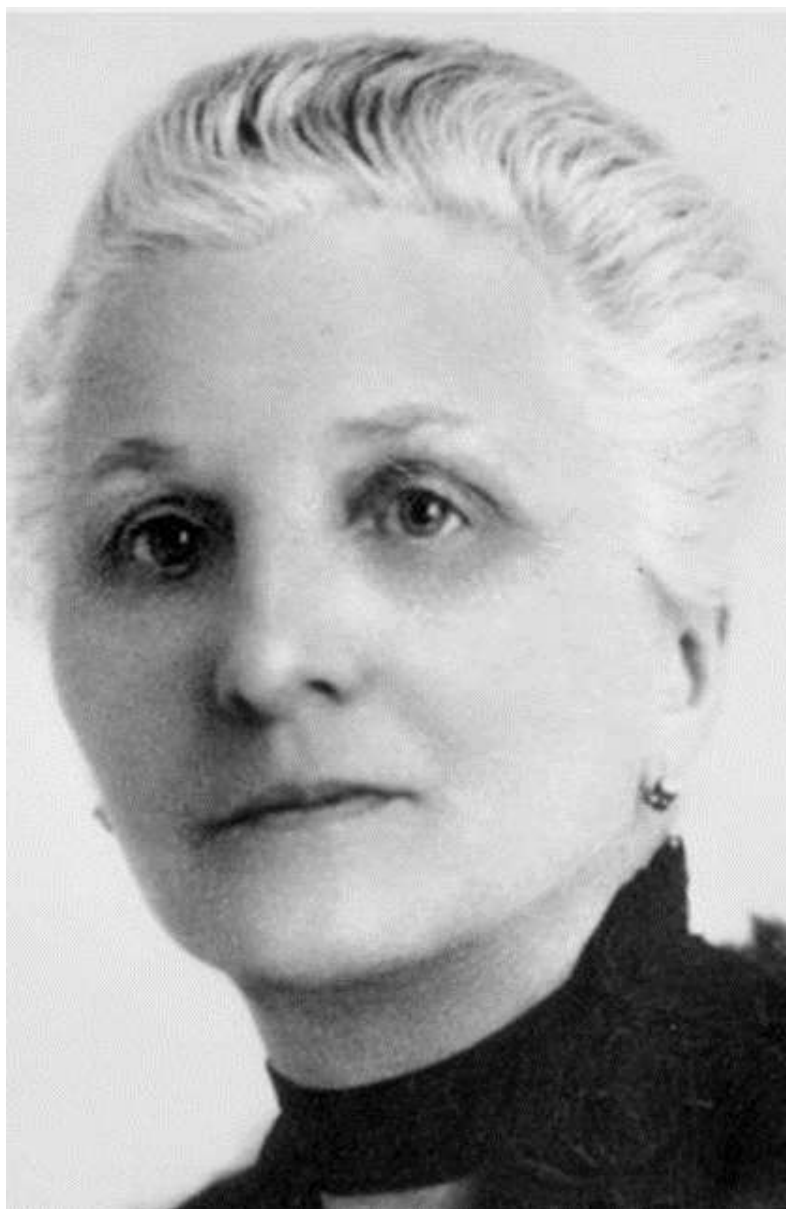
Slika 10. Jagoda Truhelka (Hrvatska enciklopedija)