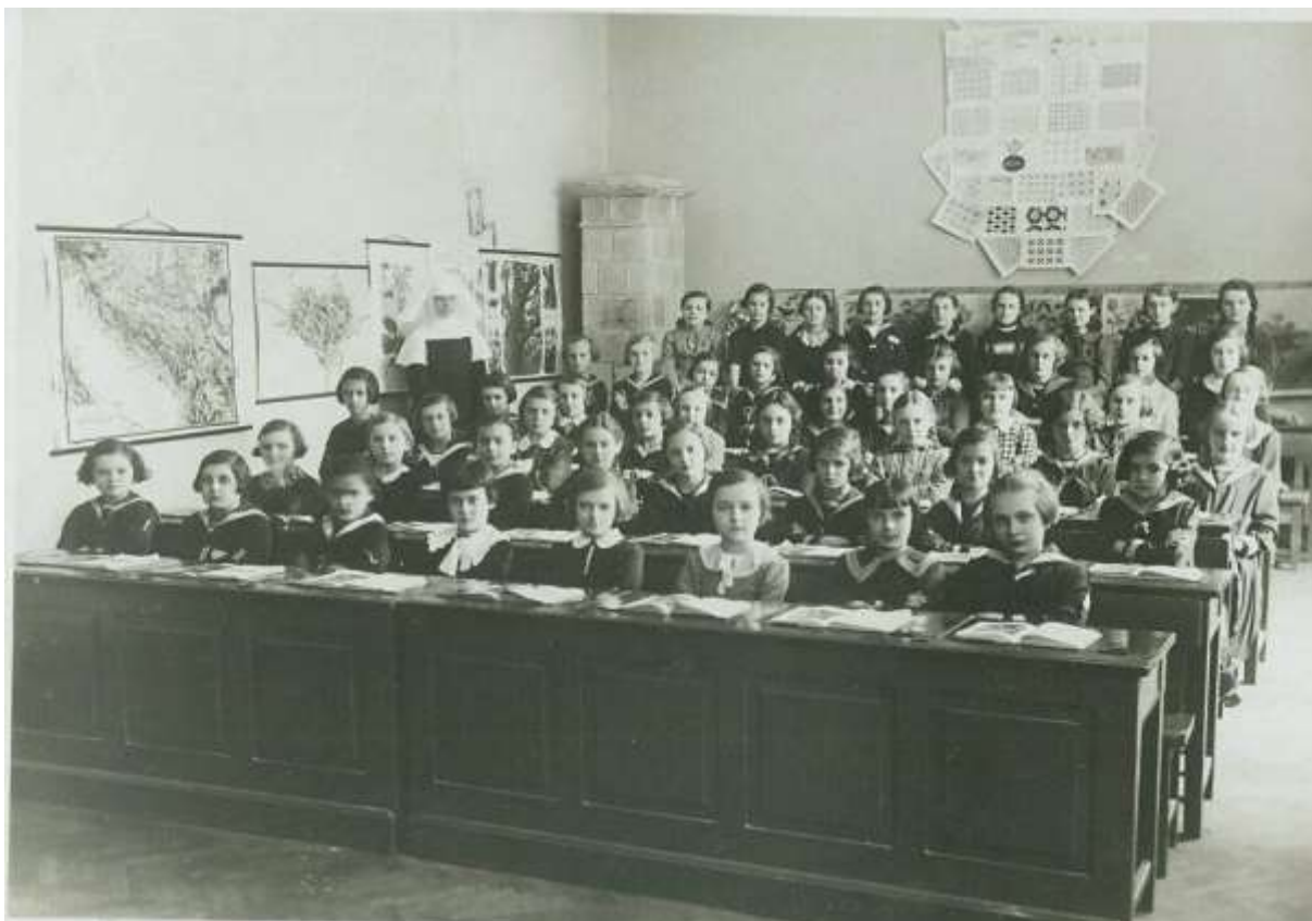
Slika 1. Osnovna škola u samostanu sestara milosrdnica u Zagrebu 1936./37.