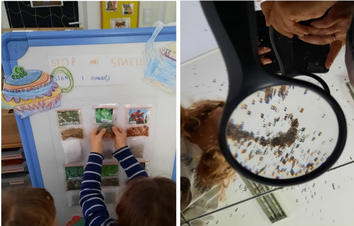
Slike 8 i 9

Slike 8 i 9 prikazuju dijelove istraživačkog centra. Djeca su istraživala strukturu čaja koristeći osjetila mirisa, opipa i vida. Miris i izgled čaja povezivali su s fotografijama biljaka. Posebno interesantan bio je stup „Stop and smell“ jer su djeca uživala u različitim mirisima čaja te su povezivali s onima koja smo već degustirali u skupini. Komentirala su koji čaj vole, a koji ne, mirise itd. Gledala su dokumentarni film o procesu izrade čaja. Istraživala su djelovanje vode na čaj i došli do nekih zaključaka: čaj boja vodu, ali se ne rastopi, ima specifičan miris, itd. Kasnije smo proveli i likovne aktivnosti. Djeca su izrađivala mirisne slike od čaja kombinirajući čaj i boje (tempera i vodene boje). Izradili smo aplikacije za pjesmu „I'm a little teapot.“. U ovom primjeru to su vizualni poticaji koji prate radnju pjesme (čajnici). Prvo smo ih stavili na pano, a kasnije su ih djeca koristila manipulirajući njima uz pjesmu ili u dramskom centru. Time smo uz govor, uključili i izražavanje pokretom i dramatizacijom. Aktivnost smo dokumentirali fotografiranjem i video-snimanjem djece. Igre kao što su „What's missing?“ i „Point to the...“ dobar su medij za proigravanje i ponavljanje vokabulara kroz igru. U početku odgajatelj vodi, ali poslije djeca sama organiziraju igru. Starija djeca preuzimaju ulogu voditelja i pomažu mlađoj djeci. Organiziraju igru „škole“ ili se igraju na tepihu ili za stolom. U igri „What's missing?“ kartice su složene na stolu. Kada djeca ne