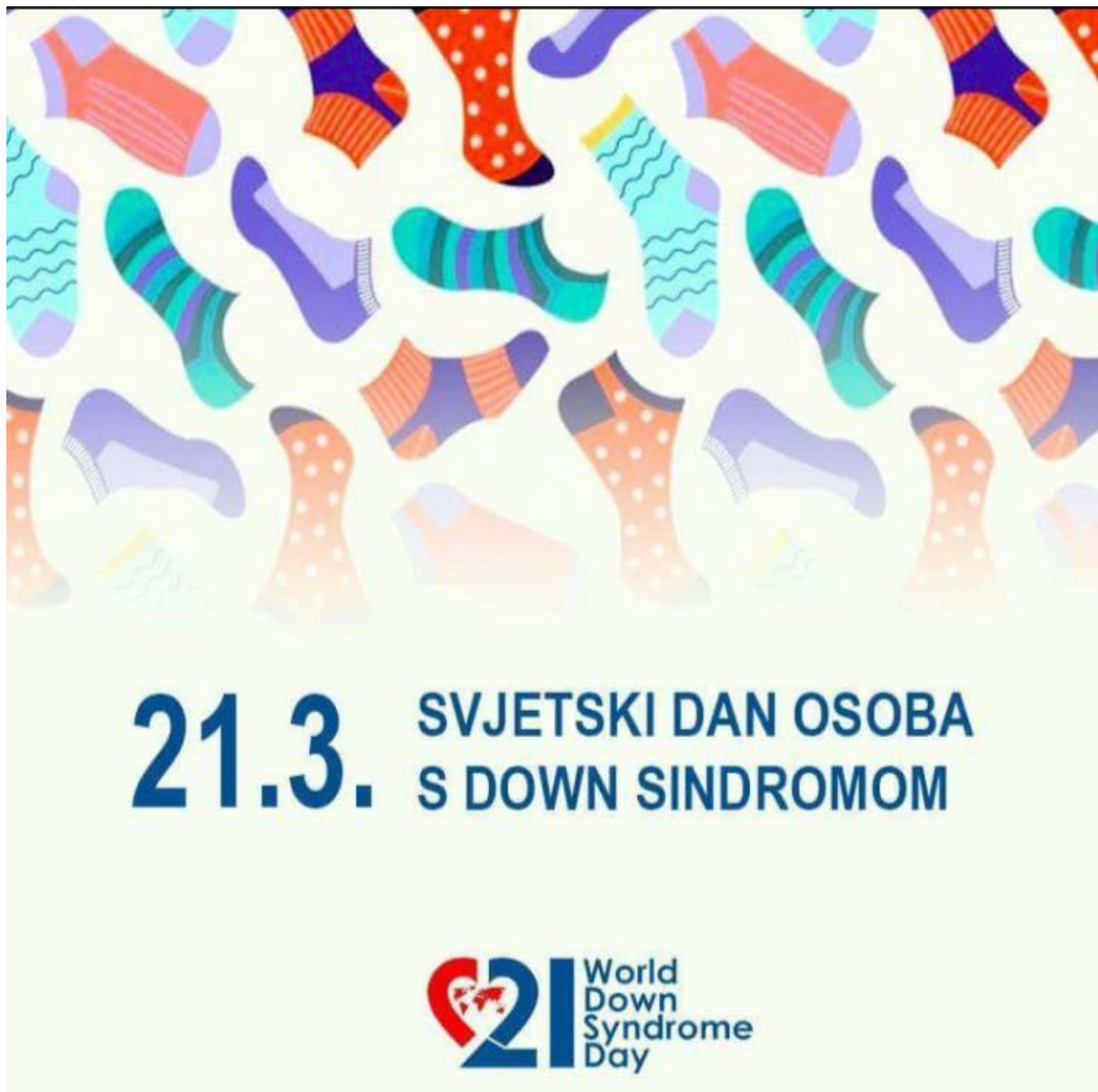
Slika 3. Šarene čarape - simbol za Dan Down sindroma

razloga zašto je to tako. Naime, kromosomi imaju oblik čarape, a uz to što se djeca i odrasli s Down sindromom razlikuju od ostalih ljudi, upravo se oblačeći različite čarape nastoji pružiti podrška osobama s Down sindromom, odnosno, šalje se poruka da se različitosti uvelike prihvaćaju.