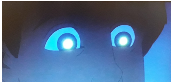
Slika 7. Detalj

Kao i u originalnoj bajci, u filmu se često naglašava ljepota Arieleina glasa. Dubinski plan koristi se u sceni u kojoj Ariele iz daljine promatra Erica dok nju istodobno promatraju zle jegulje. Navedenim se stvara napetost. Detaljem očiju princa Erica prikazuje se njegova začaranost.