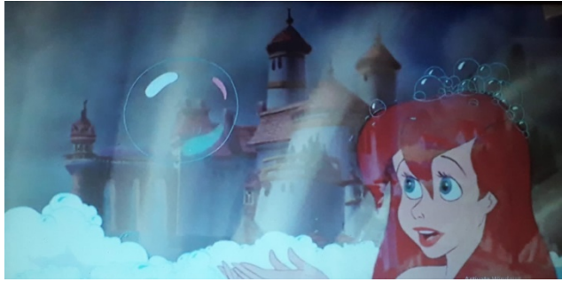
Slika 6. Pretapanje

Kao i u originalnoj bajci, u filmu se često naglašava ljepota Arieleina glasa. Dubinski plan koristi se u sceni u kojoj Ariele iz daljine promatra Erica dok nju istodobno promatraju zle jegulje. Navedenim se stvara napetost. Detaljem očiju princa Erica prikazuje se njegova začaranost.