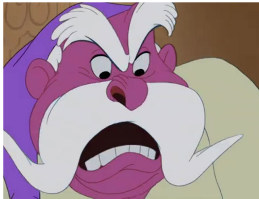
Slika 4. Ekspresija emocija promjenom boje

U ovom filmu veliku važnost imaju boje. U većini scena u kojima se pojavljuje Pepeljuga prevladavaju svijetloplavi i ponekad ružičasti tonovi, ali ako se pojavi maćeha, boje postaju tamnije. Tamnim, prigušenim bojama prikazuju se scene koje označavaju strah, opasnost i zavist. Bojama se izražavaju emocije. Primjerice, kada se kralj naljuti, lice mu pocrveni.