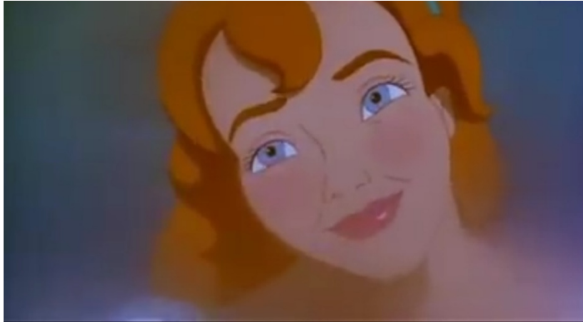
Slika 5. Krupni plan

odtamnjenje. Kada se zaljubljuje, Palčica je prikazana u krupnom planu. Kako bi se naglasio osjećaj zaljubljenosti.