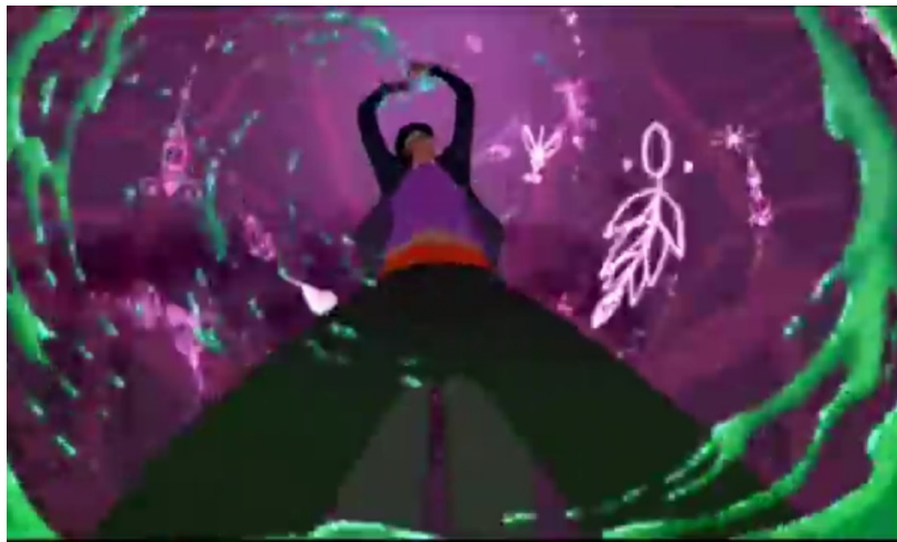
Slika 2. Donji rakurs

Kosim kadrom dočarava se nesklad i prijetnja u trenutku završne borbe dobra i zla kada se dr. Facilier približava glavnim likovima. Osjećaj nelagode postignut je jezivim ekspresijama lica antagonista, upotrebom tamnih boja i sablasnih šumova. Peterlić (2000) ističe kako osobe snimane iz donjeg rakursa ponekad gube „vezu sa zemljom”. Autor nastavlja da se kosim kadrom može stvoriti osjećaj opće labilnosti, nervoze i sumnje da se lik u sceni priprema na zlodjelo. Upravo je donji rakurs upotrijebljen u sceni bacanja kletve.