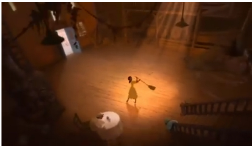
Slika 3. Gornji rakurs

Projekcijsko filmsko vrijeme je u trajanju od 91 minute dok je dramsko vrijeme označeno radnjom koja se zbiva, uz mnoga preskakanja, pomoću elipse 17 od djetinjstva do mlade odrasle dobi glavne junakinje. Motiv zvijezde jedan je od ključnih motiva u priči. Razni likovi, čak i oni skeptični, obraćaju joj se moleći je za ispunjenje želja. Zvijezda se pojavljuje i u prvom i zadnjem kadru filma.