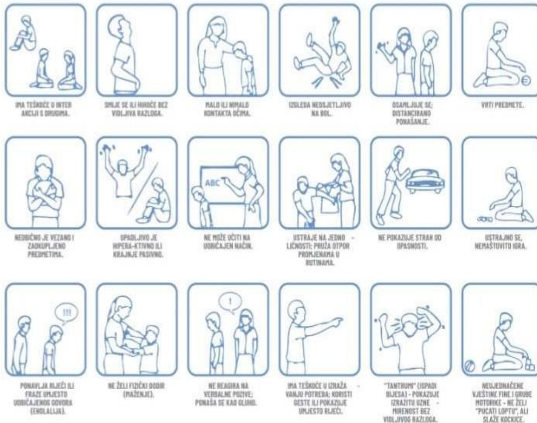
Slika 2: Kako prepoznati osobe s poremećajem iz spektra autizma