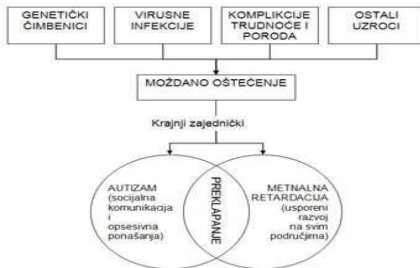
Slika 3: Prikaz zajedničkog djelovanja mogućih različitih uzročnih čimbenika na nastanak poremećaja iz spektra autizma (preuzeto iz Baron – Cohen i Boltn, 1993)

Baron-Cohen i Patric Bolton, sumirajući sve navedene činjenice i hipoteze o uzrocima PSA, govore o modelu krajnjeg zajedničkog učinka. Genetski uzroci, virusne infekcije u ranoj dobi, komplikacije u trudnoći i pri porođaju te drugi čimbenici mogu uzrokovati moždano oštećenje. Rezultat krajnjeg zajedničkog učinka svih, ili nekih od navedenih čimbenika, jest PSA ili intelektualno oštećenje, koji se u nekim dijelovima preklapaju (Bujas-Petković, Frey Škrinjar, 2010:72).