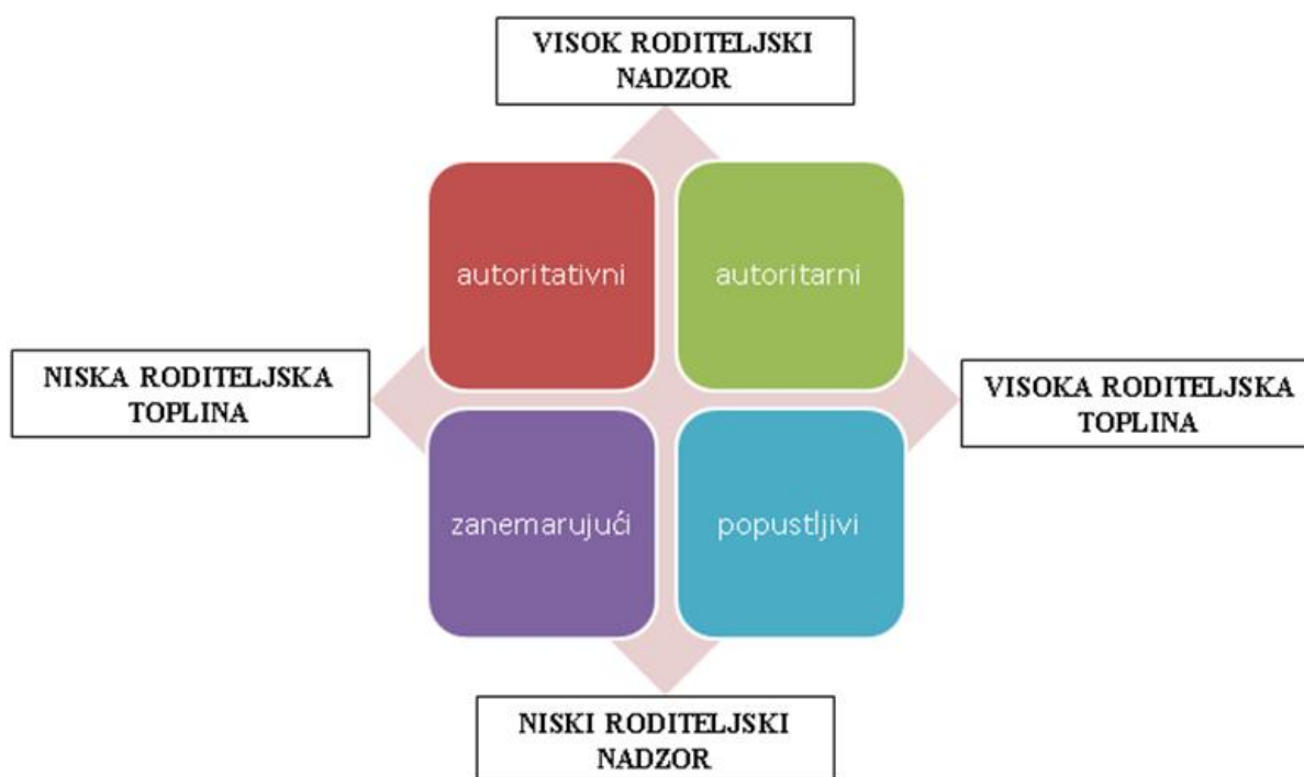
Slika 1. Prikaz roditeljskih stilova

Postoje dvije osnovne dimenzije svakog roditeljstva, a to su emocionalnost i kontrola. Kada govorimo o emocionalnosti, govorimo o rasponu dimenzije od hladnoće i odbijanja djeteta pa sve do topline i prihvaćanja djeteta, dok se kontrola odnosi na dimenzije od slabe roditeljske kontrole nad ponašanjem djeteta do čvrste roditeljske kontrole. Ove dvije osnovne dimenzije roditeljstva pomažu u klasifikaciji roditeljskih stilova, gdje govorimo o autoritativnom (demokratskom), popustljivom (permisivnom), autoritarnom (autokratskom) te zanemarujućem (indiferentnom) roditeljskom stilu (Baumrind, 1973; prema Brajša Žganec, 2003).