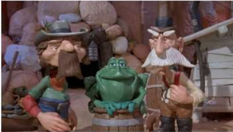
Vampir Ernest (epizoda 1.)