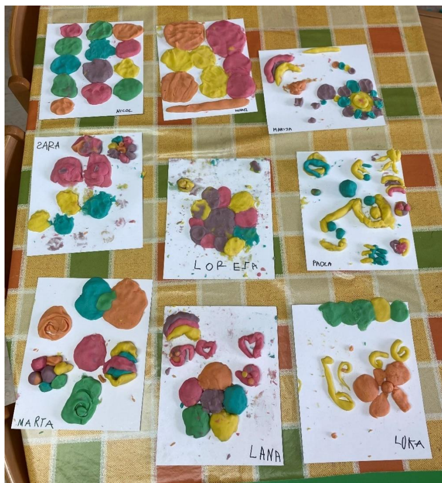
Slika 8. Završni likovni radovi djece kiparskom tehnikom plastelina

Nakon prve provedene aktivnosti djeca su imala priliku raditi likovne radove plastelinom. Djeca su koristila domaći plastelin u šest boja koje je umjetnica Hilma af Klint koristila na svojim slikama. Djeci su ponovo bile ponuđene njezine slike naziva „Deset najvećih“ i imali su slobodu oblikovati plastelin po vlastitim željama uz inspiraciju njezinih slika. Također, tijekom ove aktivnosti većina djece je pokazala interes za različitim motivima sa slika dok se jedno dijete držalo jednog motiva kroz čitav rad. Plastelin je bio zahtjevnija likovna aktivnost jer su djeca tražila rješenja kako napraviti složene apstraktne oblike pomoću ove kiparske tehnike.