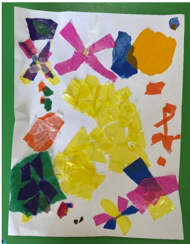
Slika 13. Završni grupni rad sa svilenim kolažom

U likovnoj aktivnosti sa svilenim kolažom sudjelovalo je manje djece. Tijekom rada djeci je trganje svilenog kolaža predstavljalo izazov. Najviše su teškoća imali prilikom trganja kolaža u obliku kruga koji se ponavlja kroz sve dosad prikazane završne radove. Pokazala sam im kako preklapanjem svilenog kolaža mogu dobiti različite boje i nijanse te su se na moj poticaj okušali u tome. Rad sadrži najviše motiv cvijeta i kruga, ali se zamjećuje i dječji pokušaj kopiranja nekih dijelova Hilminih slika. Djeca su kopirala dva kruga koja se preklapaju s Hilmine slike „Djetinjstvo“ te su preklapanjem narančastog i plavog svilenog papira dobili zelenu. Također, sa spomenute slike napravili su narančasti krug s bijelim cvijetom koji se može zamijetiti s lijeve strane njihovog rada. Djeca su se prvi put susrela sa svilenim kolažom, ali su vrlo brzo shvatila kako ga koristiti iako zahtjeva dobro razvijenu finu motoriku i strpljenje pri trganju.