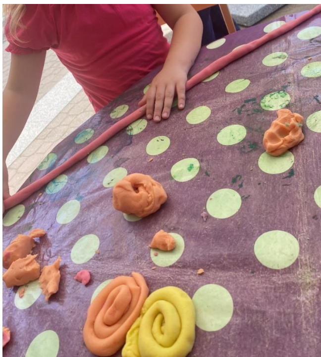
Slika 10. Djeca u dvorištu vrtića rade velike „puževe kućice“ od plastelina