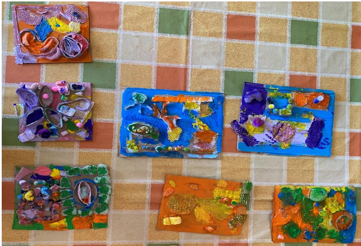
Slika 4. Završni radovi asamblaža nakon otiskivanja

Drugi dan smo osušene otiske na papiru nadopunili crtanjem s crnim flomasterom uzimajući motive sa spomenutih slika umjetnice Hilme af Klint. Djeca su mogla izabrati bilo koju njezinu sliku ili više njih i s nje uzeti motive koji im se najviše sviđaju. Svidjelo im se što flomasteri imaju dvije strane pa su mogli izabrati debljinu linija tijekom crtanja.