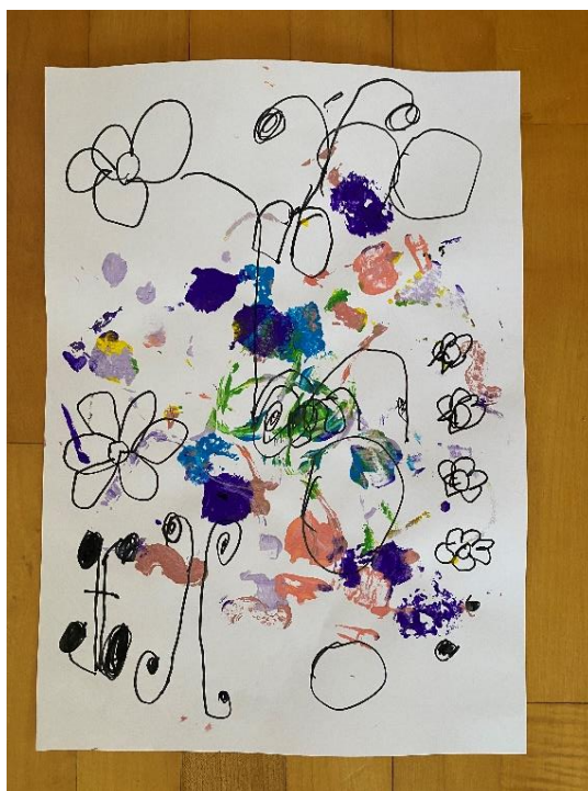
Slika 7. Rad djevojčice s nacrtanim različitim motivima sa slika