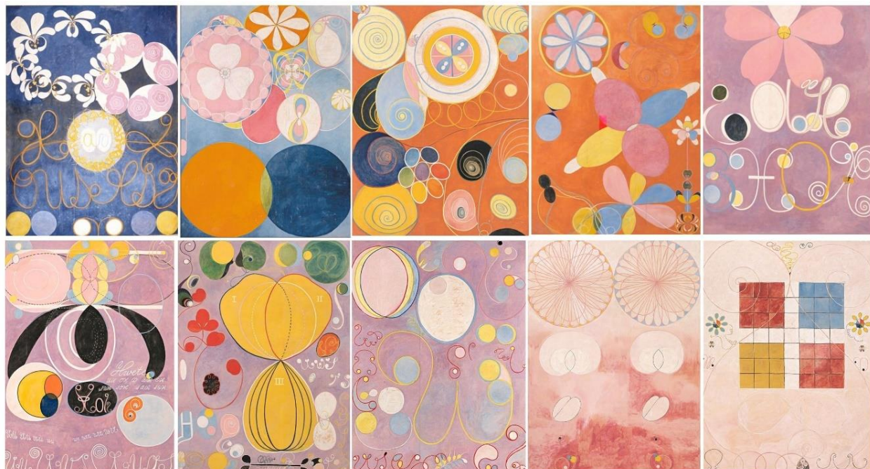
Slika 3. „Deset najvećih“– Hilma af Klint

Prema Petraču (2015) likovno-umjetničko djelo ne treba promatrati na točno određen način. Likovno-umjetničko djelo promatra se tako da kreativnost odrasle osobe ili djeteta kombinira, varira i osmisli nove načine promatranja i poticaja na istraživanje. Likovne aktivnosti u radu s djecom su kombinacija i varijacija različitih materijala i tehnika koje umjetnica nije koristila. Dječja kreativnost koja je vidljiva u ovom radu osmislila je nove načine promatranja likovno-umjetničkih djela te ih potaknula da istražuju mogućnosti materijala i različitih tehnika.