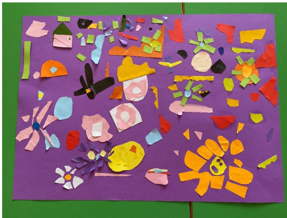
Slika 12. Završni grupni rad djece s kolaž papirom

Tijekom likovne aktivnosti gdje je bio ponuđen ljubičasti papir pristupilo je više djece. U toj aktivnosti djeca su izrezivala željene motive iz kolaža, a imali su za inspiraciju Hilmine slike. Aktivnost je osim djece predškolske dobi zainteresirala i djevojčicu koja je nedavno navršila tri godine. Djevojčica je u ovoj likovnoj aktivnosti provela puno vremena te dio zajedničkog likovnog rada pripada i njezinom trudu. Djeca su uglavnom oblikovala motive cvijeća i krugova, ali na radu se nalazi i motiv kuće i nasmijanog sunca.