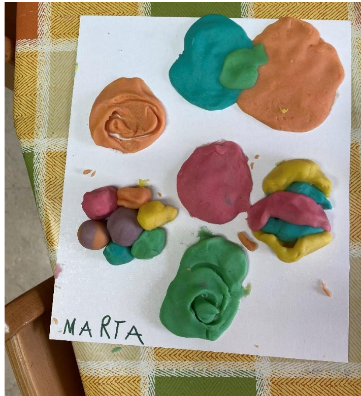
Slika 9. Likovni rad djevojčice koja je udubila plastelin prstom u obliku „puževe kućice“

U mnogim radovima se pojavljuje cvijet ili duga te su se okušali i u oblikovanju „puževe kućice“. Neki su oblikovali „puževe kućice“ radeći „zmijicu“ koju su presavijali na kartonu dok na jednom radu dijete prstom udubljuje plastelin u obliku kruga kako bi dobilo spomenuti oblik. Na svakom radu se pojavljuje oblik kruga, ali uz to svaki rad ima barem jedan motiv koji se ne pojavljuje na drugim radovima.