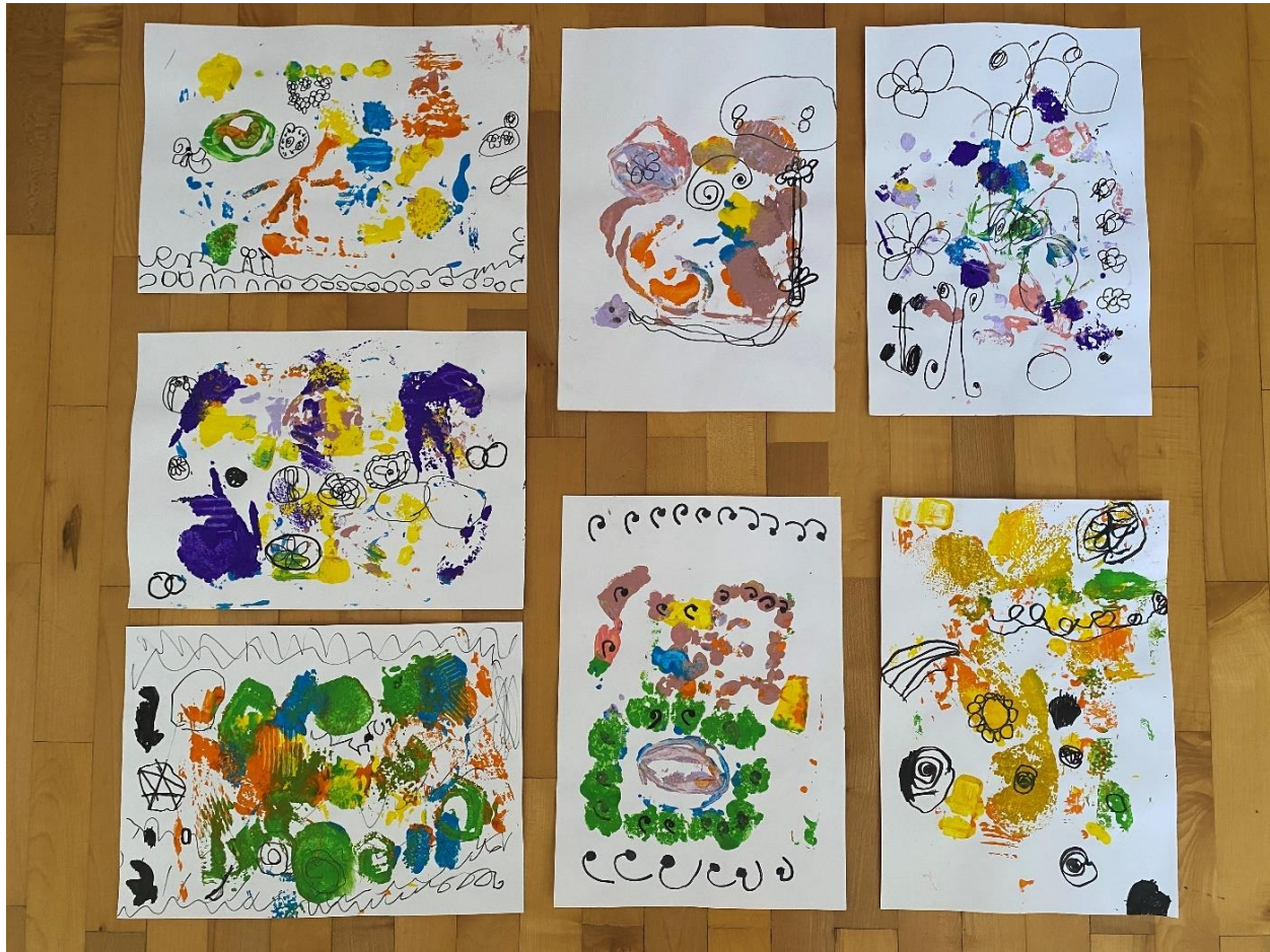
Slika 5. Završni radovi nakon otiskivanja i crtanja crnim flomasterom

Tijekom njihovog rada zamijetila sam da su se djeca fokusirala na jednu sliku koja im se najviše svidjela. Mali je broj djece pokazao interes za kombiniranje motiva s različitih slika. Samo jedno dijete se fokusiralo na jedan motiv kroz cijeli svoj rad, dok su ostala djeca kombinirali više motiva koje su uočili na slikama.