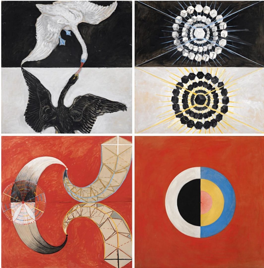
Slika 2. Dio slika Hilme af Klint iz serije „Slike za hram“, podserija „Labud“

Serijske koje slijede poslije serije „Slike za hram“ nisu toliko velike i nemaju tako kompliciranu podstrukturu, no pojedinačne slike su rijetkost. Umjetnica je prije smrti izrazila želju da se njezina djela „Slike za hram“ ne prodaju odvojeno.