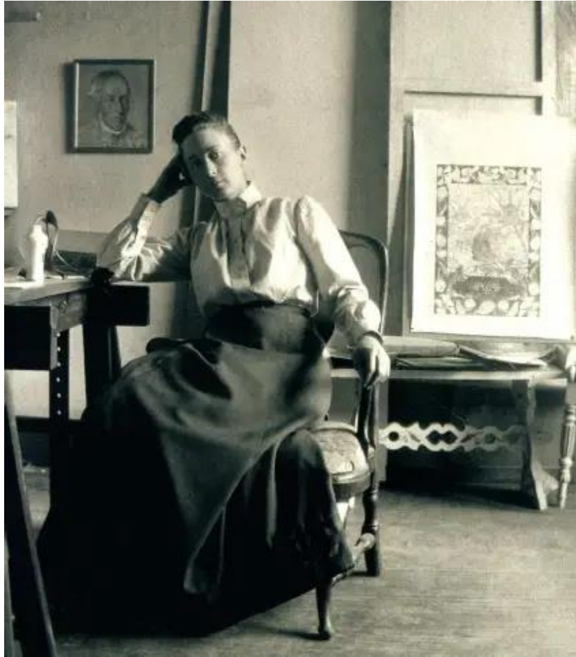
Slika 1. Hilma af Klint u svojem studiu u Hamngatanu 1895. godina