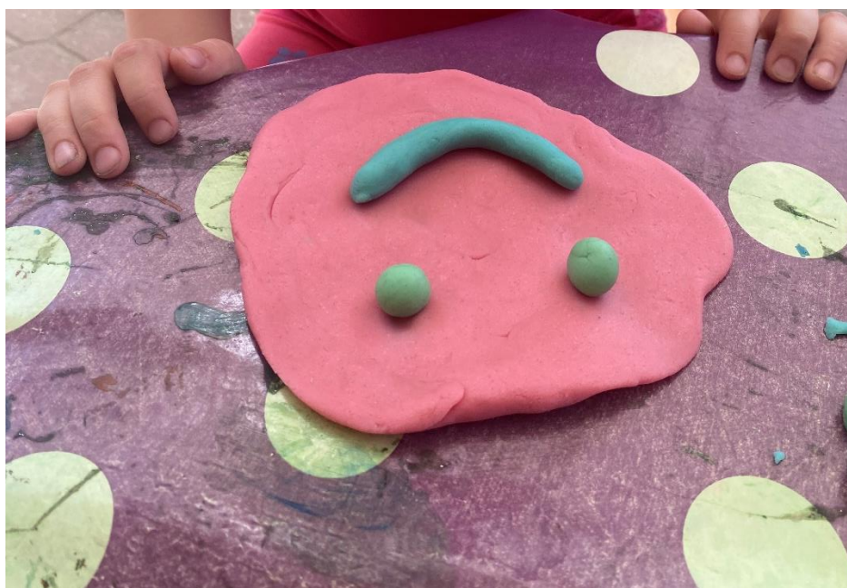
Slika 11. Rad djevojčice kojoj se likovna aktivnost jako sviđjela