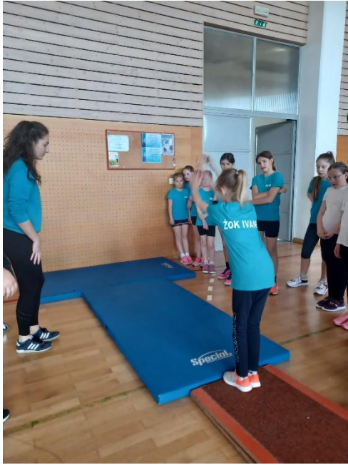
Slika 3. Početni položaj skoka u dalj