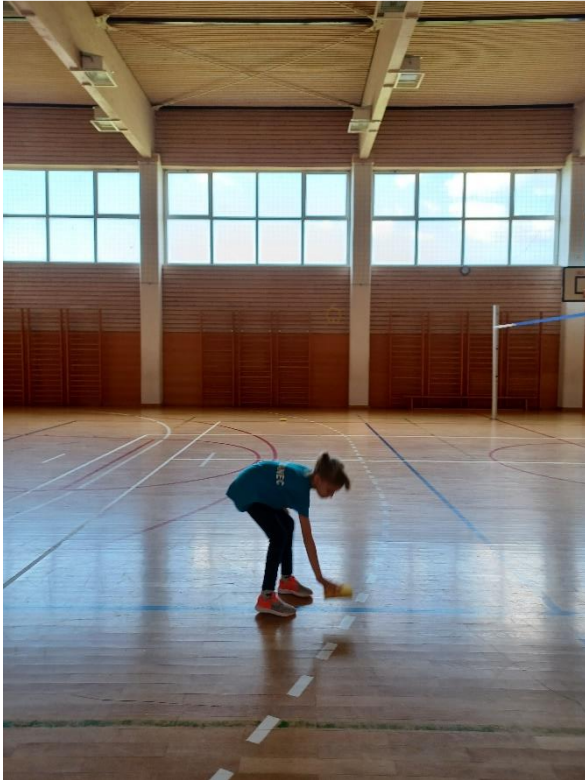
Slika 7. Prenošenje pretrčavanjem

Vrijeme se mjeri od trenutka starta do polaganja druge spužve iza startne linije. Rezultat se očitava su stotinkama sekunde.