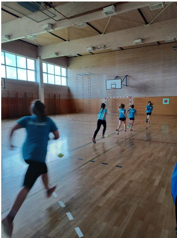
Slika 9. Trčanje 3 minute

Ispitanik stoji iza startne linije u visokom položaju. Na znak starta učenik započinje trčanjem na 3 minute. Prijeđena udaljenost upisuje se u metrima.