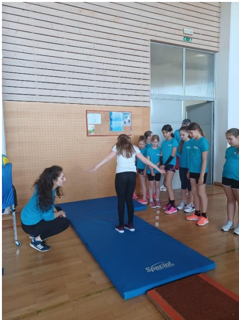
Slika 5. Čitanje rezultata