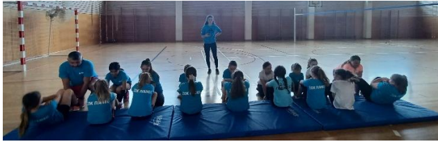
Slika 8. Podizanje trupa