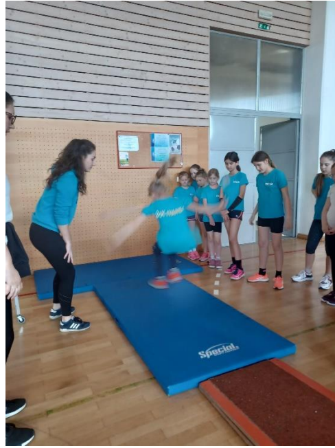
Slika 4. Skok u dalj