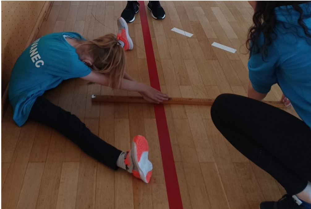
Slika 6. Pretklon raznožno

Ispitanik stoji raznožno na tlu, nogama raširenim za dvije dužine stopala. Ispitanik predruči ispruženim rukama i stavlja dlan desne na dlan lijeve ruke tako da se srednji prsti preklapaju. Traka se postavlja između nogu ispitanika tako da je 40. centimetar na zamišljenoj liniji koja spaja petu. Ispitanik se nakon dva lagana pretklona lagano spušta u najveći mogući pretklon. Kada ispitanik vrhovima prstiju dosegne i jednu sekundu zadrži položaj, taj se rezultat očitava. Ispitivač se za to vrijeme nalazi uz ispitanika, u klečećem položaju, licem okrenutim prema centimetarskoj traci. Rezultat se upisuje u centimetrima, a test se ponavlja tri puta.