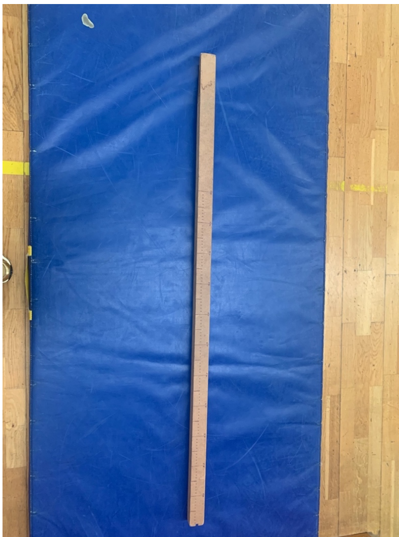
Fotografija 3. Drvena daska s ucrtanim centimetrima za pretklon raznožno

Pomagala: drvena daska s ucrtanim centimetrima i dvije spojene strunjače