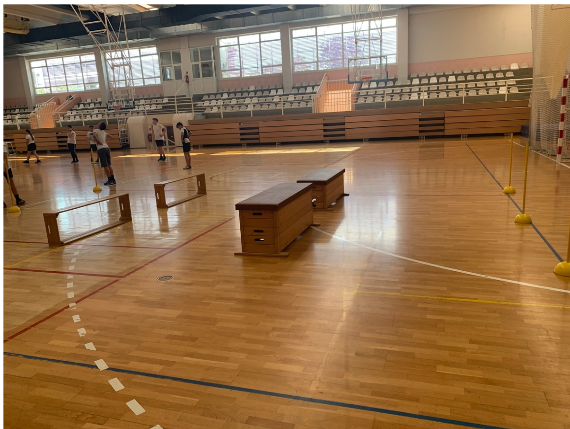
Fotografija 4. Radna stanica za poligon natraške