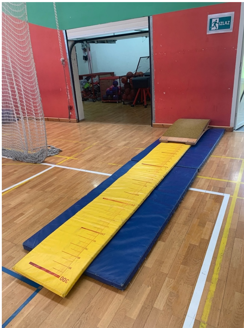
Fotografija 2. Radna stanica za skok u dalj s mjesta

Pomagala: strunjača s označenom metarskom trakom i odskočna daska