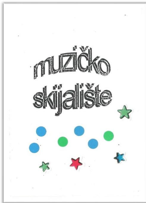
Slika 4. i 5. Igra 'Muzičko skijalište' (vlastiti materijal)

igra, a naše ga ponašanje mora uvjeriti u to da se i mi igramo. Samo tako nas dijete prihvaća kao pedagoga i kao prijatelja“ (Letica, 2017, str. 36).