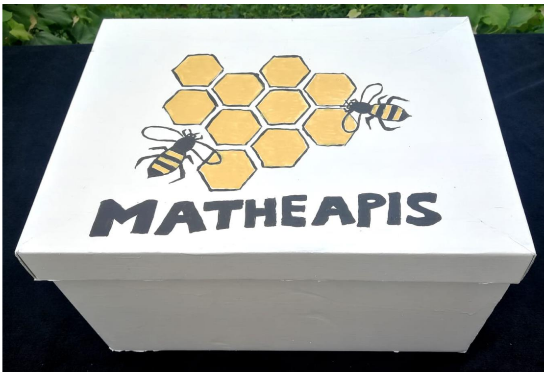
Slika 9. Kutija igre