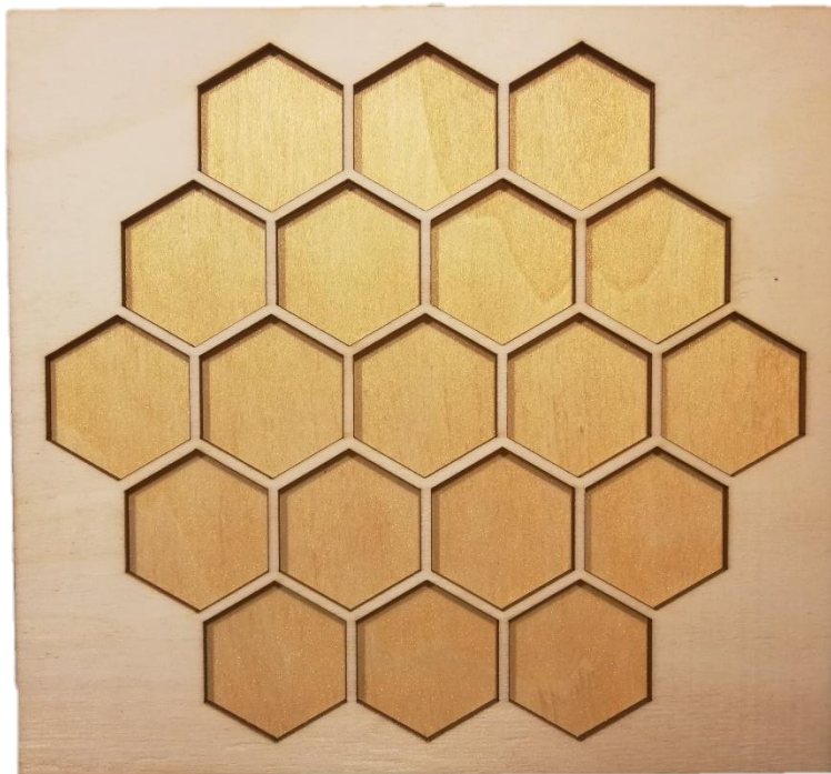
Slika 6. Konačna vezija satne osnove

Kako bi se osigurala kvaliteta i trajnost kartica u igri MatheApis, pristupilo se njihovoj izradi s posebnom pažnjom na detalje. Prvo je korišten programski alat Microsoft Word za dizajniranje kartica, što je omogućilo precizno oblikovanje i strukturiranje njihovog sadržaja. Nakon dizajna, kartice su isprintane na debljem papiru. Odabir debljeg papira osigurava da kartice budu izdržljive i otporne na savijanje te da mogu izdržati često rukovanje tijekom igre. Oblik kartica odabran je kao pravokutni s zaobljenim rubovima. Zaobljeni rubovi osiguravaju sigurnost i smanjuju mogućnost oštećenja kartica zbog oštih rubova. Ovakav oblik također pruža ugodan vizualni dojam i estetsku privlačnost, doprinosi cjelokupnom doživljaju igre.