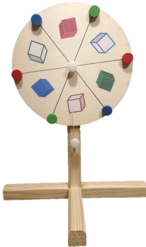
Slika 8. Matematičko kolo

U okviru razmatranja materijala i konstrukcije za matematičko kolo u edukativnoj igri, donesena je odluka da se koristi drvo kao osnovni materijal. Ova odluka je donesena iz razloga dugotrajnosti i izdržljivosti koju drvo pruža u odnosu na druge materijale. Matematičko kolo je element igre koji omogućava rotaciju i odabir matematičkih zadataka. Izbor drva kao materijala za izradu kola pruža izdržljivost potrebnu za čestu vrtanju i korištenje kola. Otpornost drva na habanje i lomljenje osigurava dugotrajnost kola, omogućujući igračima da ga koriste bez straha od oštećenja ili gubitka funkcionalnosti.