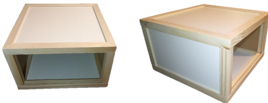
Slika 2. i 3. Košnica