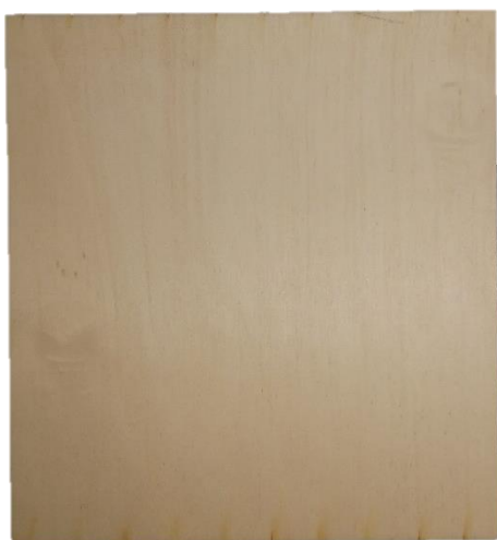
Slika 4. Prirodna boja podloge

Za postizanje funkcionalnosti umetanja saća u igri MatheApis, bila je potrebna izrada posebne podloge koja bi omogućila lakše prekrivanje brojki u igri. Da bi se ostvarila ova funkcionalnost, podloga je izrezana pomoću laserskog stroja zajedno s veličinom satne osnove. Nakon što je podloga izrezana, pristupilo se estetskom aspektu izrade. Podloga je obojana zlatnom akrilnom bojom koja je odabrana s ciljem pružanja vizualne privlačnosti i dodatne estetike. Konačni korak u procesu izrade bio je spajanje podloge i satne osnove. To je postignuto primjenom drvofiksa kao ljepila. Ovim procesom postignuta je konačna verzija satne osnove koja se koristi u igri MatheApis.