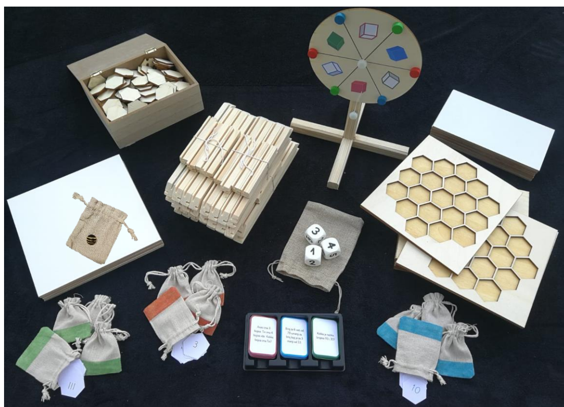
Slika 11. Sadržaj kutije igre