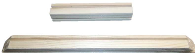
Slika 1. Bridovi košnice

Za izradu košnice u igri MatheApis, korištena je metoda koja uključuje precizno izrezivanje letvica od daske pomoću kružne pile. Dobivene letvice predstavljaju bridove košnice i imaju važnu ulogu u konstrukciji igre. Kako bi se omogućilo povezivanje letvica, na njima su izrezani utori koji su pažljivo prilagođeni dimenzijama i mjerama košnice. Nakon što su letvice izrezane, kako bi se postigla glatka i ujednačena površina, koristio se brusni papir. Za izradu bočnih stranica košnice, korišten je lesonit materijal. Kružnom pilom precizno su izrezane bočne stranice prema odgovarajućim mjerama. Lesonit je odabran kao materijal zbog svoje čvrstoće i izdržljivosti te pružanja stabilnosti i trajnosti košnice tijekom igre. Ovaj proces izrade, koji uključuje izrezivanje letvica od daske, urezivanje utora te izrezivanje bočnih stranica od lesonita, omogućuje konstrukciju košnice u skladu s potrebnim dimenzijama i proporcijama igre MatheApis. Preciznost i stručnost u izradi osiguravaju kvalitetnu i funkcionalnu igru koja pruža optimalno iskustvo igračima.