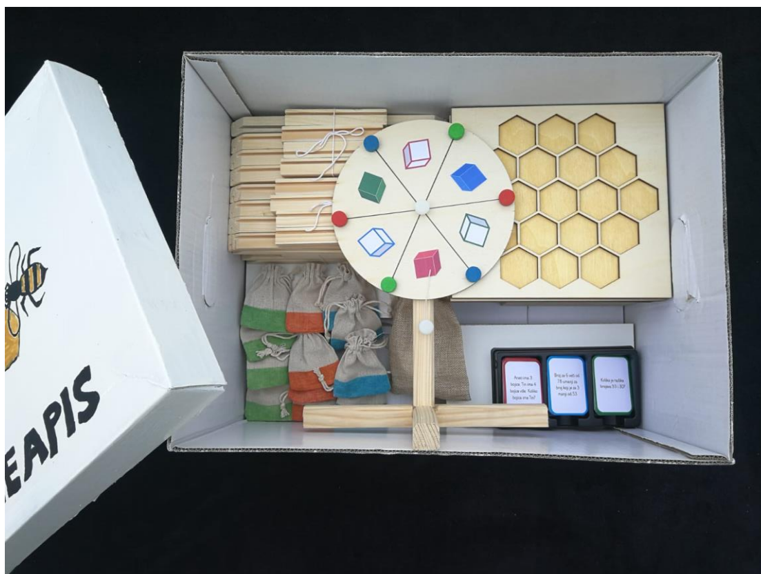
Slika 10. Unutrašnjost kutije