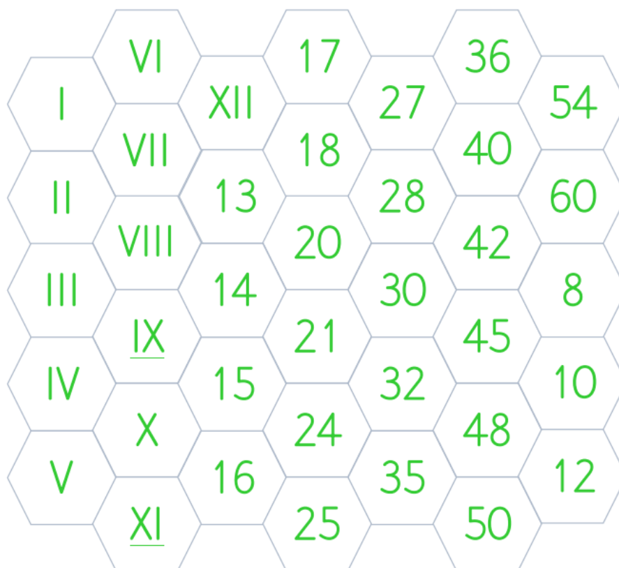
Šesterokuti s brojkama – srednja razina