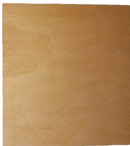
Slika 5. Obojana podloga