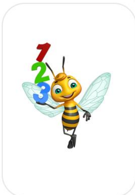
Slika 13. Stražnja strana kartica