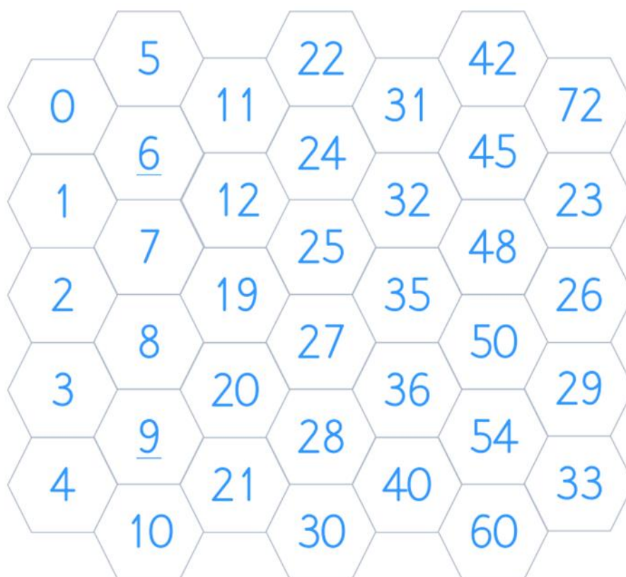
Šesterokuti s brojkama – teža razina

Kao što je već navedeno, igra je namijenjena različitim uzrastima te je i sam sadržaj prilagođen tome. Osim što postoje tri razine u težini pitanja kod kartica, gdje je vidljiva razlika u sadržaju koji se uči u pojedinom razredu, razlika je prisutna i u dijelu igre s kockicama, odnosno u brojevima koji se nalaze unutar satne osnove. Kao što kod kartica ima tri razine naznačene trima bojama koje predstavljaju lakšu, srednju i težu razinu, tako i brojke imaju svoju boju. Crvene brojke predstavljaju lakšu razinu i namijenjene su učenicima prvoga razreda. Zelene brojke predstavljaju srednju razinu i namijenjene su učenicima drugoga razreda. Plave brojke namijenjene su učenicima trećeg i četvrtoga razreda, a predstavljaju težu razinu. Brojevi izabrani za pojedinu razinu odabrani su prema ishodima kurikulumu iz 2019. godine. Prema tome, napravljene su sve varijante i kombinacije brojeva. U prvome razredu prisutno je zbrajanje i oduzimanje brojeva do 20 i 0. Shodno tome, brojevi koji se nalaze na šesterokutima, a mogu se dobiti zbrajanjem i oduzimanjem triju kockica koje sadrže brojeve od 1 do 6, brojevi su od 0 do 18. U drugome razredu učenici zbrajaju i oduzimaju u skupu prirodnih brojeva do 100 te množe i dijele u okviru tablice množenja. Prema tome, brojevi koji se nalaze na šesterokutima mogu se dobiti zbrajanjem, oduzimanjem, množenjem i dijeljenjem triju kockica