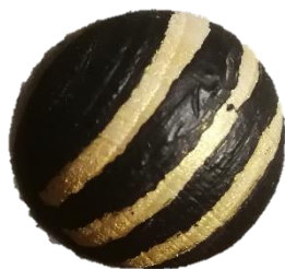
Slika 14. Figurica pčelinji zadak

U igri MatheApis, igrači imaju zadatak skupljati figurice koje su oblikovane i obojene na način koji asocira na pčelinji zadak. Kada igrač skupi dvije figurice s pčelinjim zadacima, stječe mogućnost da odabere šesterokut s brojkom i pokrije ga. Da bi igrač mogao skupiti pčelinji zadak, potrebno je da na dvije kockice dobije isti broj. Tek tada će moći uzeti figuricu pčelinjeg zadaka i dodati je svojoj kolekciji. Ova mehanika igre potiče strateško razmišljanje i donošenje odluka prilikom odabira koji će šesterokut s brojkom prekriti saćom.