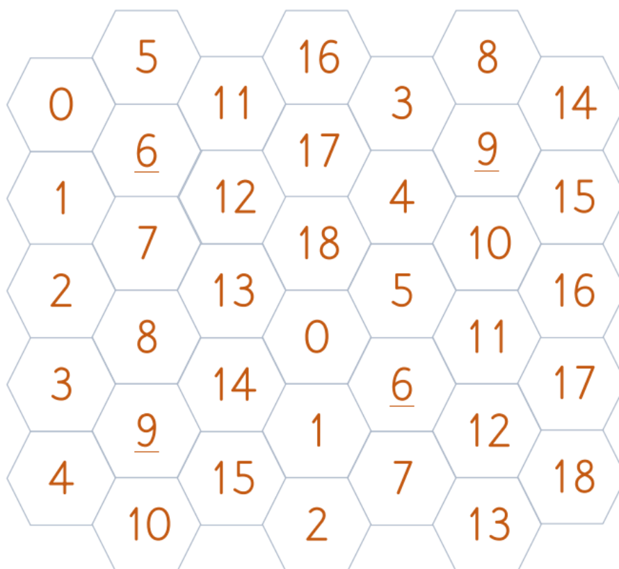
Šesterokuti s brojkama – lakša razina