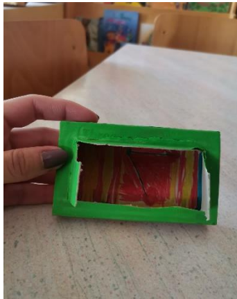
Slika 18 „Nacrtao sam lijek med i čaj“ dječak F (6 godina)