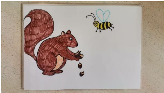
Slika 9 kartica 4