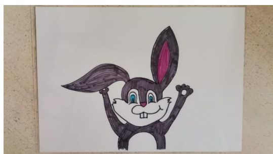
Slika 15 kartica 10