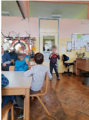
Slika 24 dječje pričanje priče

Nakon njihove priče svi smo im pljeskali. Zatim su djeca rekla da i oni žele ispričati svoje „kamišibaj priče“ ispred ostalih. Taj dio aktivnosti mi nije bio u planu, ali sam odlučila promijeniti smjer aktivnosti u skladu sa željama djece. Na slici ispod je prikazano kako dijete koje priča priču dok stoji ispred ostale djece koja slušaju.