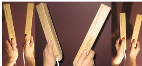
Slika 2 hyōshigi (拍子木)