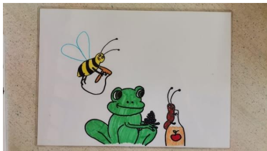
Slika 14 kartica 9