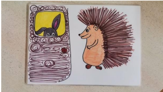
Slika 7 kartica 2