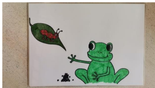
Slika 11 kartica 6