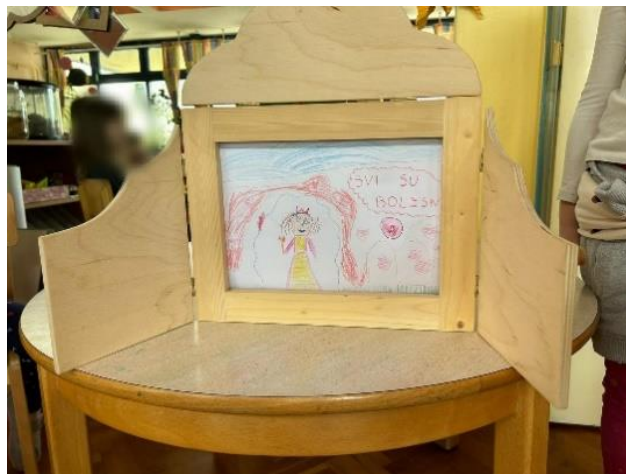
Slika 21 „Jednom davno je bila princeza i onda je otišla u selo onda na kampiranje u drugo selo“