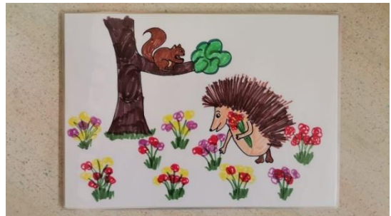
Slika 8 kartica 3