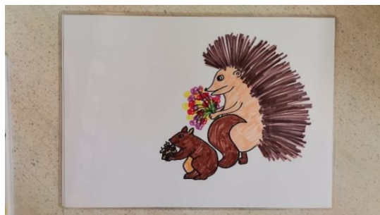
Slika 13 kartica 8