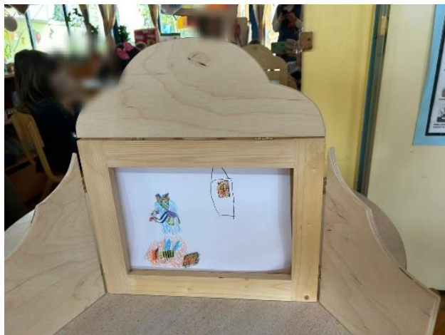
Slika 22 „I onda je otišla natrag kuci. I onda je otišla svog psa šetati i onda“