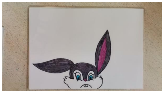
Slika 12 kartica 7