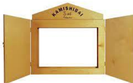
Slika 1 butaj preuzeto sa:

McGowan (2010) definira kamišibaj („kamishibai“ – papirnato kazalište) kao način pričanja priča, umjetničku izvedbu, koja se pojavila u Japanu u kasnim dvadesetim godinama dvadesetog stoljeća, a popularnost je stekao četrdesetih i pedesetih godina istog. Povezuje ga se s pričom o trgovcima slatkišima koji su putovali na svojim biciklima noseći drveni okvir. Djeci su uz slatkiše, koje su im prodavali, pričali priče koristeći okvir kao pozornicu. Priče su pričane na licu mjesta, a kartice s ilustracijama mijenjale su se u drvenom okviru (butaj) kako je priča tekla. U kasnim pedesetim godinama dvadesetog stoljeća s pojavom televizora nestao je kamišibaj, ali se vratio u posljednjih nekoliko godina i raširio se iz Japana po cijelom svijetu.