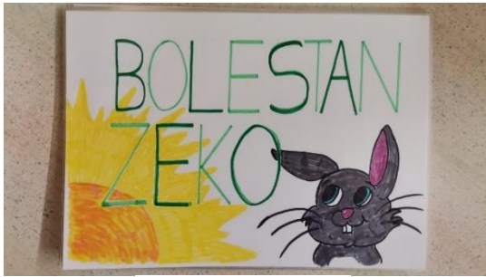
Slika 5 naslovna kartica

Nakon pričanja polagano sam zatvorila butaj izgovarajući: „Tko se priče sjeća njega prati sreća“. Kratko sam zastala kako bi djeca slegnula dojmove priče i upitala: „A sad ćemo vidjeti čega se vi sjećate.“ S djecom sam nakon ovog prvog čitanja razgovarala o likovima i fabuli priče. Nakon kratkog razgovora rekla sam: „Sada ću priču ispričati još jednom, a vi opet pažljivo slušajte.“