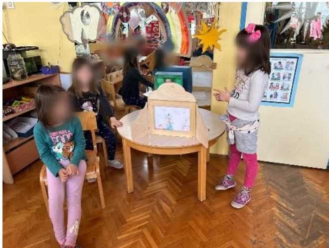
Slika 25 djevojčice izvode kamišibaj priču „Svi su bolesni“

Djeca su se nakon boravka na dvorištu vratila u sobu i pitala me: „Mogu li prije ručka cure ponovo ispričati priču?“. Djevojčicama sam ponovo pomogla složiti crteže u butaj, djeca su se smjestila i priča je krenula: