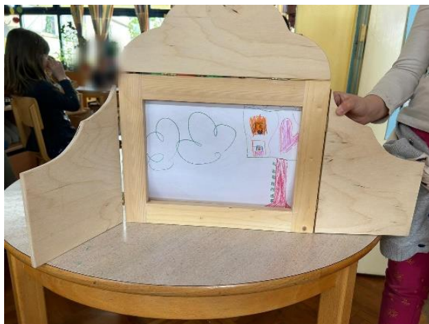
Slika 23 „I taj pas je bio bolestan i onda mu je vjeverica donijela buket cvijeća i onda je došla pčelica i upitala za koga bereš to lijepo cvijeće i onda je vjeverica rekla pas je bolestan želim mu pokloniti cvijeće i onda je pčelica rekla onda ću ja donijeti med i onda je odletjela u košnicu i nabrala med. I pas je ozdravio.“