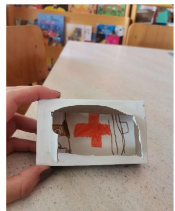
Slika 19 "Nacrtao sam trešnju da prijateljica ozdravi kad jede voće da može ići vani s prijateljima se igrati" djevojčica E (6 godina)