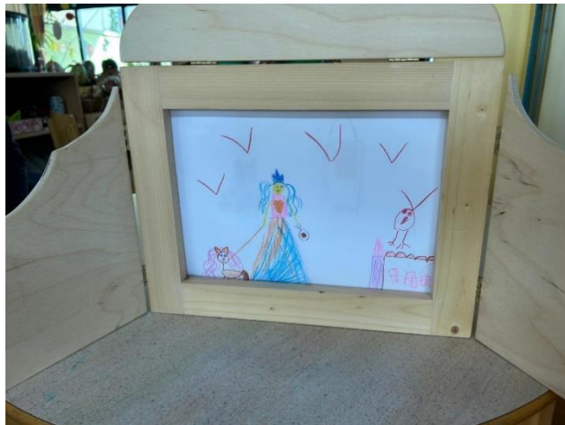
Slika 20 "Svi su bolesni"