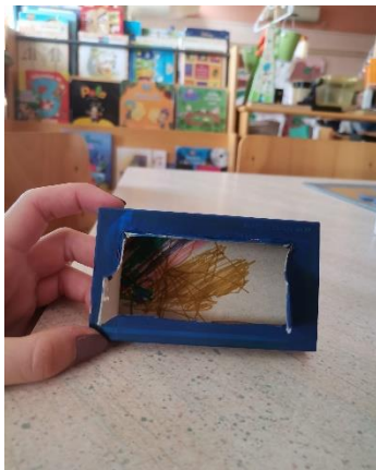
Slika 17 „Nacrtao sam prijatelja kako mu donosim proljeće da ga razveselim“ dječak T (5 godina)

Dječji radovi u kamišibaj butajima na temu „Što bi poklonio/la bolesnom prijatelju?“