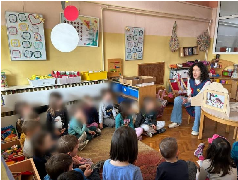
Slika 4 kamišibaj izvedba

Pričam djeci priču „Bolestan zeko“. Kojoj sam u svojoj improviziranoj interpretaciji promijenila iz originalnog epskog teksta riječ „umoran“ u riječ „bolestan“. Također sam umjesto „...se začulo zvono na vratima“ rekla „čulo se kucanje na vratima“ i dodala zvuk kucanja o stolicu na kojem sam sjedila. Kroz cijelo pričanje sam se koristila gestama i mimikom i držala kontakt očima s djecom.