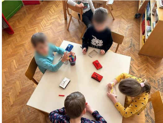
Slika 16 djeca izrađuju kamišibaj

Djeca slikaju flomasterima u kamišibaj butajima napravljenima od kutija za šibice. Naglasila bih da nisu sva djeca htjela slikati nego su izabrala slobodnu igru u centru građenja.