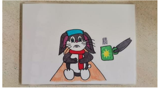
Slika 6 kartica 1