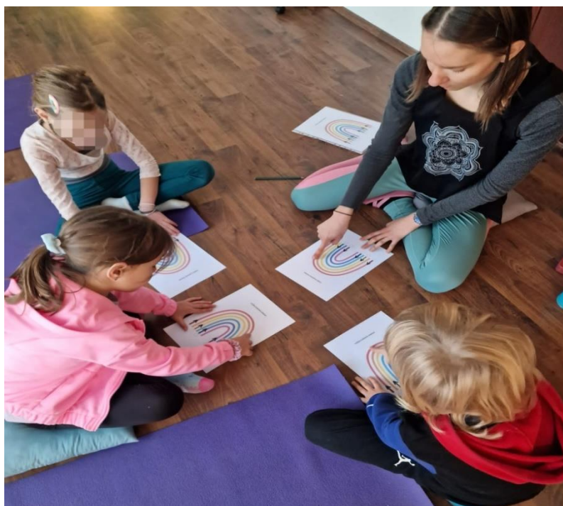
Slika 3. Duboko disanje po predlošku duge

Djeca zamisle da je napuhani balon jako lomljivo jaje. Potrebno je polako i pažljivo kretati se do drugoga i predati mu balon “jaje“ (Obućina, 2020).