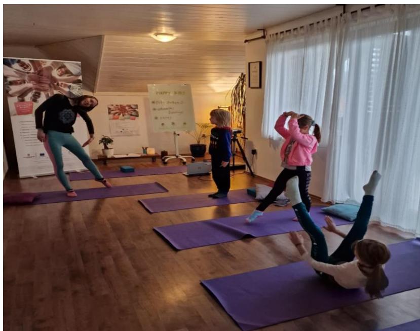
Slika 2. Asane prilagođene radu sa djecom

U jogi djeca kroz zabavan način istražuju svoje tijelo i opuštaju se. Dok izvode vježbe neprestano preispituju svoju razinu fleksibilnosti, snage, prate kako održavaju balans tijela i slično. Za vrijeme vježbi ne forsiraju se pokreti, dječje mogućnosti se ne uspoređuju. Djecu se ohrabruje i pohvaljuju se njihova upornost i strpljivost. Uči ih se da poštuju svoje tijelo i da je najvažnije da se osjećaju ugodno (Strgar, 2021).