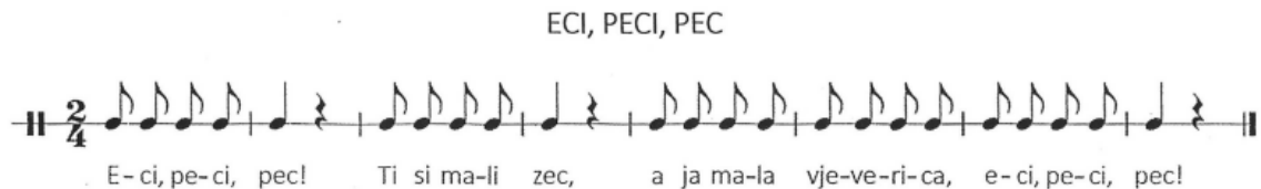
Slika 2. Brojalica Eci, peci, pec , (Kraljić, 2016, str. 45)

Ova kombinirana brojalica također može biti izvrsno sredstvo za upoznavanje zeca i vjeverice, osobito za djecu u mlađoj odgojno-obrazovnoj skupini. Djeca metar, ritam, tempo i dinamiku brojalice mogu označavati na razne načine uz pokret kao način rada. To može uključivati tjeloglazbu (ruke, noge, cijelo tijelo) ili se može odvijati uz pomoć udaraljki. Odgojitelj odlučuje uz koje će se pokrete brojalica izgovarati, a svakako može slijediti želje djece.