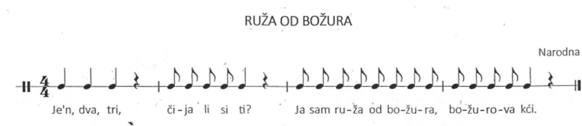
Slika 13. Brojalica Ruža od božura (Kraljić, 2016, str. 46)

Aktivnost odgojitelj može provesti na način da pljeskom otkucava metar brojalice, a nakon što mu se djeca pridruže mijenja načine sviranja metra kroz tjeloglazbu i prelazi na sviranje ritma brojalice. Također, odgojitelj može aktivnost usvajanja brojalice upotpuniti različitim udaraljka koje stvaraju posebno ozračje. Nakon usvajanja, odgojitelj može s djecom analizirati pjesmu i razgovarati o novoj vrsti biljke i njezinom nazivu koji je do sada djeci bio nepoznat pojam te ih potaknuti na daljnje istraživanje motiva.