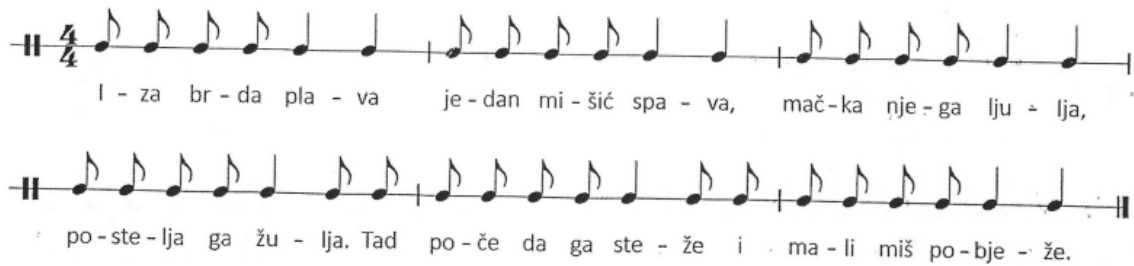
Slika 6. Brojalica Iza brda plava (Kraljić, 2016, str. 49)