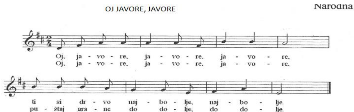
Slika 10. Pjesma Oj javore, javore (Gospodnetić, Novosel i Blašković, 2010, str. 39)

Aktivnost usvajanja pjesme može se provoditi uz aplikacije javorova lišća ili šarenih trakica koje djeca u pjesmi mogu pokretati i tako označavati javorove grane obrasle listovima.