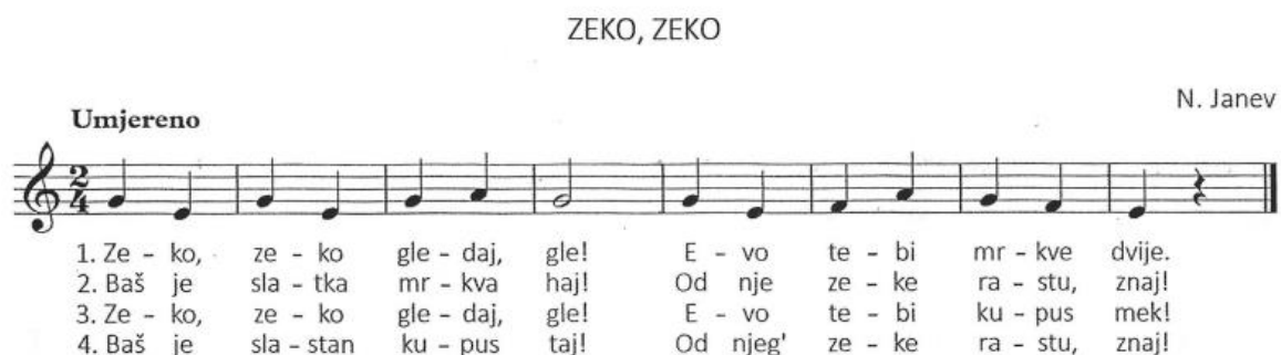
Slika 1. Pjesma Zeko, zeko (Kraljić, 2016, str. 7)

Prilikom usvajanja pjesme Zeko, zeko odgojitelj može djeci podijeliti aplikacije, odnosno slike na štapiću različitih pasmina zečeva. Na ovaj će način djeca mlađe odgojno-obrazovne skupine, između ostalog, osvijestiti da postoji mnogo razlika između iste životinje što može biti savršen poticaj za daljnje istraživanje.