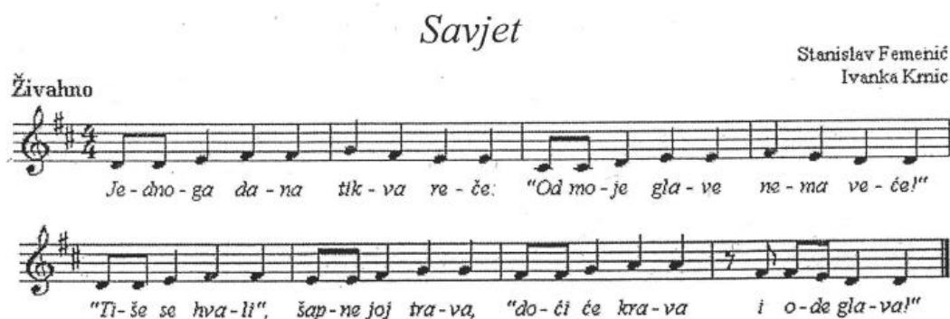
Slika 9. Pjesma Savjet (Gospodnetić, Novosel i Blašković, 2010, str. 69)

Aktivnost usvajanja pjesme može se izvoditi kroz igru na način da jedno dijete bude u sredini kruga i predstavlja tikvu. Poželjno je da odgojitelj obogati aktivnost aplikacijom koja će označavati tikvu iz pjesme. To može biti artefakt ili šešir u obliku tikve, važno je da djeci bude zanimljivo i da se može nataknuti na glavu. Djeca iz kruga predstavljaju travu. Nakon što su djeca usvojila pjesmu, aktivnost ponavljanja pjesme može se odvijati tako da dijete iz sredine kruga pjeva dio koji izgovara tikva, a ostala djeca pjevaju ostatak pjesme.