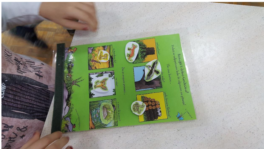
Slika 8: Igra „Pridruživanje slika odgovarajućem mjestu“

U igri pridruživanja slika na odgovarajuće mjesto, djeca su uz pomoć čička pridruživala slike životinja iz priče (miš, sova, lisica, zmija, žaba i ptica) na sličicu koja odgovara njihovom staništu, odnosno njihovom „domu“ u priči ( pod zemljom, na vrhu stabla, među drvenim kladama, na šumskom tlu, na nebu i na jezeru). (slika 8)