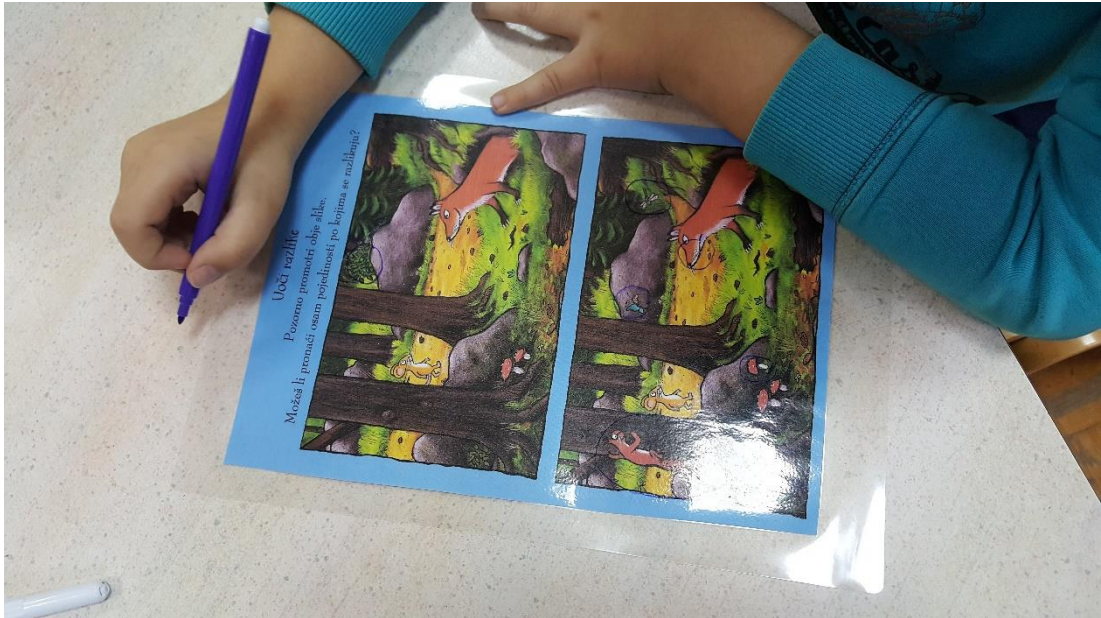
Slika 6: Igra „Uočavanje sličnosti i razlika 1“

U igri „Uočavanje sličnosti i razlika“ djeca su zaokruživala razlike na dvije naizgled slične slike iz priče o grubzonu. To su radili uz pomoć markera na plastificiranome predlošku. (slika 6)