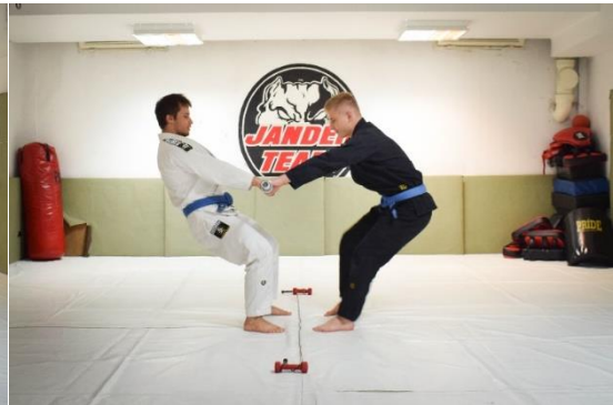
Slika 16. Povlačenje palice