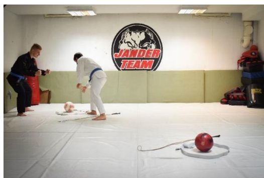
Slika 30. Igrač uzima drugu loptu