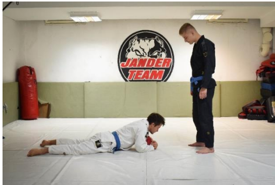
Slika 13. Početna pozicija

Vježba se izvodi u paru. Vježbač zauzima ležeći položaj na prsima držeći ispod trupa loptu. Zadatak suvježbača je preoteti loptu vježbaču.