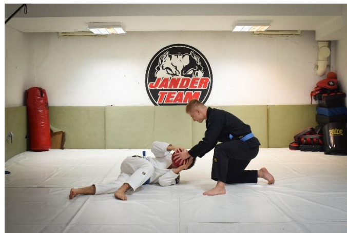
Slika 15. Otimanje lopte