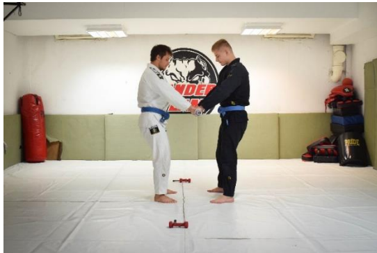
Slika 15. Početna pozicija

Na podlogu za vježbanje postavljena je oznaka koja prezentira granicu. Vježbači zauzimaju stojeću poziciju, svako sa jedne strane granice, držeći se zajedno za krajeve palice. Cilj vježbe je potežući palicu pomaknuti partnera preko granice.