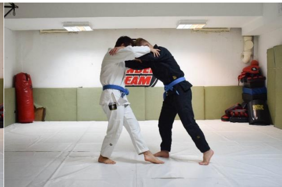
Slika 11. Pokušaj dodirivanja