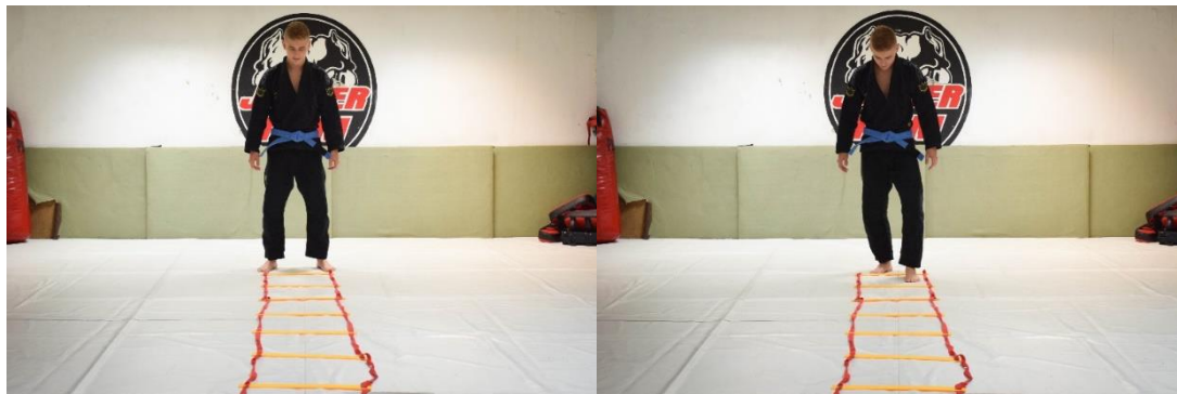
Slika 18. Početna pozicija

Na podlogu za vježbanje postavljene su koordinacijske ljestve. Vježba se izvodi na način da se u svaki omeđeni kvadrat stane najprije jednom, pa drugom nogom. Prilikom izvođenja vježbe važno je pripaziti da se u svaki kvadrat prilikom stajanja pridruži druga noga.