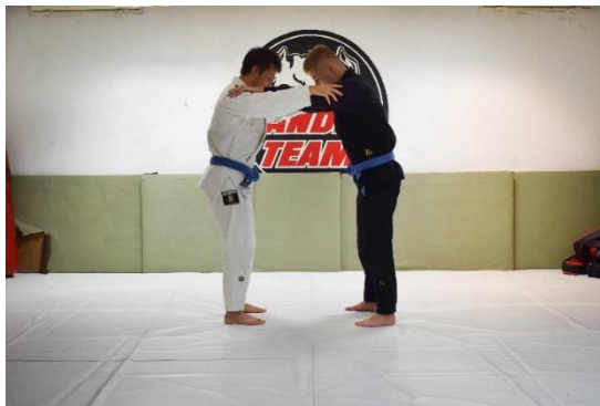
Slika 10. Početna pozicija

Vježba se izvodi u paru. Vježbači uspravno stoje, okrenuti licem jedan prema drugome, držeći se međusobno za ramena. Cilj ove vježbe je protivniku dotaknuti stopalo vlastitim stopalom.