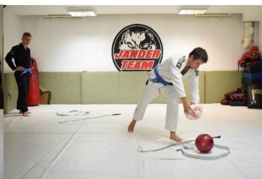
Slika 31. Igrač ostavlja drugu loptu u obruču