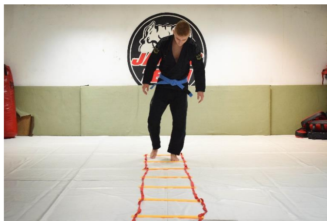
Slika 20. Pridruživanje druge noge