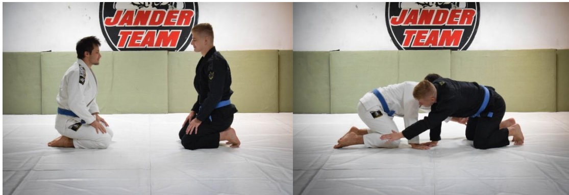
Slika 5. Početna pozicija

Vježbači zauzimaju klečeći stav, okrenuti pritom jedan prema drugome. Ruke su uz tijelo. Cilj igre je dotaknuti suvježbača na način da se izbjegne suvježbačev dodir.