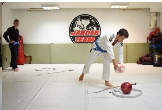
Slika 31. Igrač ostavlja drugu loptu u obruču