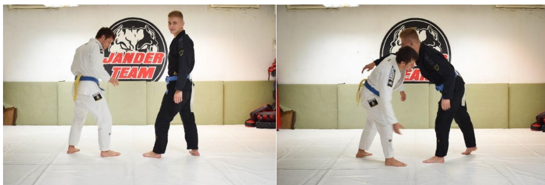
Slika 23. Početna pozicija

Vježba se izvodi u paru. Oba vježbača zataknu komad tkanine ili pojasa u odjeću, u ovome primjeru za pojas. Cilj vježbe je oduzeti tuđi zataknuti repić.