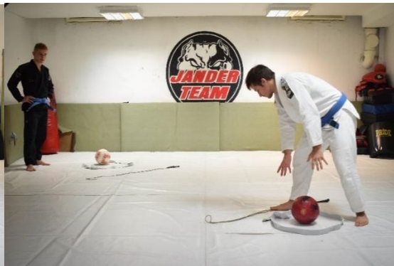
Slika 29. Igrač ostavlja loptu u obruču i vraća na poziciju starta