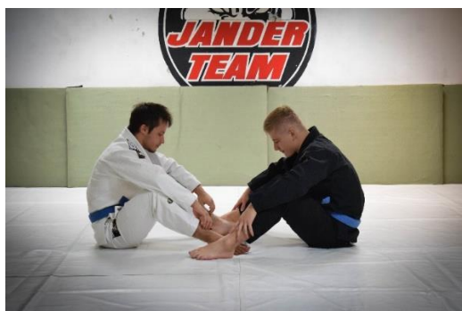
Slika 1. Početna pozicija

Vježbači zauzimaju sjedeći položaj imajući pritom savijene noge u koljenima. Stopala dodiruju tlo, dlanovi su uz tijelo. Između njih nalazi se vrećica s pijeskom. Vježbači na zadani signal najprije međusobno pljesnu objema rukama, zatim dlanovima dotaknu podlogu iza sebe, te nakon toga pokušavaju što brže dohvatiti vrećicu. Pobjednik je onaj koji prije dohvati vrećicu.