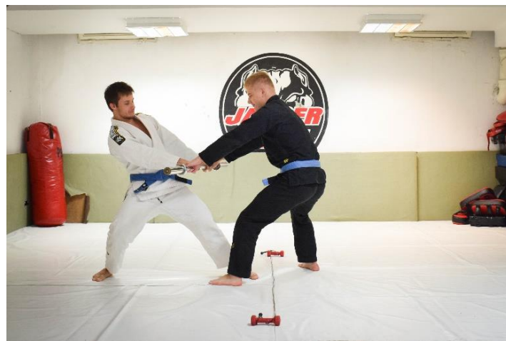
Slika 17. Suvježbač prelazi granicu