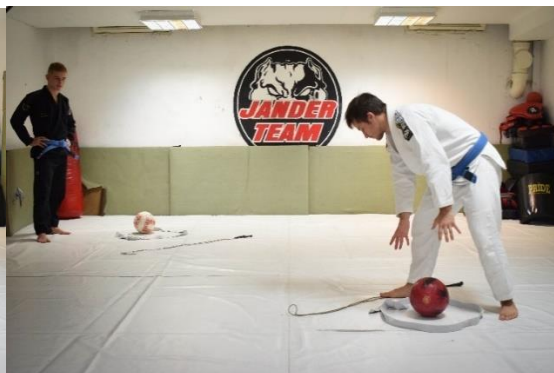
Slika 29. Igrač ostavlja loptu u obruču i vraća na poziciju starta