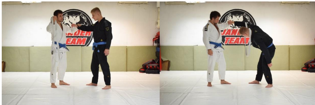
Slika 21. Početna pozicija

Vježba se izvodi u paru. Kao pomagalo u ovoj vježbi koristi se pojas zavezan na vrhovima. Vježbači se primaju za ruke. Vježba počinje tako da se vježbač počinje provlačiti kroz pojas, ne pomažući si pritom sa slobodnom rukom. Cilj vježbe je prenijeti pojas od vježbača do suvježbača.