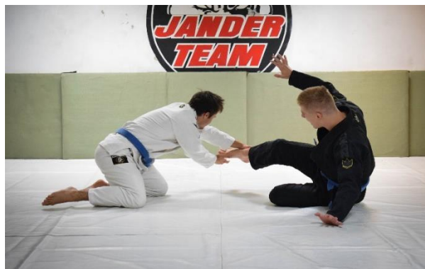
Slika 7. Pobjednik dodiruje suvježbača