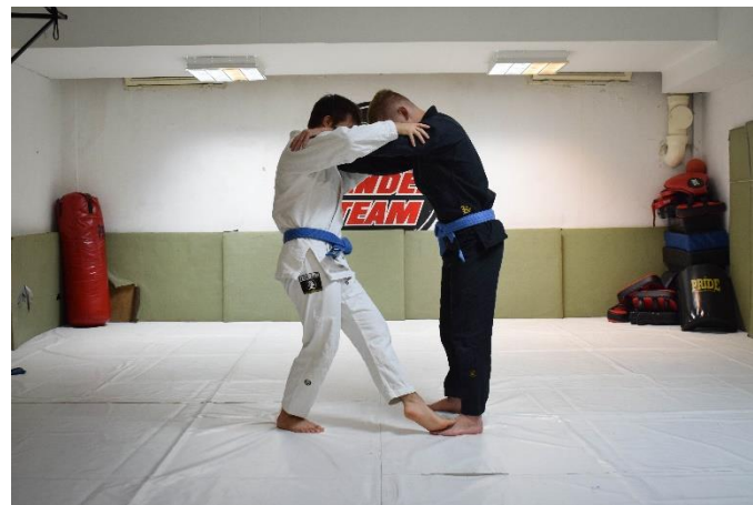
Slika 12. Dodirivanje stopala