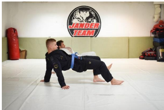
Slika 25. Izvođenje vježbe

U ovoj vježbi vježbači zauzimaju stav na način da tijelo iz ležećeg položaja na leđima podignu upirući se nogama i rukama. Vježba se izvodi na način da se vježbači kreću po prostoru u zadanom položaju.