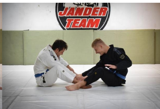
Slika 4. Hvatanje vrećice