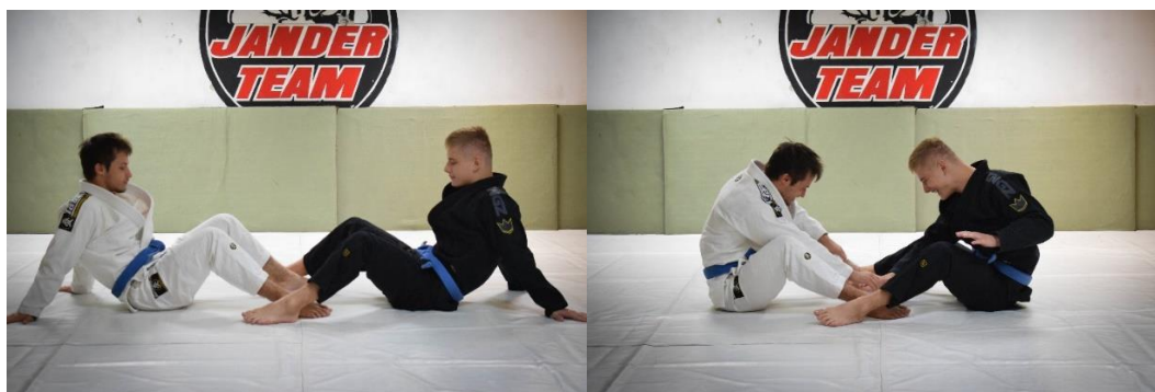
Slika 3. Dodirivanje podloge