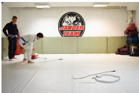
Slika 28. Početna pozicija

Vježba se izvodi u formaciji kolone. Na podlogu za vježbanje postavljena je startna linija, te dva obruča. Prvi obruč nalazi se iza startne linije i u njemu se nalaze dvije lopte, dok je drugi obruč udaljen 4 m od startne linije. Prvi vježbač kreće na zadani signal uzimajući jednu loptu iz prvog obruča, te trčeći odlazi do drugog obruča i u njemu ostavlja loptu. Zatim, ponavlja isti postupak nakon povratka do prvog obruča te na kraju odlazi na startnu poziciju, dajući pritom dodirivanjem dlana suvježbaču znak za kretanje, koji ponavlja postupak.