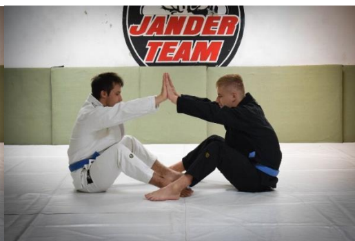
Slika 2. Pljesak objema rukama