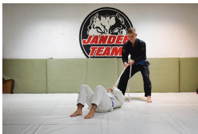
Slika 9. Suvježbač povlači vježbača, drugi dio vježbe