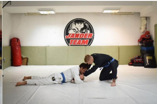
Slika 14. Otimanje lopte