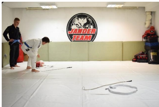
Slika 28. Početna pozicija

Vježba se izvodi u formaciji kolone. Na podlogu za vježbanje postavljena je startna linija, te dva obruča. Prvi obruč nalazi se iza startne linije i u njemu se nalaze dvije lopte, dok je drugi obruč udaljen 4 m od startne linije. Prvi vježbač kreće na zadani signal uzimajući jednu loptu iz prvog obruča, te trčeći odlazi do drugog obruča i u njemu ostavlja loptu. Zatim, ponavlja isti postupak nakon povratka do prvog obruča te na kraju odlazi na startnu poziciju, dajući pritom dodirivanjem dlana suvježbaču znak za kretanje, koji ponavlja postupak.