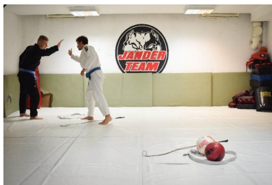
Slika 32. Davanje znaka za početak kretanja drugog suvježbača