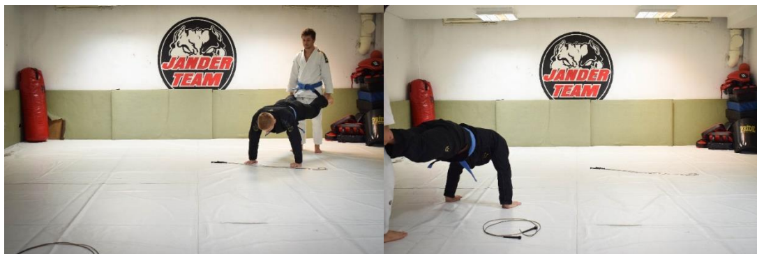
Slika 26. Početna pozicija

Na podlogu za vježbanje postavljene su dvije oznake koje predstavljaju startnu poziciju i mjesto promjene smjera. Vježbači kreću od startne pozicije na način da vježbač drži noge suvježbača koji za to vrijeme ima uprte ruke u tlo. Kreću se na način da se suvježbač pomiče rukama prema naprijed dok mu vježbač drži noge i prati njegov smjer kretanja. Kada dođu do oznake za promjenu smjera, zaobilaze ju i vraćaju se na startnu poziciju.